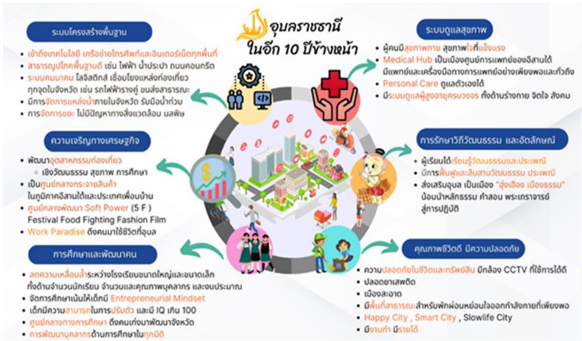
ภาพที่ ๒ แสดงภาพอนาคตของอุบลราชธานีในอีก ๑๐ ปีข้างหน้า