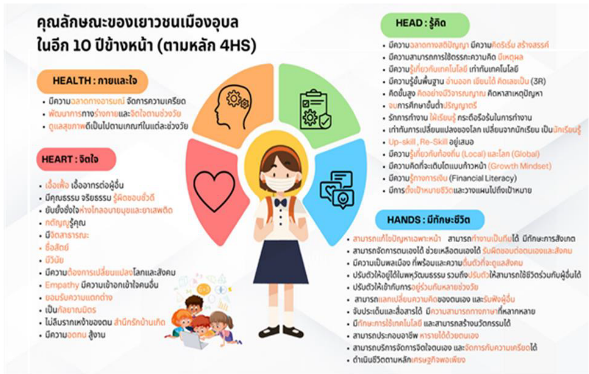
ภาพที่ ๓ แสดงคุณลักษณะของเยาวชนเมืองอุบลในอีก ๑๐ ปีข้างหน้า (ตามหลัก 4HS)