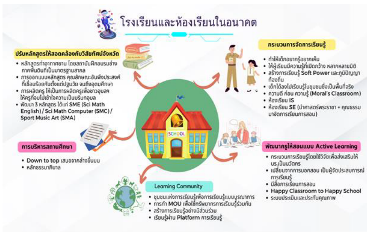
ภาพที่ ๔ แสดง โรงเรียน และ ห้อง เรียน ใน อนาคต

จากการวิเคราะห์ข้อมูลที่ได้จากการทำกิจกรรมการประชุมเชิงปฏิบัติการแบบมีส่วนร่วมเพื่อออกแบบและขับเคลื่อนพื้นที่นวัตกรรม การศึกษาโดยใช้กระบวนการประเมินเชิงพัฒนา (Developmental Evaluation) กิจกรรมระดมความคิดเห็น “พลังเด็กและเยาวชนจังหวัดอุบลราชธานี มาเป็นข้อมูลพื้นฐานในการกำหนดวิสัยทัศน์ เป้าหมาย ของหลักสูตรแกนกลางการศึกษาขั้นพื้นฐานพื้นที่นวัตกรรมการศึกษาจังหวัดอุบลราชธานี กรอบหลักสูตรจังหวัดอุบลราชธานี มีอิสระในการนำไปใช้ เปิดกว้าง ก้าวข้ามวิชา เน้นความสำเร็จที่ สมรรถนะ นักเรียนทำได้ ทำเป็น และนำไปใช้ในชีวิตจริงได้ โดยกรอบหลักสูตรจังหวัดอุบลราชธานี มุ่งเน้นการผลิตลูกหลานชาวจังหวัดอุบลราชธานี ให้สอดคล้องกับแผนพัฒนาจังหวัดอุบลราชธานี ซึ่งมี สำคัญของเป้าหมายการพัฒนาจังหวัด ดังนี้ “ เมืองน่าอยู่ทันสมัย เกษตรปลอดภัยมูลค่าสูง เศรษฐกิจชีวภาพ ศูนย์กลางการค้า การลงทุน เมืองท่องเที่ยวแห่งความสุขหลายมิติสู่สากล ” ซึ่งนักเรียนที่จบหลักสูตรของสถานศึกษาน่าจะไป แล้วเป็นอะไรก็ได้ตามความต้องการ ความถนัด ความสนใจ ตามสมรรถนะที่ระบุไว้ แต่ในที่สุดนักเรียนจะเติบโตเป็นคนอุบลราชธานีที่มีคุณลักษณะ ตามมาตรฐาน การศึกษาของชาติ จึงได้กำหนดกรอบหลักสูตรของจังหวัดอุบลราชธานี Ubon “SCEMP” Model ได้กำหนดเนื้อหาตามบริบทของฐานทุนการพัฒนาจังหวัดไว้ ๕ เรื่อง ดังนี้