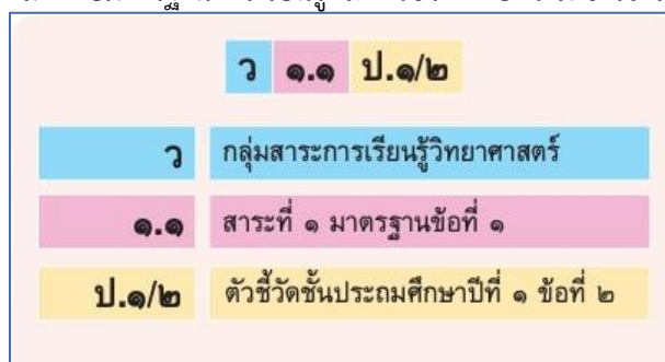
ภาพที่ ๗ แสดงการกำหนดรหัสรายวิชา

หลักสูตรได้มีการกำหนดรหัสกำกับมาตรฐานการเรียนรู้และตัวชี้วัด เพื่อความเข้าใจและให้สื่อสารตรงกัน ดังนี้