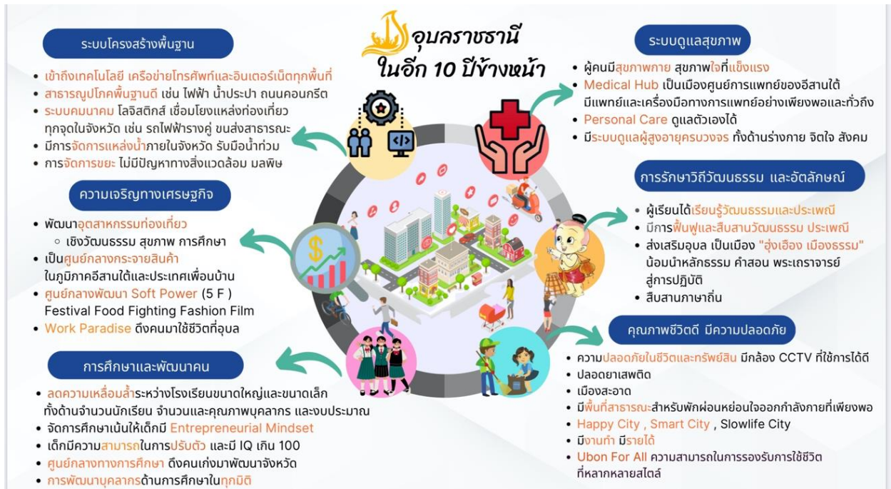
ภาพที่ ๑ แสดงภาพอนาคตของอุบลราชธานีในอีก ๑๐ ปีข้างหน้า