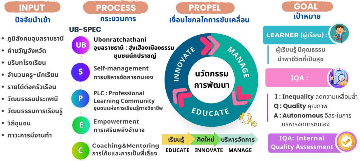
ภาพที่ ๕ แสดงกระบวนการพัฒนาพื้นที่นวัตกรรมการศึกษาจังหวัดอุบลราชธานี