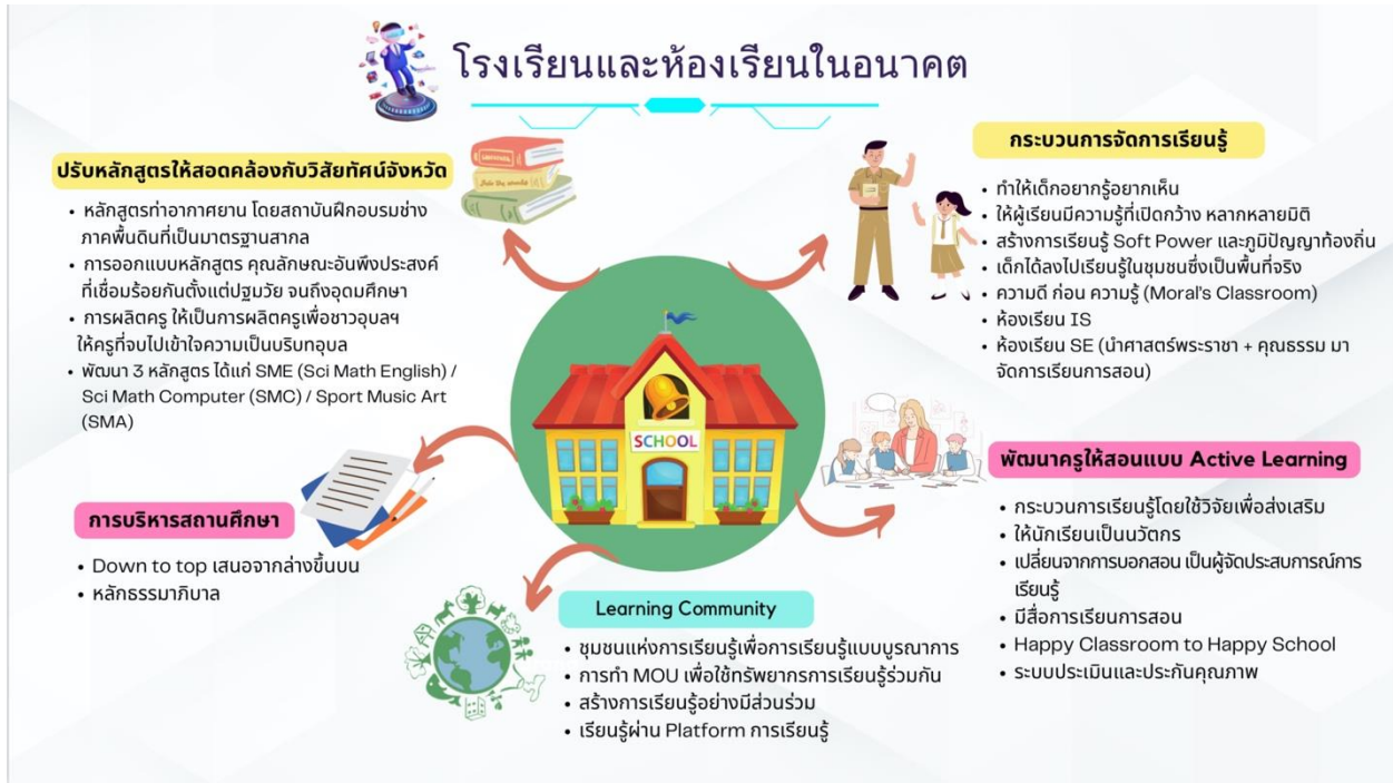
ภาพที่ ๓ แสดงโรงเรียนและห้องเรียนในอนาคต