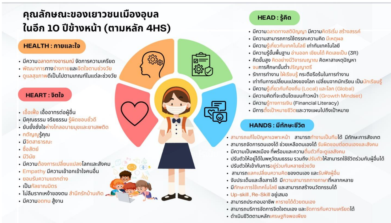
ภาพที่ ๒ แสดงคุณลักษณะของเยาวชนเมืองอุบลในอีก ๑๐ ปีข้างหน้า (ตามหลัก 4HS)

หลักสูตรสถานศึกษา โรงเรียนบ้านหนองหล่มหนองเหล่า พุทธศักราช ๒๕๖๗ ตามหลักสูตรแกนกลางการศึกษาขั้นพื้นฐาน พื้นที่นวัตกรรมการศึกษาจังหวัดอุบลราชธานี พุทธศักราช ๒๕๖๗