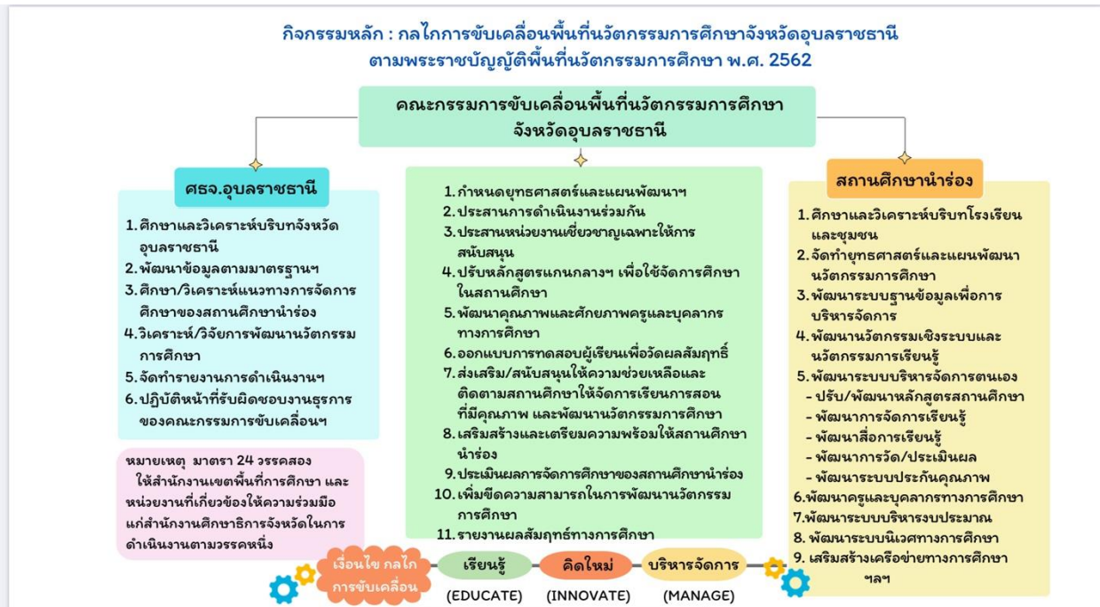
ภาพที่ ๖ แสดงกิจกรรมหลัก : กลไกการขับเคลื่อนพื้นที่นวัตกรรมการศึกษาจังหวัดอุบลราชธานี

หลักสูตรสถานศึกษา โรงเรียนบ้านหนองหล่มหนองเหล่า พุทธศักราช ๒๕๖๗ ตามหลักสูตรแกนกลางการศึกษาขั้นพื้นฐาน พื้นที่นวัตกรรมการศึกษาจังหวัดอุบลราชธานี พุทธศักราช ๒๕๖๗