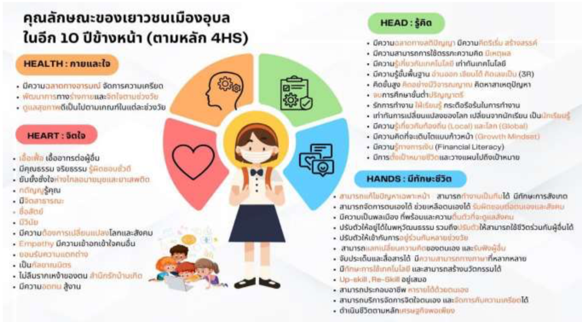
แผนภาพ ลักษณะของเยาวชนเมืองอุบล ในอีก 10 ปีข้างหน้า (ตามหลัก 4Hs)

1. โรงเรียนและห้องเรียนในอนาคต โจทย์ คือ จากที่เราเห็นภาพอนาคตของเมืองและคนรุ่นใหม่ใน 10 ปี ข้างหน้าแล้ว ท่านต้องการเห็นโรงเรียนและห้องเรียนปรับเปลี่ยนอย่างไร ผลจากระดมความคิดเป็นปรากฏดังแผนภาพ