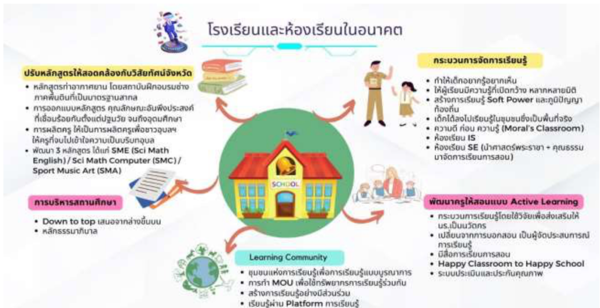
แผนภาพ 15 โรงเรียนและห้องเรียนในอนาคต

1. โรงเรียนและห้องเรียนในอนาคต โจทย์ คือ จากที่เราเห็นภาพอนาคตของเมืองและคนรุ่นใหม่ใน 10 ปี ข้างหน้าแล้ว ท่านต้องการเห็นโรงเรียนและห้องเรียนปรับเปลี่ยนอย่างไร ผลจากระดมความคิดเป็นปรากฏดังแผนภาพ