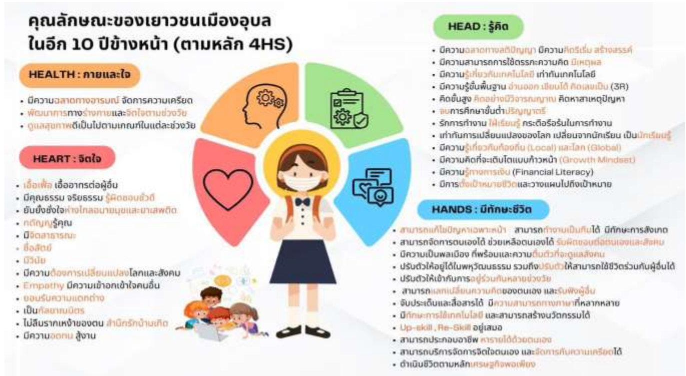
แผนภาพ ลักษณะของเยาวชนเมืองอุบล ในอีก 10 ปีข้างหน้า (ตามหลัก 4Hs)

1.โรงเรียนและห้องเรียนในอนาคต โจทย์ คือ จากที่เราเห็นภาพอนาคตของเมืองและคนรุ่นใหม่ใน 10 ปี ข้างหน้า แล้ว ท่านต้องการเห็นโรงเรียนและห้องเรียนปรับเปลี่ยนอย่างไร ผลจากระดมความคิดเป็น ปรากฏดังแผนภาพ