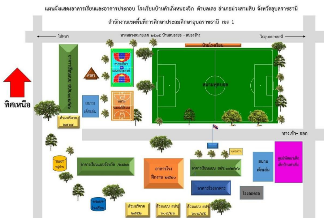
ภาพที่ ๑ แผนที่โรงเรียน

ปัจจุบันโรงเรียนบ้านคำแก้งหนองจิก เป็นโรงเรียนขนาดเล็ก เปิดสอน ๒ ระดับคือตั้งแต่ระดับก่อนประถมศึกษา (ชั้นอนุบาล ๒ - ๓) ระดับการศึกษาขั้นพื้นฐาน (ชั้นประถมศึกษาปีที่ ๑- ๖) มีเขตพื้นที่บริการ ๒หมู่บ้าน ได้แก่ หมู่ ๙ บ้านคำแก้ง, หมู่ ๑๐ บ้านหนองจิก พื้นที่นอกเขตบริการประกอบด้วยบ้านน้ำคำแดง (อำเภอวังสามสี) บ้านโชคชัยและบ้านสร้างถ่อ (อำเภอเหล่าเสือโก้ก) และโรงเรียนได้ทำข้อตกลงความร่วมมือกับองค์การบริหารส่วนตำบลเตยในการเปิดศูนย์พัฒนาเด็กก่อนวัยเรียน โดยจัดตั้งศูนย์เด็กเล็กในสถานศึกษาเพื่อเป็นการบริการชุมชนในหมู่บ้านคำแก้ง บ้านหนองจิก บ้านโนนขาวและบ้านนายูง ภาระงาน/ปริมาณงาน