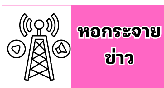
การ์ดหอกระจายข่าว