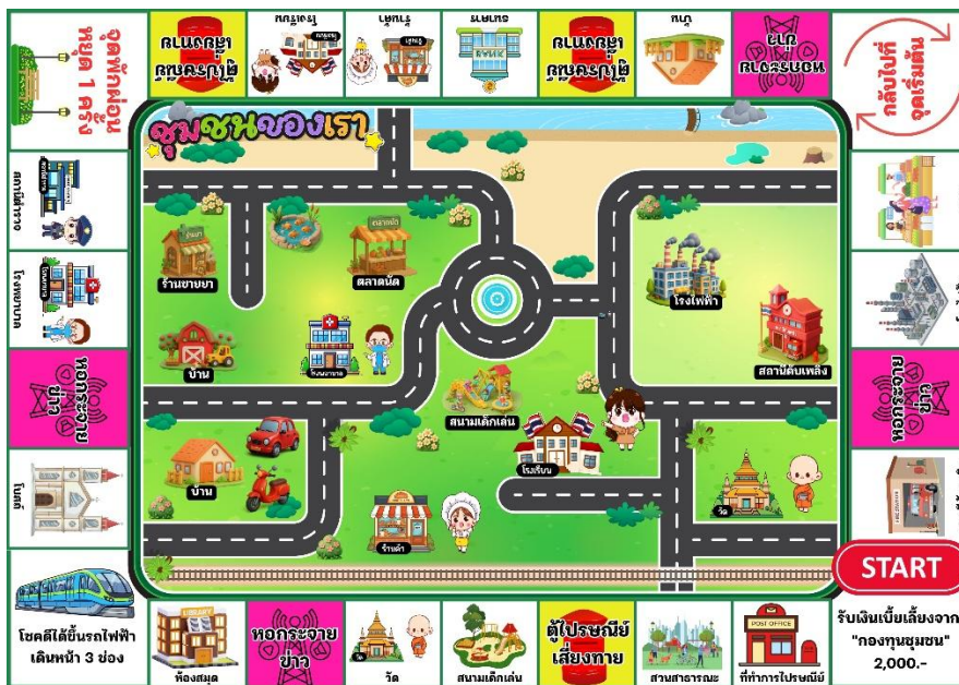
กระดานเกม