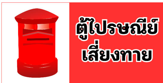
การ์ดตู้ไปรษณีย์เสียงทนาย