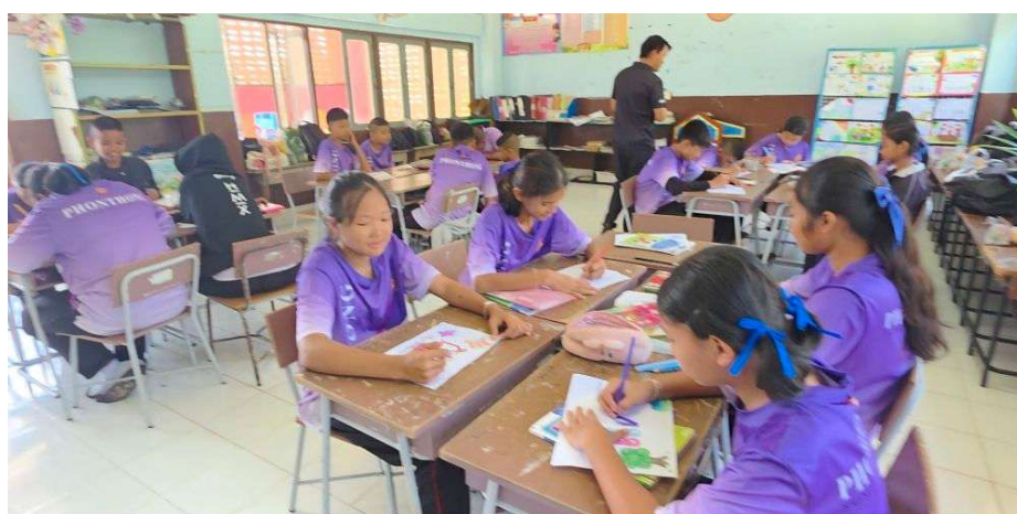
ภาพบรรยากาศการเรียนการสอน