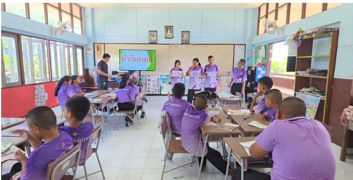
ผลงานนักเรียน