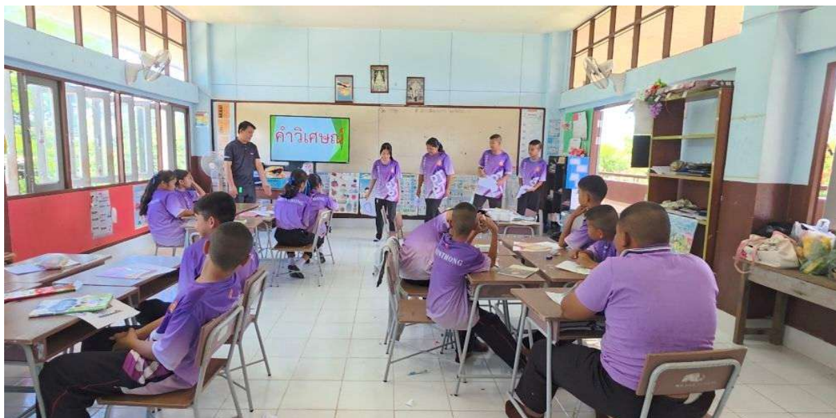
ภาพบรรยากาศการเรียนการสอน