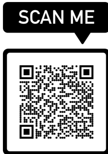
แบบฝึกทักษะ