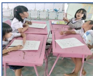
รูปภาพ นักเรียนทำงานกลุ่มแล้วนำเสนอหน้าชั้นเรียน