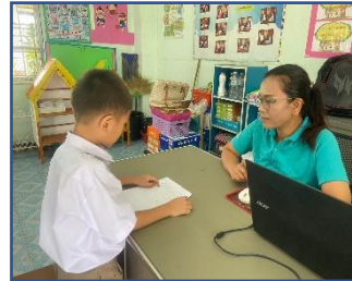
รูปภาพ การคัดกรองนักเรียนอ่านไม่ออกเขียนไม่ได้ชั้นประถมศึกษาปีที่ ๑

๒.๒ ขั้นวินิจฉัยปัญหา ขั้นตอนนี้จะเป็นการค้นหาสาเหตุการอ่านไม่ออกเขียนไม่คล่อง โดยสรุปการ วินิจฉัย ปัญหาด้านการอ่านการเขียนและการมีเจตคติที่ดีในด้านการอ่านและการเขียนได้ ดังนี้