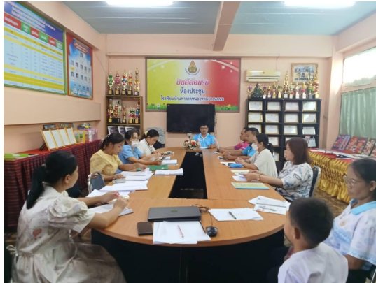
[ภาพที่ ๑ การประชุมชี้แจงรูปแบบการนิเทศแก่ครูผู้สอน]