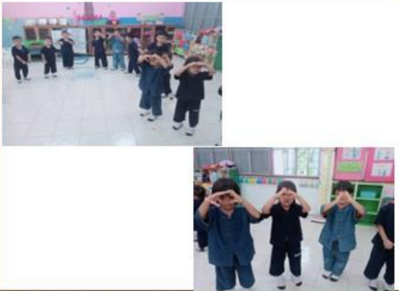
กิจกรรมการเคลื่อนไหวตามคำบรรยาย