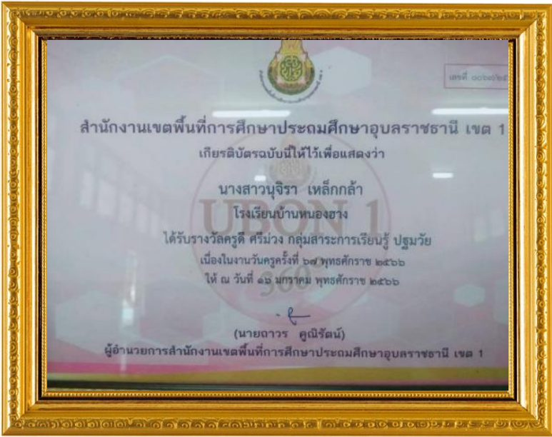
รางวัลระดับเขตพื้นที่