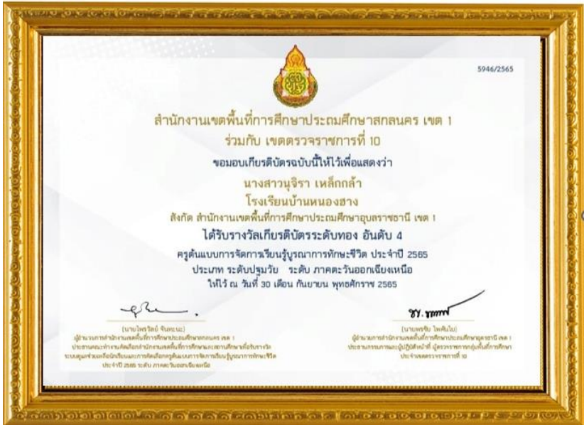
รางวัลระดับเขตพื้นที่