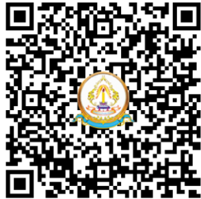
ตัวอย่างแผนการจัดประสบการณ์การเรียนรู้