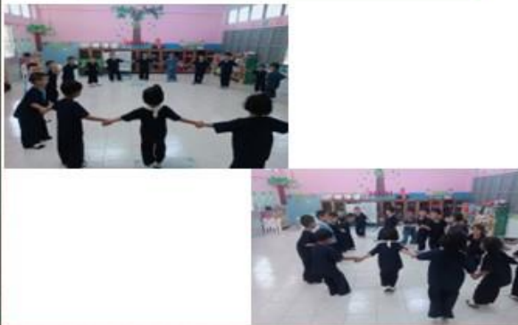
กิจกรรมการเคลื่อนไหวตามคำสั่ง