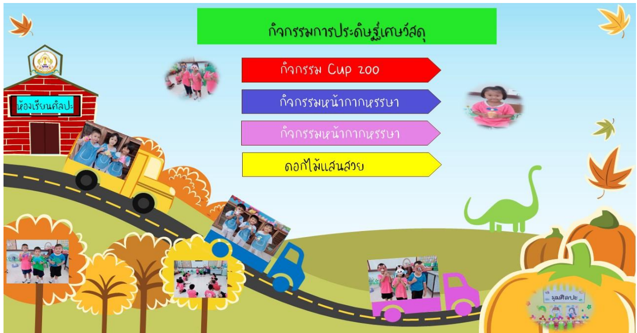
ภาพ ตัวอย่างแนวทางการจัดกิจกรรมการเรียนรู้โดยใช้ชุดกิจกรรมศิลปะที่บูรณาการความคิดสร้างสรรค์เพื่อเสริมสร้างแรงจูงใจในการสร้างสรรค์งานศิลปะสำหรับเด็กปฐมวัย

กิจกรรมการประดิษฐ์เศษวัสดุ หมายถึง กิจกรรมที่เปิดโอกาสให้เด็กๆ ได้นำวัสดุเหลือใช้หรือเศษวัสดุต่างๆ มาสร้างสรรค์เป็นของเล่น หรือของใช้ใหม่ๆ ด้วยจินตนาการและความคิดริเริ่มของตนเอง กิจกรรมนี้มีวัตถุประสงค์เพื่อส่งเสริมพัฒนาการด้านต่างๆ ของเด็ก เช่น พัฒนาความคิดสร้างสรรค์ จินตนาการ ทักษะการแก้ปัญหา และยังช่วยปลูกฝังจิตสำนึกในการรักษาสิ่งแวดล้อมและการนำวัสดุกลับมาใช้ประโยชน์ ส่งเสริมความคิดสร้างสรรค์และจินตนาการ เด็กจะได้เรียนรู้ที่จะมองเห็นคุณค่าของสิ่งของเหลือใช้ และนำมาประยุกต์ใช้ในรูปแบบต่างๆ ตามจินตนาการของตนเอง และพัฒนาทักษะการแก้ปัญหา การประดิษฐ์ของเล่นจากเศษวัสดุอาจต้องใช้ทักษะในการแก้ปัญหาเฉพาะหน้า เพื่อให้ได้ผลงานตามที่ต้องการ