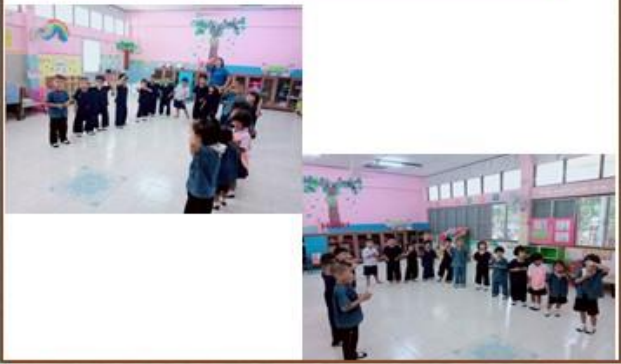
กิจกรรมการเคลื่อนไหวตามบทเพลง