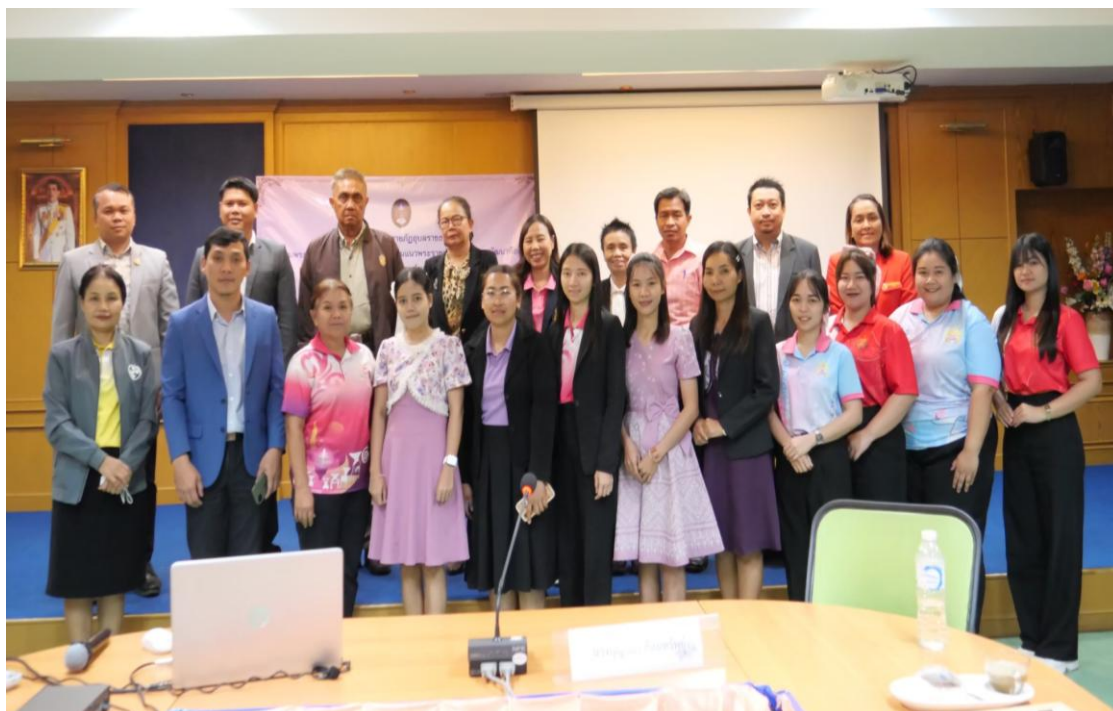
ภาพส่งเสริมครูเข้ารับการอบรมด้านคุณธรรมจริยธรรม ณ มหาวิทยาลัยราชภัฏอุบลราชธานี