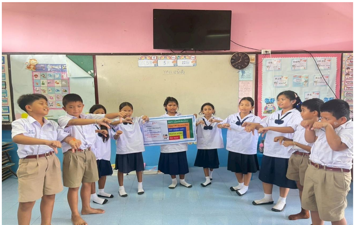
ภาพครูนำกิจกรรมกิจกรรมคิด ถามตอบจากสถานการณ์ที่กำหนดขึ้น (ดี ชั่ว ปกติ) เข้าสู่ห้องเรียน