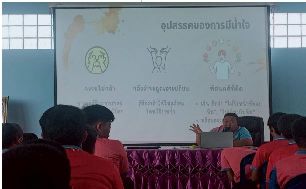
ภาพถ่ายมัธยมรุ่นใหม่ มีน้ำใจไม่กลั่นแกล้งเพื่อน