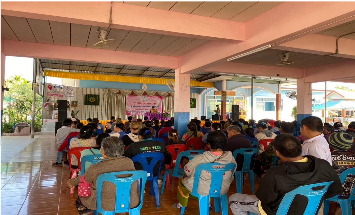
ภาพการประชุมผู้ปกครองนักเรียนเพื่อสร้างความเข้าใจในการทำงาน