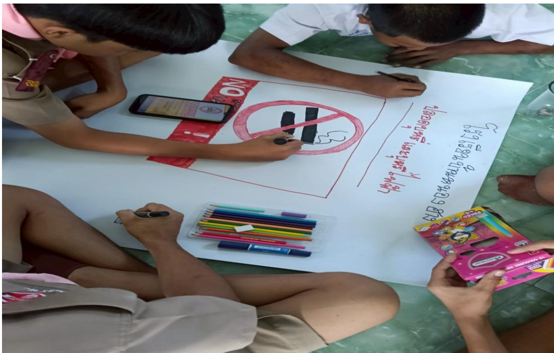
ภาพกิจกรรมอบรมนักเรียนเกี่ยวกับภัยร้ายยาเสพติด ในวันที่ ๒๙ พฤษภาคม ๒๕๖๘ เพื่อให้ความรู้แก่นักเรียนเกี่ยวกับพิษร้ายของบุหรี่/บุหรี่ไฟฟ้า

๕) Motivation : เสริมแรงจูงใจ การให้กำลังใจ เพื่อให้ให้นักเรียนได้มีขวัญ และกำลังใจในการที่จะปฏิบัติหน้าที่ การทำความดี