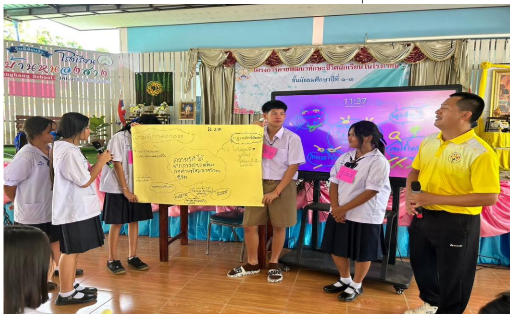
ภาพจัดกิจกรรมค่ายพัฒนาทักษะชีวิต ในวันที่ ๒๖ พฤษภาคม ๒๕๖๘