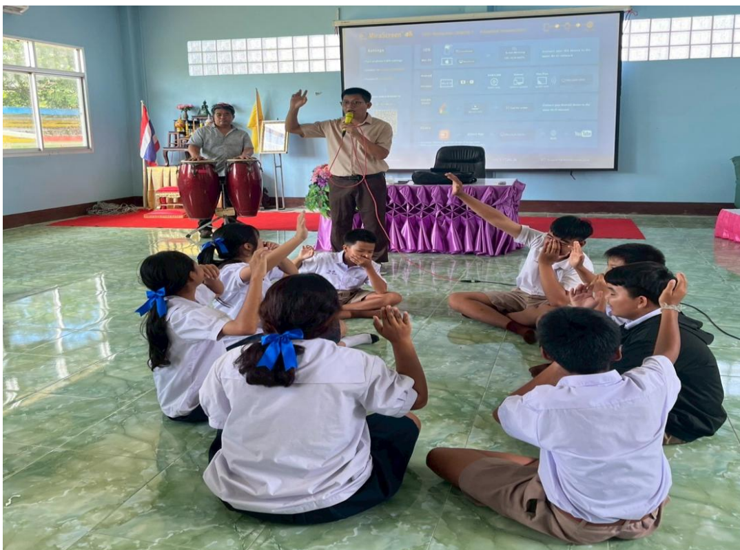
ภาพครูอบรมนักเรียนคาบแนะแนวทุกวันจันทร์ เกี่ยวกับคุณธรรม จริยธรรม มีจิตอาสาในการทำงาน