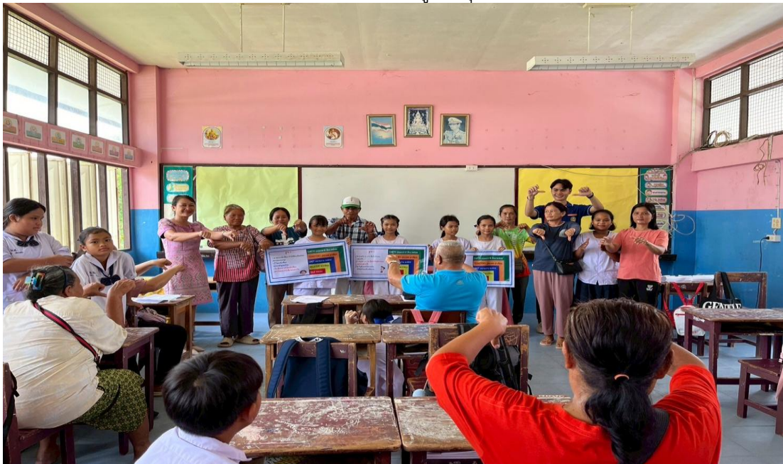
ภาพครูกับผู้ปกครองนักเรียนร่วมกันทำกิจกรรมกิจกรรมคิด ถามตอบจากสถานการณ์ที่กำหนดขึ้น (ดี ชั่ว ปกติ) ในห้องเรียนเพื่อสร้างความยั่งยืนในการปลูกฝังคุณธรรมจริยธรรม

๕. ครูกับผู้ปกครองนักเรียนร่วมกันทำกิจกรรมกิจกรรมคิด ถามตอบจากสถานการณ์ที่กำหนดขึ้น (ดี ชั่ว ปกติ) ในห้องเรียนเพื่อสร้างความยั่งยืนในการปลูกฝังคุณธรรมจริยธรรม