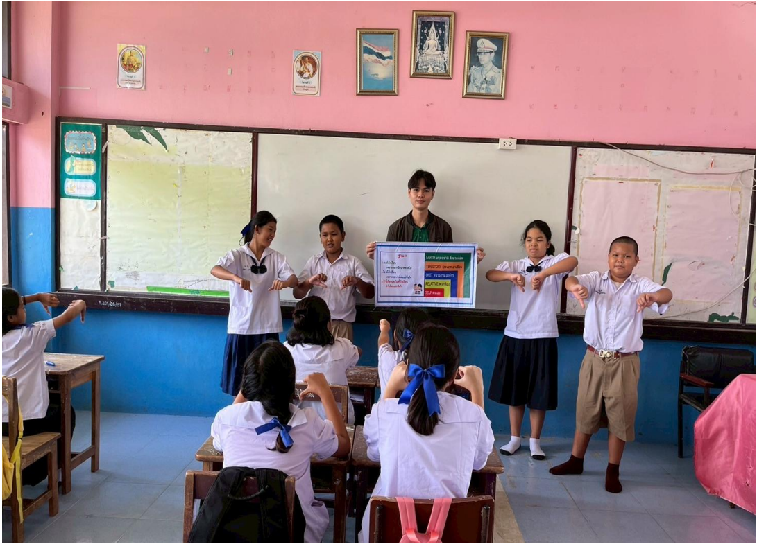
ภาพครูนำกิจกรรมกิจกรรมคิด ถามตอบจากสถานการณ์ที่กำหนดขึ้น (ดี ชั่ว ปกติ) เข้าสู่ห้องเรียน