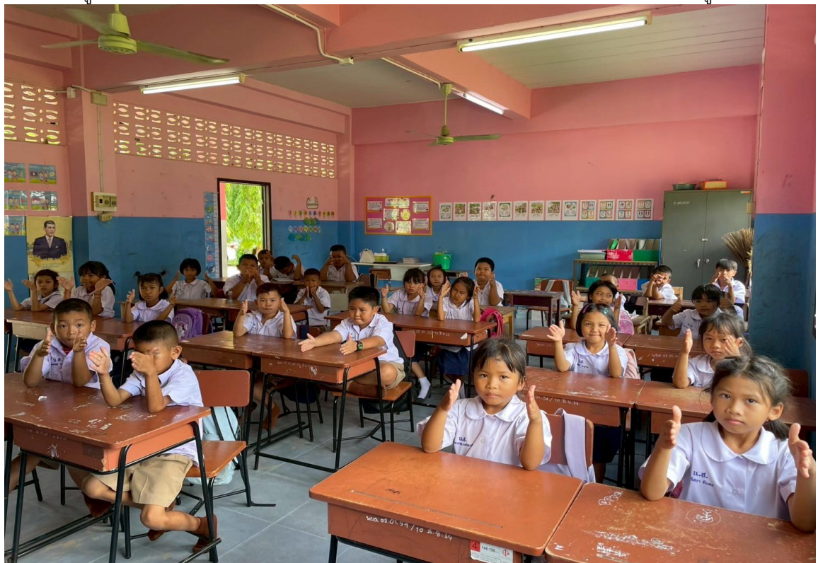
ภาพครูนำกิจกรรมกิจกรรมคิด ถามตอบจากสถานการณ์ที่กำหนดขึ้น (ดี ชั่ว ปกติ) เข้าสู่ห้องเรียน