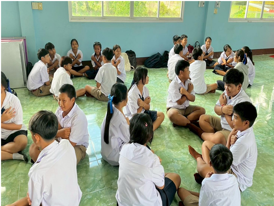
ภาพครูอบรมนักเรียนคาบแนะแนวทุกวันจันทร์ เกี่ยวกับคุณธรรม จริยธรรม มีจิตอาสาในการทำงาน

๖) Doing : การลงมือปฏิบัติด้านการพัฒนาคุณธรรมจริยธรรมและการ ดำเนินงานด้านจิตอาสาหรือจิต สาธารณะ เพื่อประโยชน์ส่วนรวม มี ๕ ขั้นตอน ดังนี้