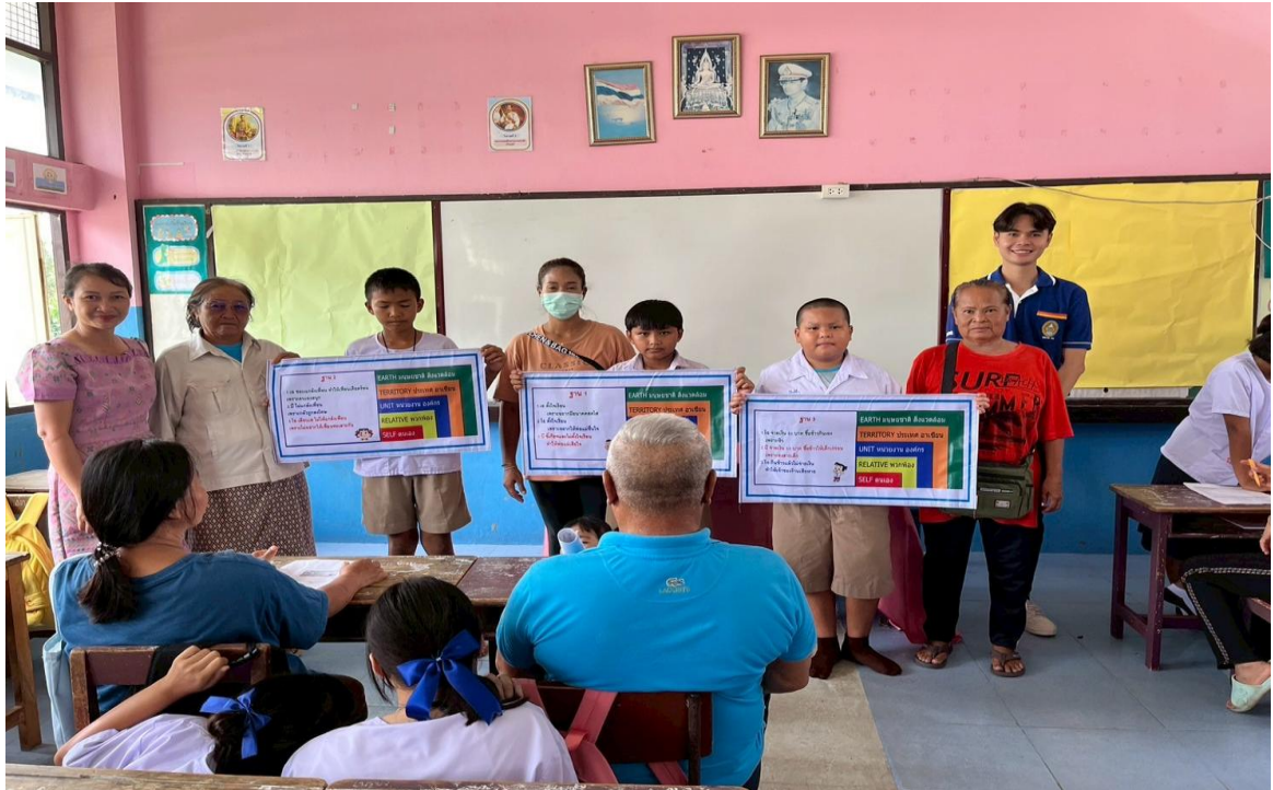
ภาพครูกับผู้ปกครองนักเรียนร่วมกันทำกิจกรรมกิจกรรมคิด ถามตอบจากสถานการณ์ที่กำหนดขึ้น (ดี ชั่ว ปกติ) ในห้องเรียนเพื่อสร้างความยั่งยืนในการปลูกฝังคุณธรรมจริยธรรม