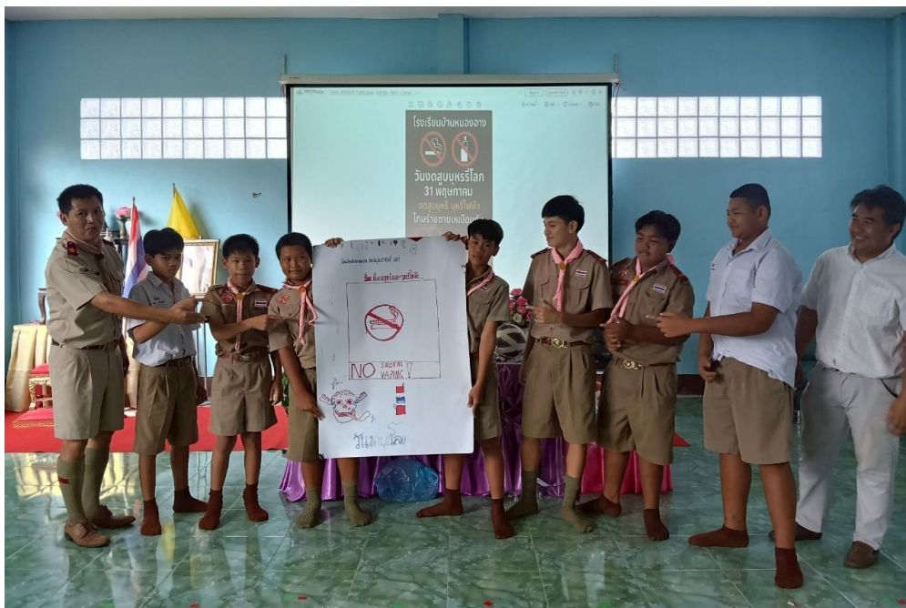
ภาพกิจกรรมอบรมนักเรียนเกี่ยวกับภัยร้ายยาเสพติด ในวันที่ ๒๙ พฤษภาคม ๒๕๖๘ เพื่อให้ความรู้แก่นักเรียนเกี่ยวกับพิษร้ายของบุหรี่/บุหรี่ไฟฟ้า