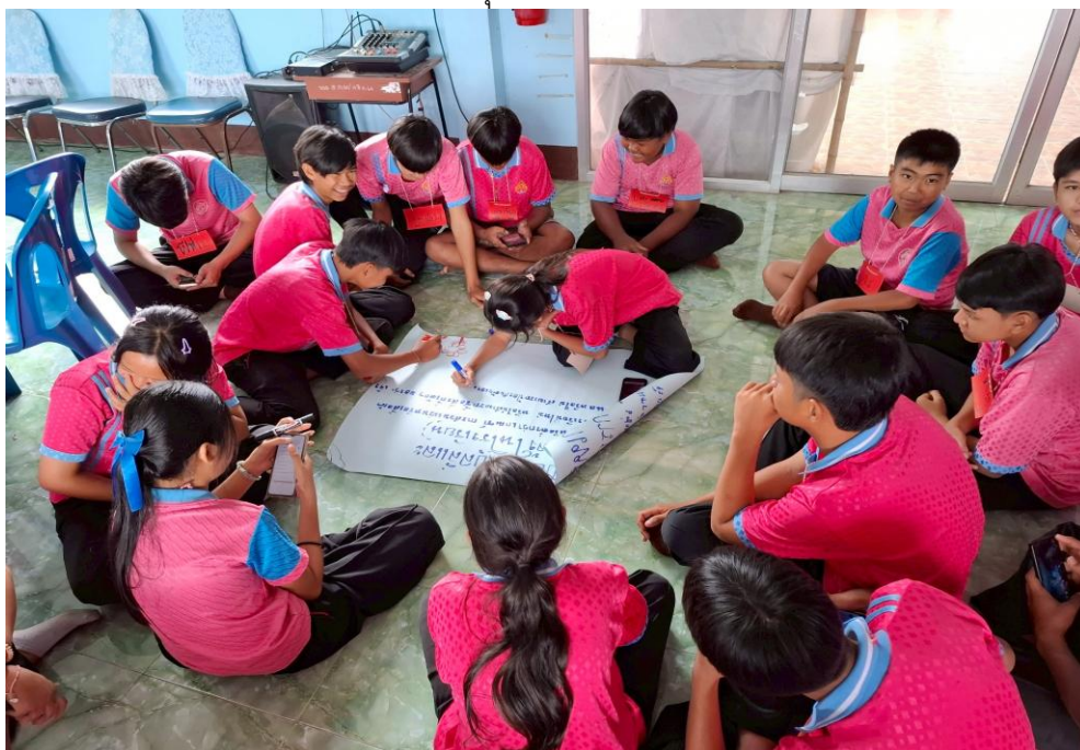
ภาพถ่ายมัธยมรุ่นใหม่ มีน้ำใจไม่กลั่นแกล้งเพื่อน ในวันที่ ๑๕ พฤษภาคม ๒๕๖๘