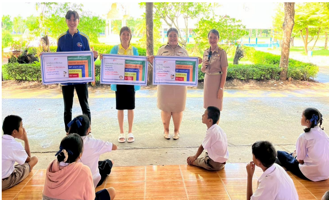
ภาพครูอบรมนักเรียนหน้าเสาธงเกี่ยวกับการปฏิบัติตนเองให้มีคุณธรรมจริยธรรม ด้วยการใช้ป้ายคำถามให้นักเรียนทำกิจกรรมคิด ถามตอบจากสถานการณ์ที่กำหนดขึ้น (ดี ชั่ว ปกติ)

๓. นักเรียนแกนนำ พาเพื่อนนำเสนองานหน้าเสาธงเกี่ยวกับการปฏิบัติตนเองให้มีคุณธรรมจริยธรรม ด้วยการใช้ป้ายคำถามให้นักเรียนทำกิจกรรมคิด ถามตอบจากสถานการณ์ที่กำหนดขึ้น (ดี ชั่ว ปกติ)