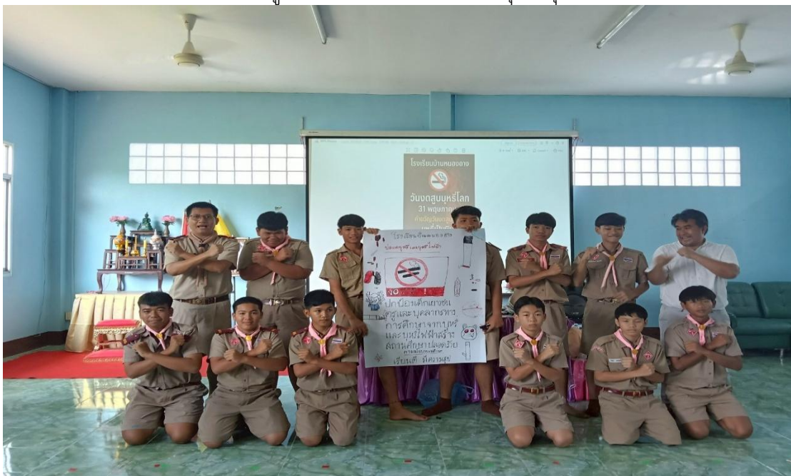
ภาพกิจกรรมอบรมนักเรียนเกี่ยวกับภัยร้ายยาเสพติด ในวันที่ ๒๙ พฤษภาคม ๒๕๖๘ เพื่อให้ความรู้แก่นักเรียนเกี่ยวกับพิษร้ายของบุหรี่/บุหรี่ไฟฟ้า