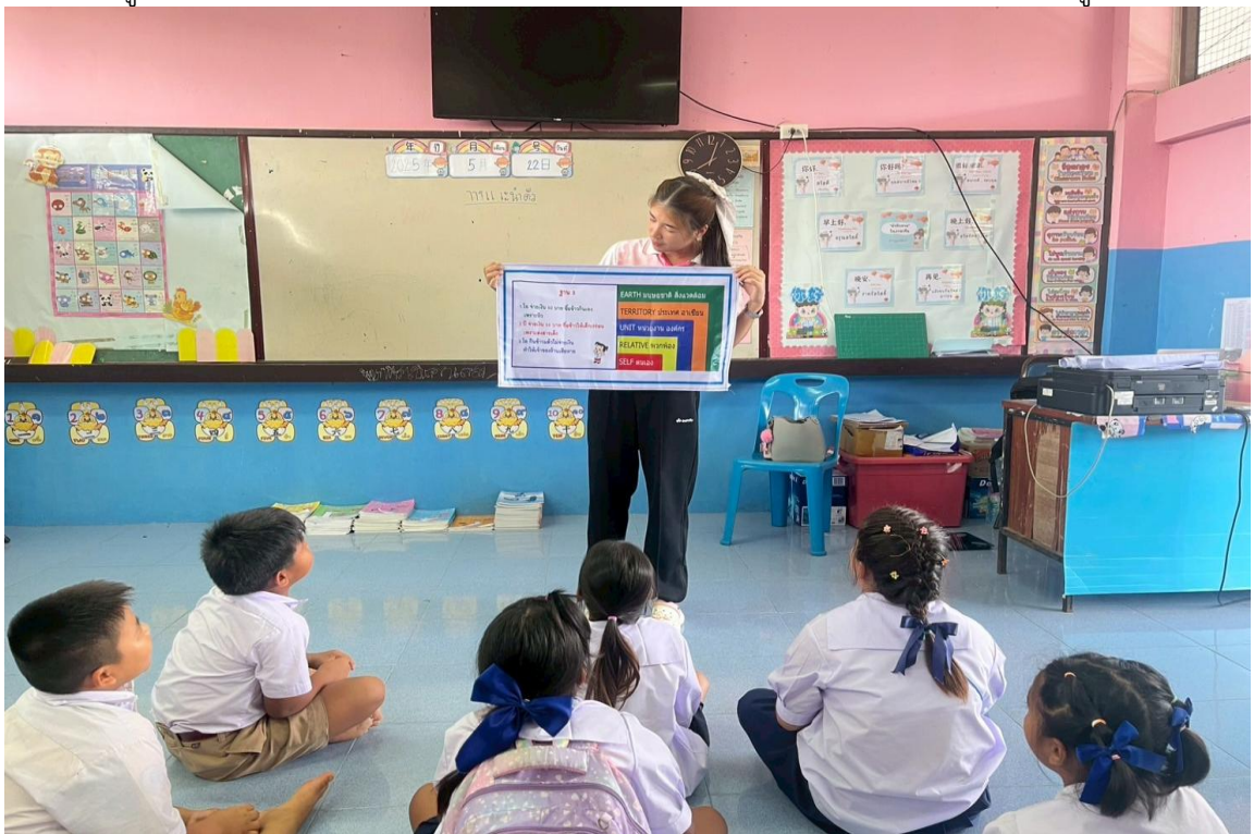
ภาพครูนำกิจกรรมกิจกรรมคิด ถามตอบจากสถานการณ์ที่กำหนดขึ้น (ดี ชั่ว ปกติ) เข้าสู่ห้องเรียน