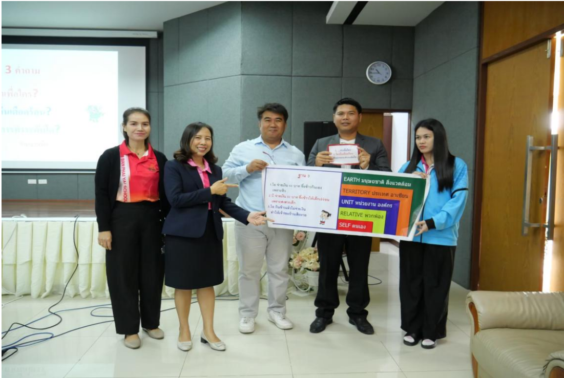
ภาพส่งเสริมครูเข้ารับการอบรมด้านคุณธรรมจริยธรรม ณ มหาวิทยาลัยราชภัฏอุบลราชธานี

๓) Team work : การสร้างทีมงานในการวางแผน การบริหารจัดการ การดำเนินงาน ให้ประสบความสำเร็จ เช่น จัดกิจกรรมส่งเสริมคุณธรรมจริยธรรมให้กับนักเรียนโดยเข้าค่ายมัธยมรุ่นใหม่ มีน้ำใจไม่กลั่นแกล้งเพื่อน ค่ายพัฒนาทักษะชีวิต การปฏิบัติกิจกรรมคุณธรรม (ดี ชั่ว ปกติ)