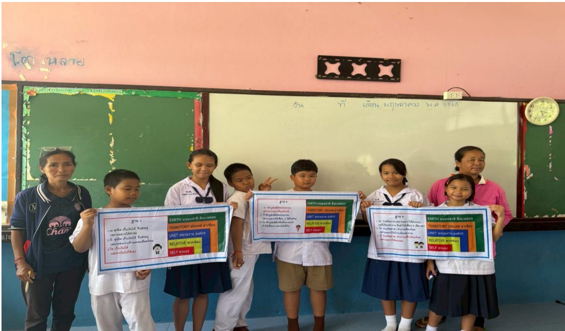
ภาพครูกับผู้ปกครองนักเรียนร่วมกันทำกิจกรรมกิจกรรมคิด ถามตอบจากสถานการณ์ที่กำหนดขึ้น (ดี ชั่ว ปกติ) ในห้องเรียนเพื่อสร้างความยั่งยืนในการปลูกฝังคุณธรรมจริยธรรม