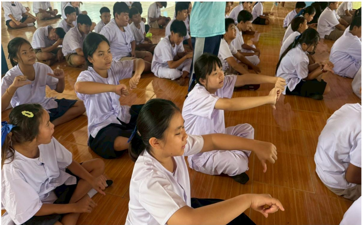
ภาพนักเรียนแกนนำ พาเพื่อนนำเสนอผลงานหน้าเสาธงเกี่ยวกับการปฏิบัติตนเองให้มีคุณธรรม จริยธรรม ด้วยการใช้ป้ายคำถามให้นักเรียนทำกิจกรรมคิด ถามตอบจากสถานการณ์ที่กำหนดขึ้น (ดี ชั่ว ปกติ)