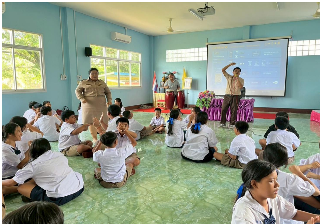
ภาพครอบรมนักเรียนคาบแนะแนวทุกวันจันทร์ เกี่ยวกับคุณธรรม จริยธรรม มีจิตอาสาในการทำงาน