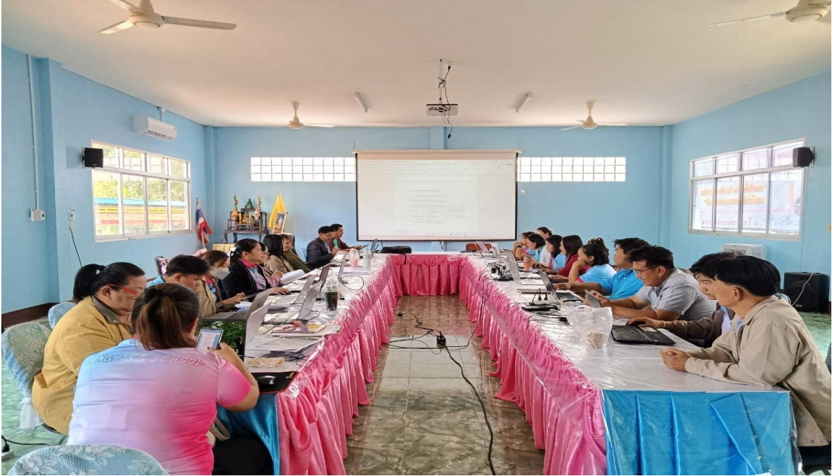
ภาพการประชุมครู เพื่อนำเสนอโครงการ ออกแบบกิจกรรมตามนโยบายผู้บริหาร