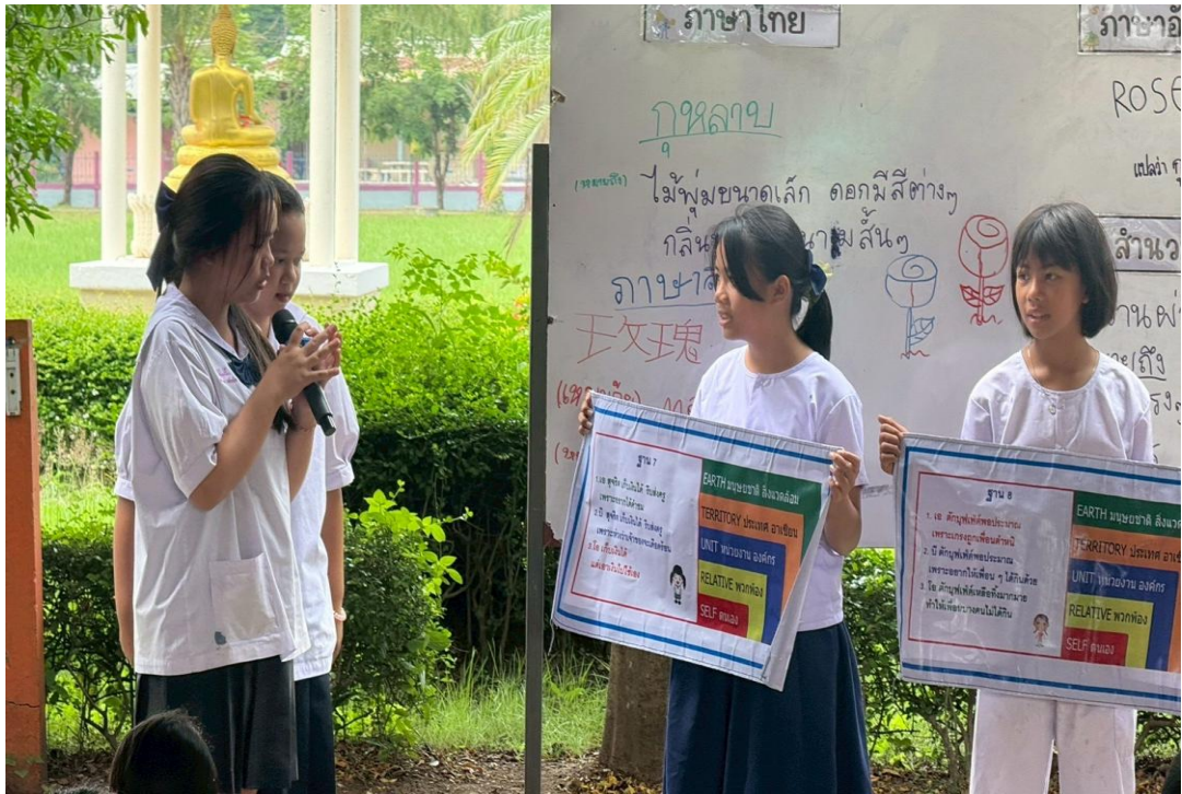
ภาพนักเรียนแกนนำ พาเพื่อนนำเสนอผลงานหน้าเสาธงเกี่ยวกับการปฏิบัติตนเองให้มีคุณธรรม จริยธรรม ด้วยการใช้ป้ายคำถามให้นักเรียนทำกิจกรรมคิด ถามตอบจากสถานการณ์ที่กำหนดขึ้น (ดี ชั่ว ปกติ)