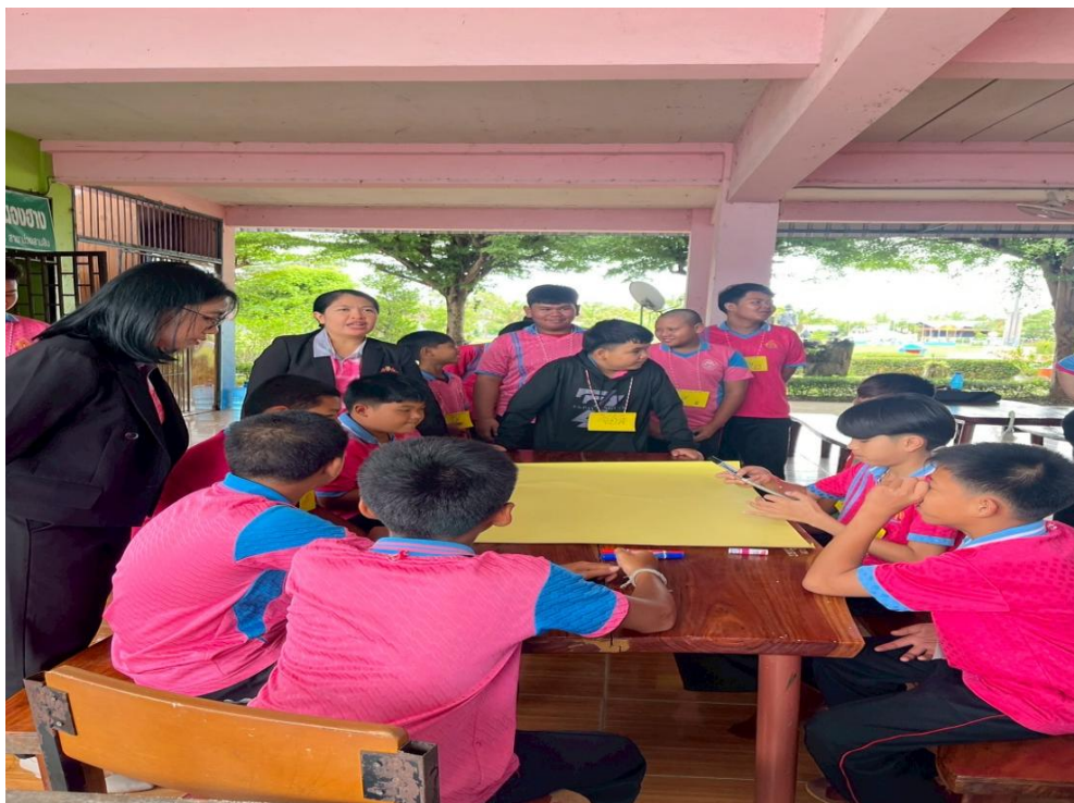
ภาพค่ายมัธยมรุ่นใหม่ มีน้ำใจไม่กลั่นแกล้งเพื่อน ในวันที่ ๑๕ พฤษภาคม ๒๕๖๘