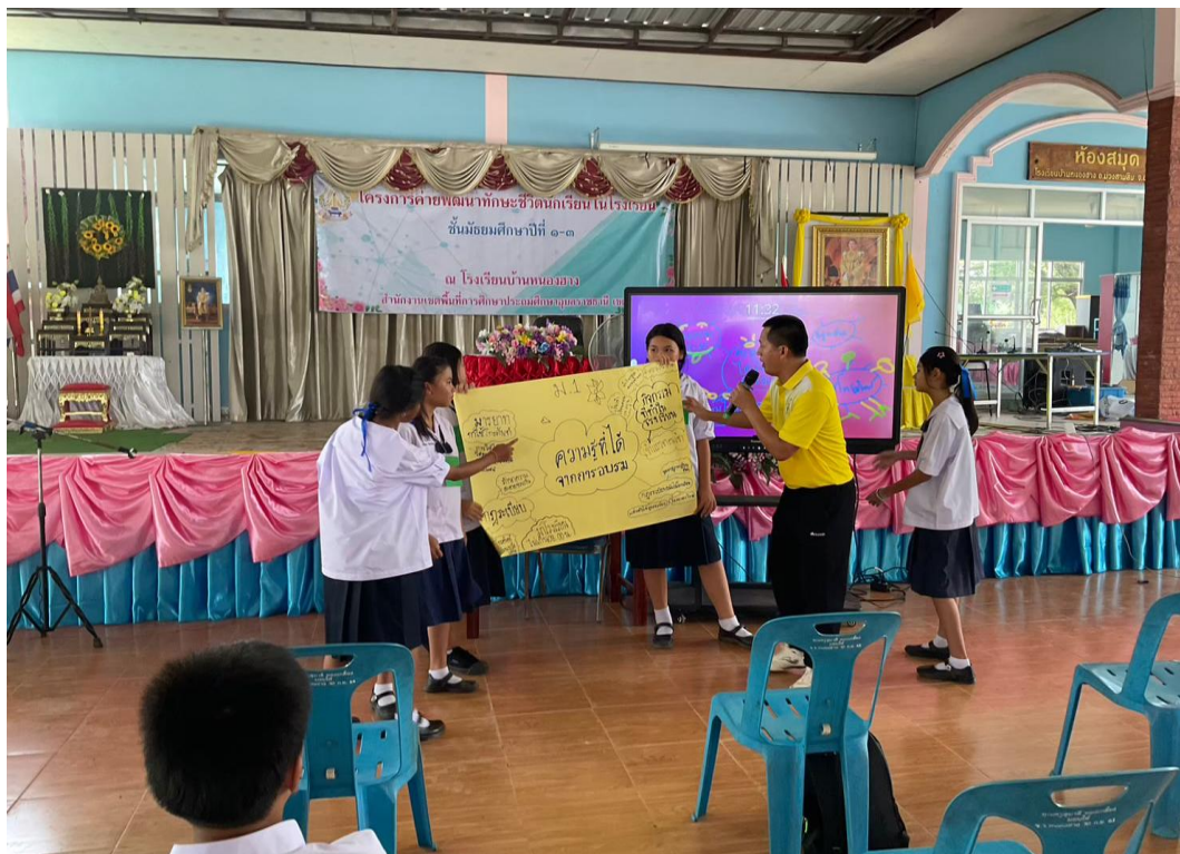
ภาพจัดกิจกรรมค่ายพัฒนาทักษะชีวิต ในวันที่ ๒๖ พฤษภาคม ๒๕๖๘