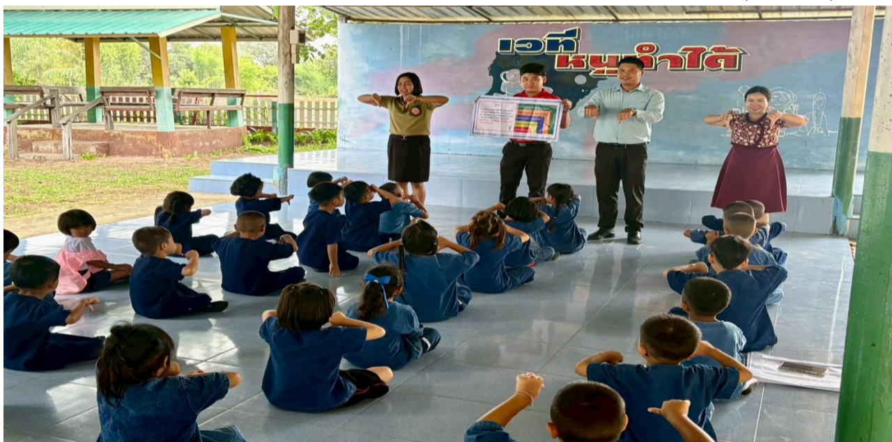
ภาพผู้อำนวยการและครูอบรมนักเรียนทุกคนหน้าเสาธงเกี่ยวกับการปฏิบัติตนเองให้มีคุณธรรมจริยธรรม ด้วยการใช้ ป้ายคำถามให้นักเรียนทำกิจกรรมคิด ถามตอบจากสถานการณ์ที่กำหนดขึ้น (ดี ชั่ว ปกติ)

๑. ผู้อำนวยการและครูอบรมนักเรียนทุกคนหน้าเสาธงเกี่ยวกับการปฏิบัติตนเองให้มีคุณธรรม จริยธรรม ด้วยการใช้ป้ายคำถามให้นักเรียนทำกิจกรรมคิด ถามตอบจากสถานการณ์ที่กำหนดขึ้น (ดี ชั่ว ปกติ)