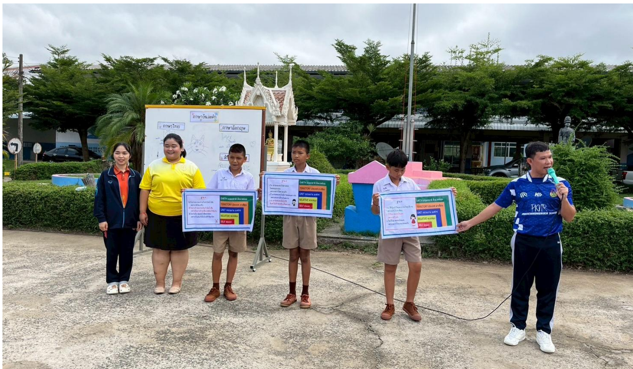
ภาพครูอบรมนักเรียนหน้าเสาธงเกี่ยวกับการปฏิบัติตนเองให้มีคุณธรรมจริยธรรม ด้วยการใช้ป้ายคำถามให้นักเรียนทำกิจกรรมคิด ถามตอบจากสถานการณ์ที่กำหนดขึ้น (ดี ชั่ว ปกติ)