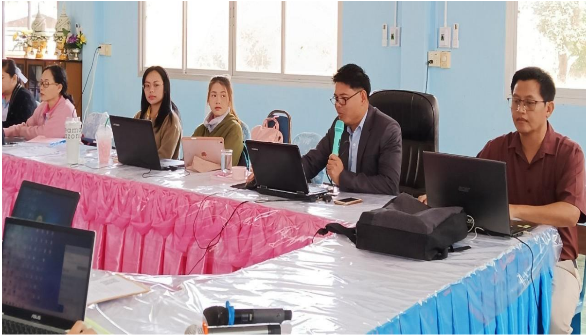
ภาพประชุมคณะทำงานการสร้างทีมงานในการวางแผน การบริหารจัดการ

๔) Attitude: การสร้างทัศนคติที่ดีให้เกิดขึ้นเพื่อให้ครูและบุคลากร ทางการศึกษาและนักเรียน ได้ตระหนักในหน้าที่ความรับผิดชอบ มีจิตอาสาหรือจิตสาธารณะ