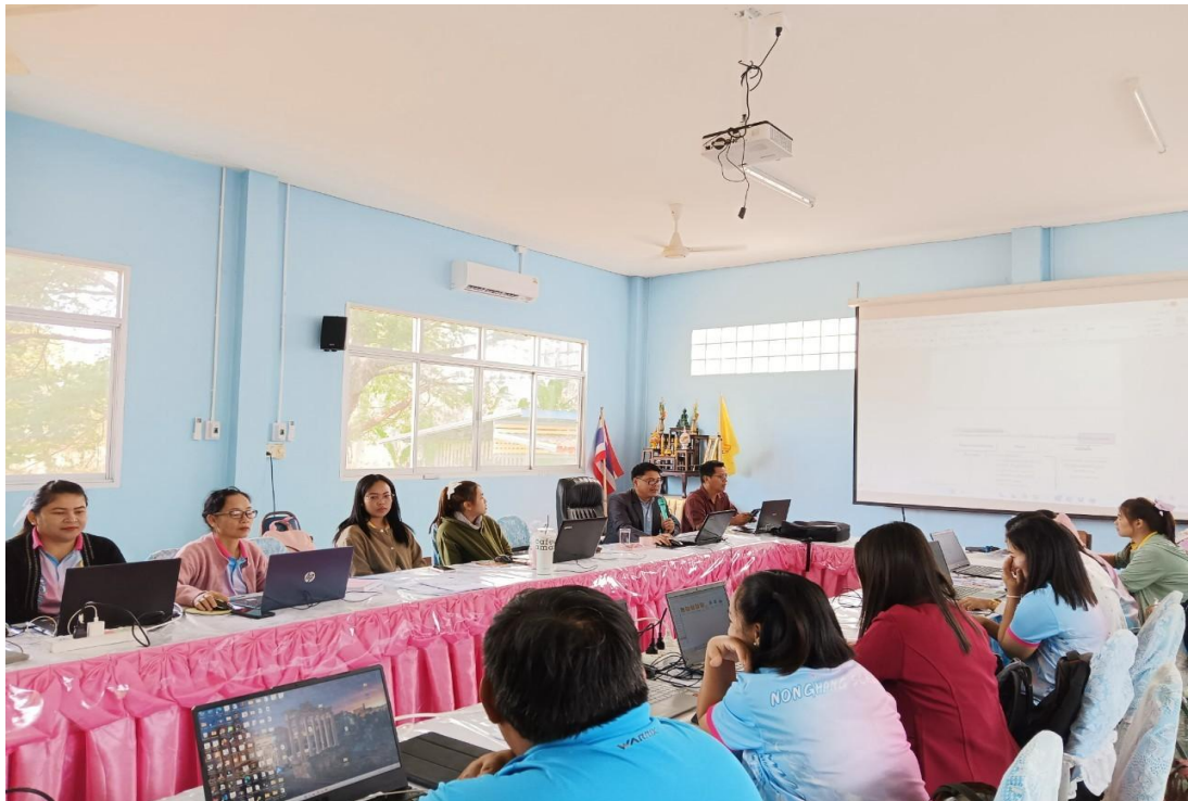
ภาพการประชุมข้าราชการครูและบุคลากรทางการศึกษา เพื่อสรุปผลการดำเนินงาน