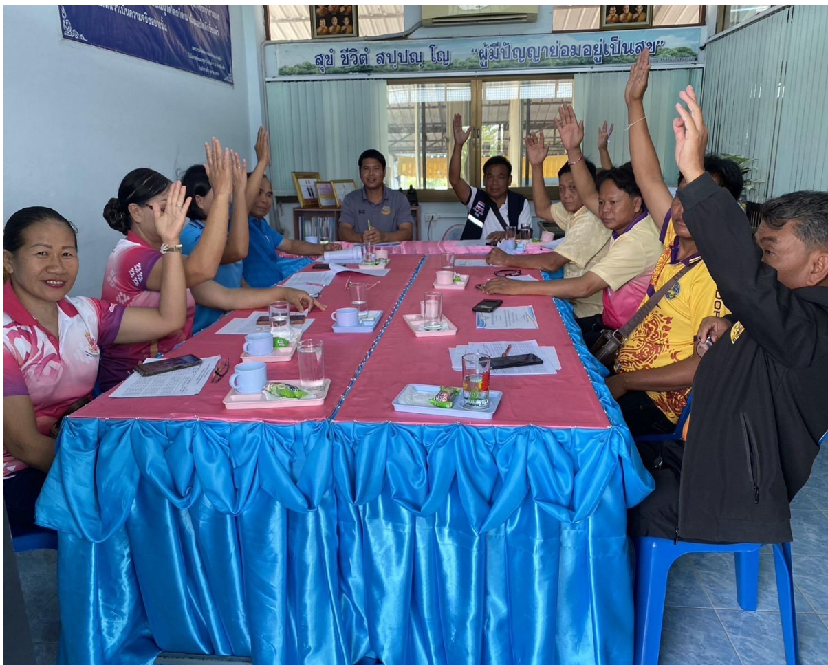
ภาพการประชุมคณะกรรมการสถานศึกษาขั้นพื้นฐานเพื่อสร้างความเข้าใจในการทำงาน