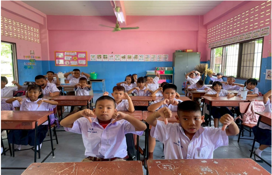
ภาพครูนำกิจกรรมกิจกรรมคิด ถามตอบจากสถานการณ์ที่กำหนดขึ้น (ดี ชั่ว ปกติ) เข้าสู่ห้องเรียน