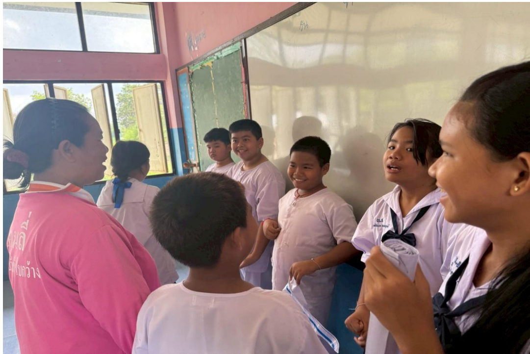
ภาพครูกับผู้ปกครองนักเรียนร่วมกันทำกิจกรรมกิจกรรมคิด ถามตอบจากสถานการณ์ที่กำหนดขึ้น (ดี ชั่ว ปกติ) ในห้องเรียนเพื่อสร้างความยั่งยืนในการปลูกฝังคุณธรรมจริยธรรม