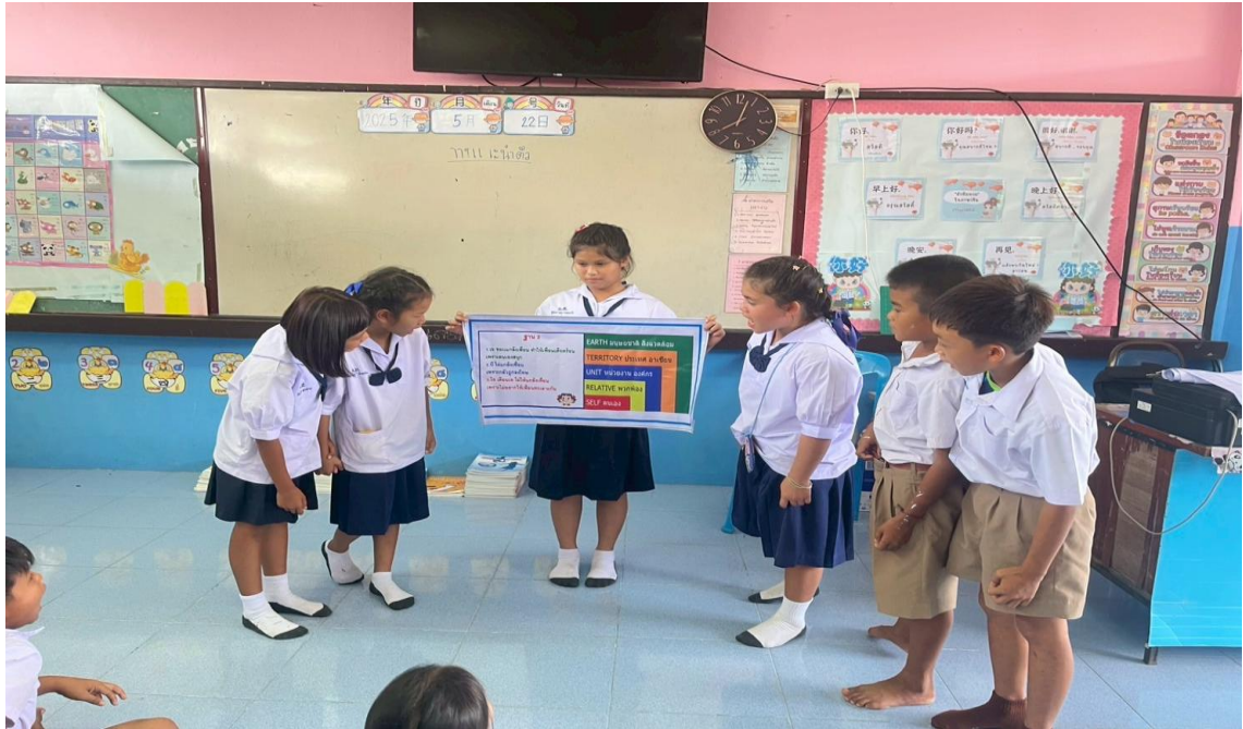
ภาพครูนำกิจกรรมกิจกรรมคิด ถามตอบจากสถานการณ์ที่กำหนดขึ้น (ดี ชั่ว ปกติ) เข้าสู่ห้องเรียน

๕. ครูกับผู้ปกครองนักเรียนร่วมกันทำกิจกรรมกิจกรรมคิด ถามตอบจากสถานการณ์ที่กำหนดขึ้น (ดี ชั่ว ปกติ) ในห้องเรียนเพื่อสร้างความยั่งยืนในการปลูกฝังคุณธรรมจริยธรรม