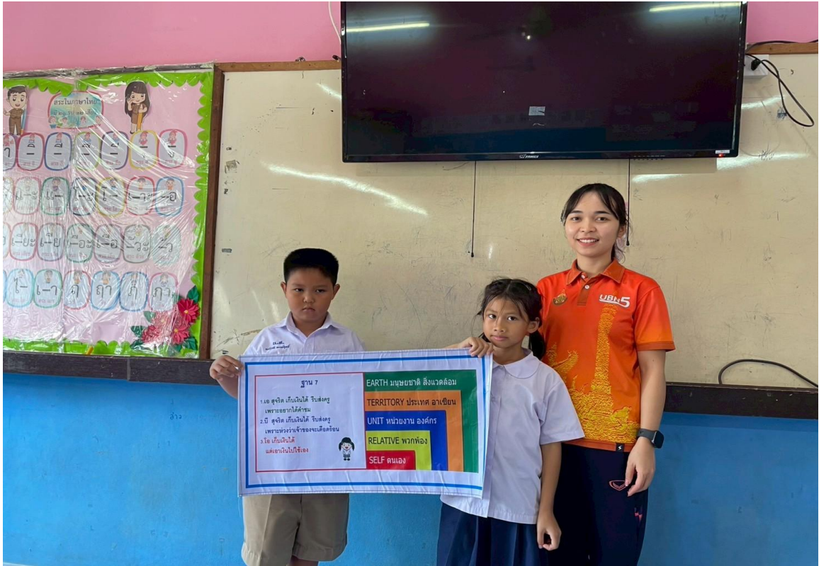
ภาพครูนำกิจกรรมกิจกรรมคิด ถามตอบจากสถานการณ์ที่กำหนดขึ้น (ดี ชั่ว ปกติ) เข้าสู่ห้องเรียน