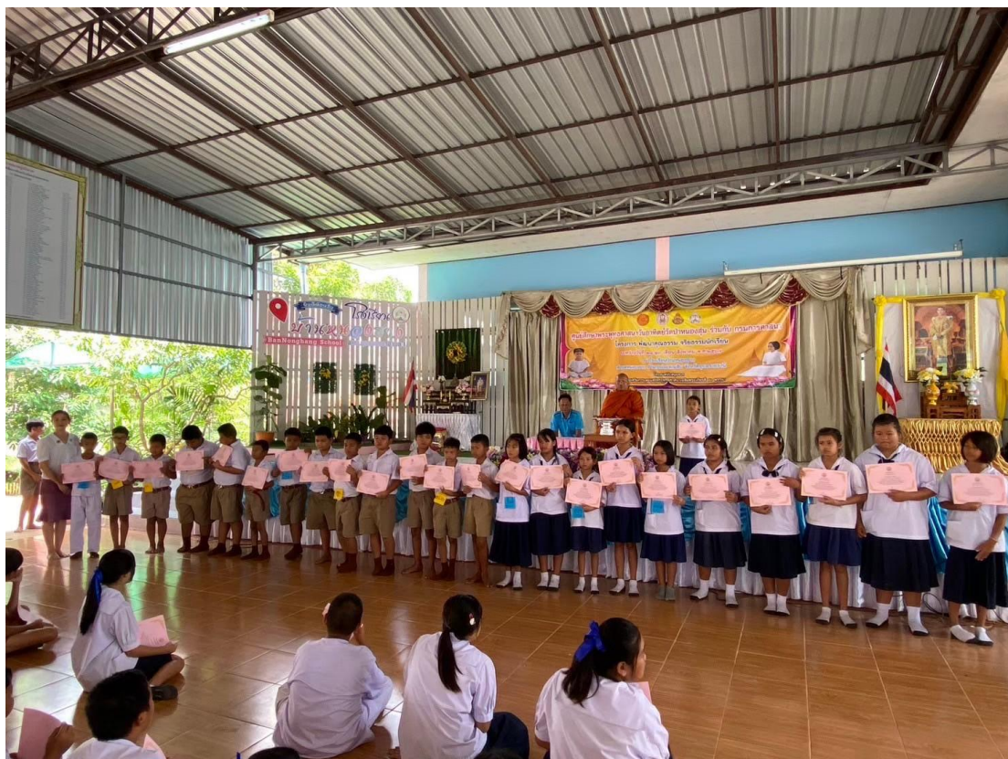
ภาพนักเรียนทำดี รับเกียรติบัตรเก็บเงินได้ส่งคืน