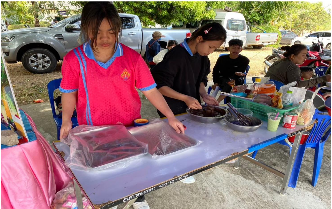
๗. รักความเป็นไทย:ภูมิใจและอนุรักษ์ความเป็นไทย ระดับดีมาก