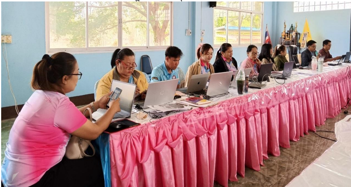
ภาพประชุมคณะทำงานการสร้างทีมงานในการวางแผน การบริหารจัดการ

๓) Team work : การสร้างทีมงานในการวางแผน การบริหารจัดการ การดำเนินงาน ให้ประสบความสำเร็จ เช่น จัดกิจกรรมส่งเสริมคุณธรรมจริยธรรมให้กับนักเรียนโดยเข้าค่ายมัธยมรุ่นใหม่ มีน้ำใจไม่กลั่นแกล้งเพื่อน ค่ายพัฒนาทักษะชีวิต การปฏิบัติกิจกรรมคุณธรรม (ดี ชั่ว ปกติ)