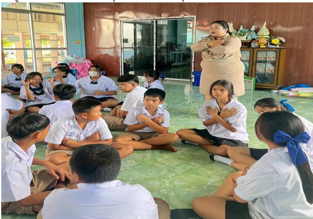
ภาพครูอบรมนักเรียนคาบแนะแนวทุกวันจันทร์ เกี่ยวกับคุณธรรม จริยธรรม มีจิตอาสาในการทำงาน