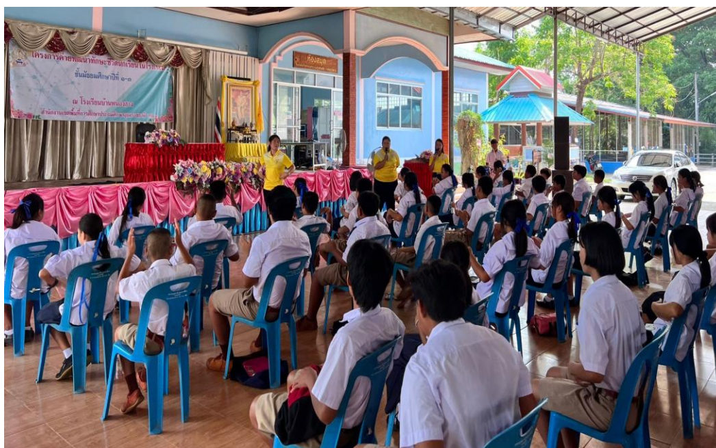
ภาพจัดกิจกรรมค่ายพัฒนาทักษะชีวิต ในวันที่ ๒๖ พฤษภาคม ๒๕๖๘