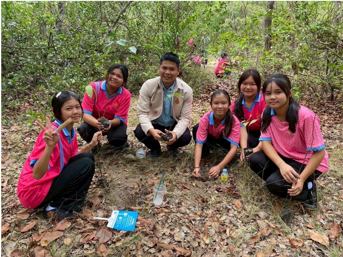
๘. มีจิตสาธารณะ:มีความเอื้อเฟื้อเผื่อแผ่ ช่วยเหลือผู้อื่นและสังคม ระดับดีมาก