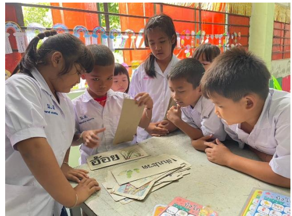
ภาพกิจกรรมการอ่านบัตรคำ