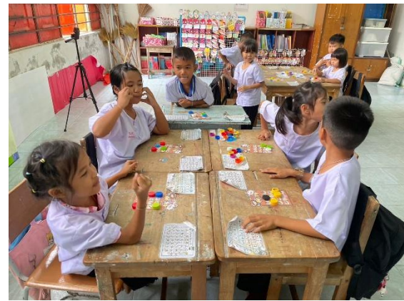
ภาพกิจกรรม เกมบิงโกและเกมเศรษฐีคำควบกล้ำ