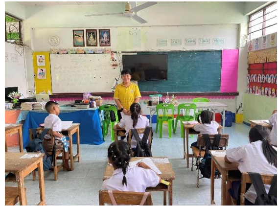
ภาพกิจกรรมการจัดการเรียนการสอน