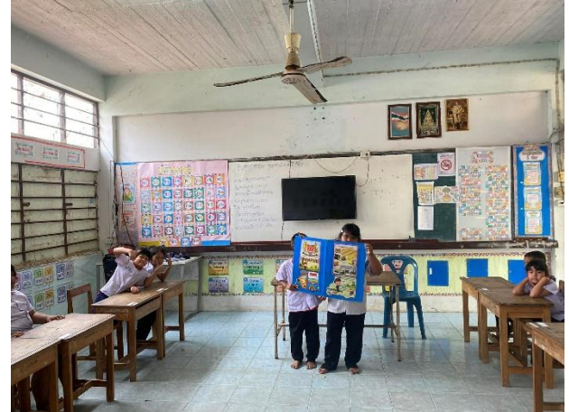
ภาพกิจกรรมการจัดการเรียนการสอนโดยกิจกรรมโครงงานเป็นฐาน