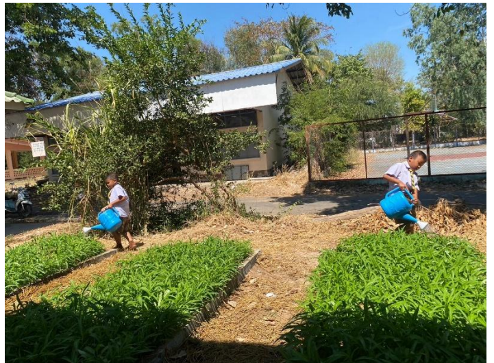
ภาพกิจกรรมการปลูกฝังให้นักเรียนมีความรับผิดชอบในหน้าที่ของตนเอง และรู้จักการดำเนินชีวิตอย่างพอเพียงตามแนวทางเศรษฐกิจพอเพียง