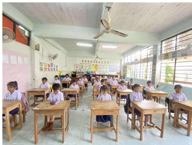
ภาพกิจกรรมการจัดการเรียนการสอนผ่านกระบวนการบูรณาการแบบสหวิทยาการ