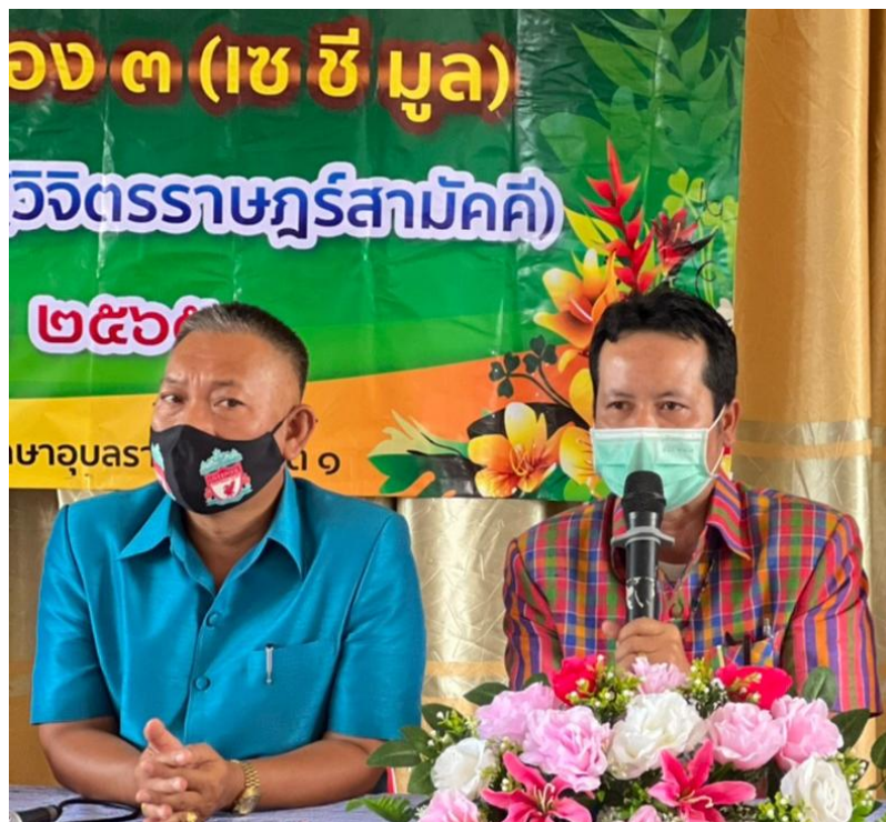
การนำเสนอ นวัตกรรม ในการประชุมเครือข่ายสถานศึกษาเมือง 3 (เซ ซี มูล)