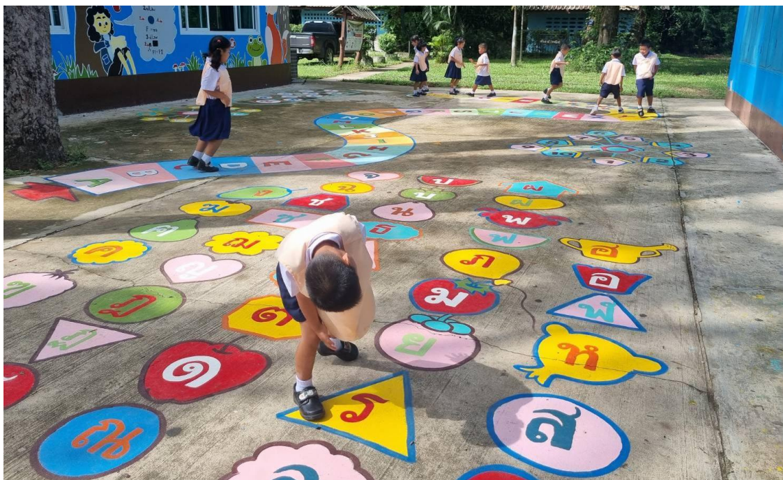
ภาพ การส่งเสริมพัฒนาการเด็กปฐมวัยด้านร่างกาย