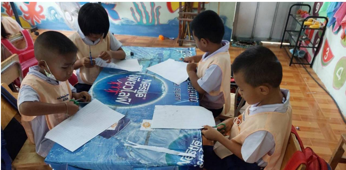
ภาพ การส่งเสริมพัฒนาการเด็กปฐมวัยด้านสังคม