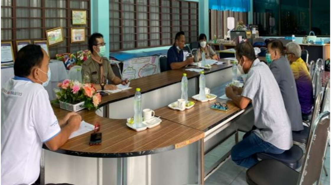
ประชุมคณะกรรมการสถานศึกษาขั้นพื้นฐาน วิเคราะห์บริบทของท้องถิ่น