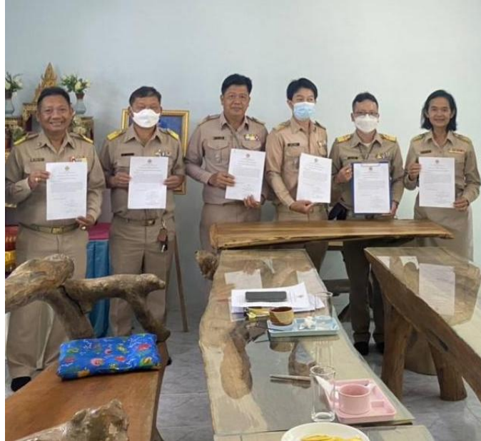
มีการเผยแพร่ นวัตกรรม ไปยังเครือข่ายสถานศึกษาที่ 3 (เซ ซี มูล)

การเผยแพร่ / การได้รับการยอมรับ / รางวัลที่ได้รับ