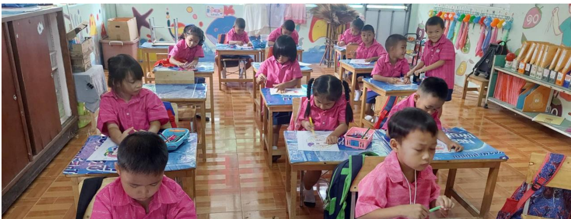
ภาพ การส่งเสริมพัฒนาการเด็กปฐมวัยด้านสติปัญญา