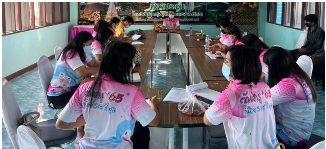
ภาพการประชุมครู วางแผนไปศึกษาดูงานเพื่อเป็นการเปิดใจยอมรับในสิ่งใหม่ๆ ที่เปลี่ยนแปลง