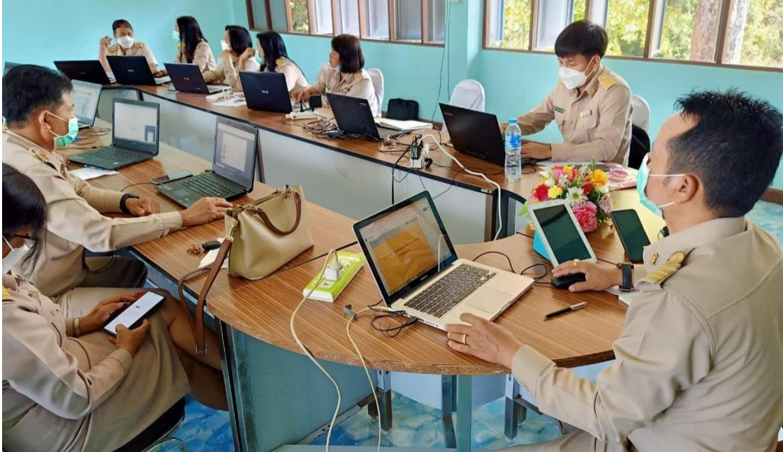
ภาพประชุมครูทั้งโรงเรียน สรุป ปรับปรุง พัฒนาจัดทำแผนการพัฒนา และแผนการนิเทศติดตาม