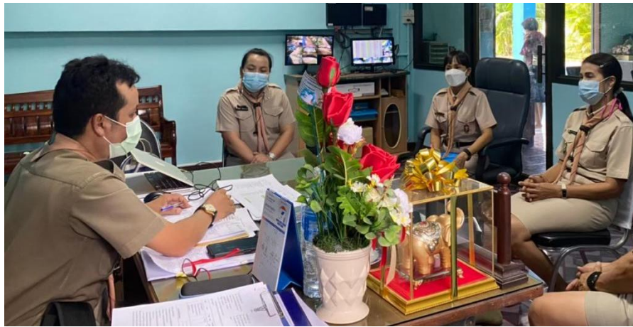
ภาพการประชุมทีมบริหาร ตรวจสอบผลการดำเนินการตามแผนการพัฒนา