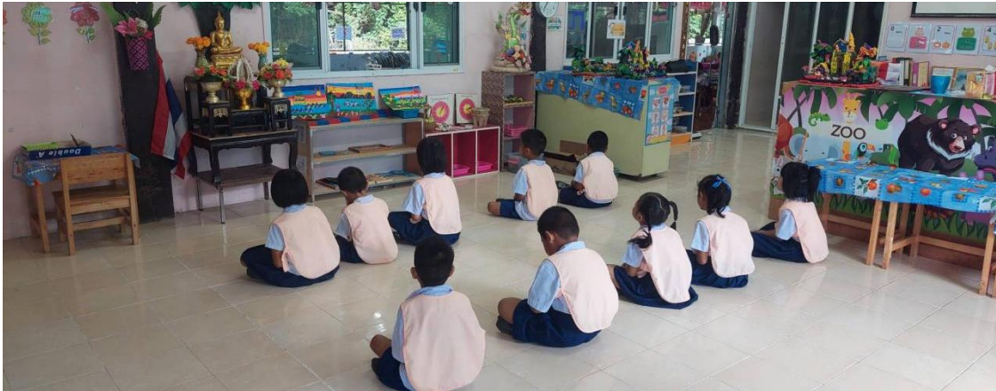
ภาพ การส่งเสริมพัฒนาการเด็กปฐมวัยด้านอารมณ์ จิตใจ