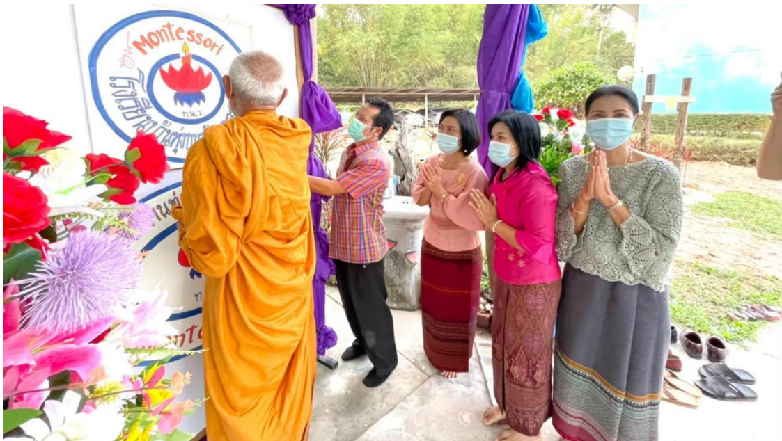
การพัฒนาปรับปรุงอาคารให้ดีขึ้น โดยเปิดอาคารศูนย์ส่งเสริมพัฒนาการจัดการศึกษาปฐมวัย