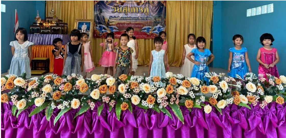
สร้างความสุขสนุกสนานในการจัดกิจกรรม