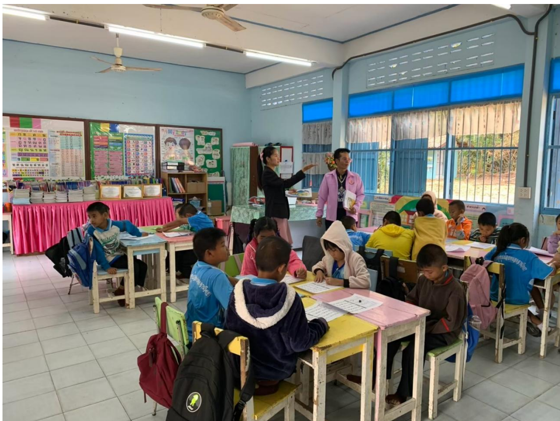
ภาพกรณีศึกษา การนำนวัตกรรมการบริหารจัดการศึกษาไปใช้กับกลุ่มเป้าหมาย