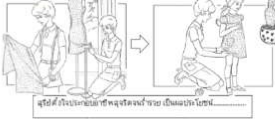
ดูรูปที่ 1 ด้านหน้าของภาพที่ด้านหน้าโดยมีหัวข้อว่า "พายุฤดูร้อน" และเขียนบรรยายภาพที่ด้านหลังโดยมีหัวข้อว่า "การป้องกันพายุฤดูร้อน"

ดูภาพและเขียนบรรยายภาพที่ด้านหน้าโดยมีหัวข้อว่า "พายุฤดูร้อน" และเขียนบรรยายภาพที่ด้านหลังโดยมีหัวข้อว่า "การป้องกันพายุฤดูร้อน"