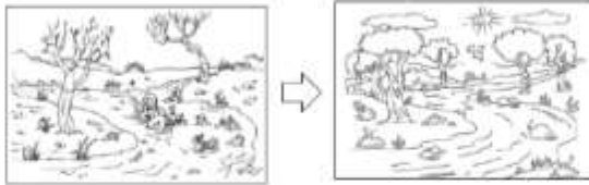
ดูรูปที่ 2 ด้านหน้าของภาพที่ด้านหน้าโดยมีหัวข้อว่า "พายุฤดูร้อน" และเขียนบรรยายภาพที่ด้านหลังโดยมีหัวข้อว่า "การป้องกันพายุฤดูร้อน"

ป.4 ใบงานฝึกการอ่านและทำความเข้าใจเกี่ยวกับเรื่อง "การป้องกันพายุฤดูร้อน" พายุฤดูร้อนคืออะไร? การป้องกันพายุฤดูร้อนอย่างไร? พายุฤดูร้อนมีอันตรายอย่างไร? พายุฤดูร้อนมีสาเหตุอย่างไร? พายุฤดูร้อนมีผลกระทบอย่างไร?