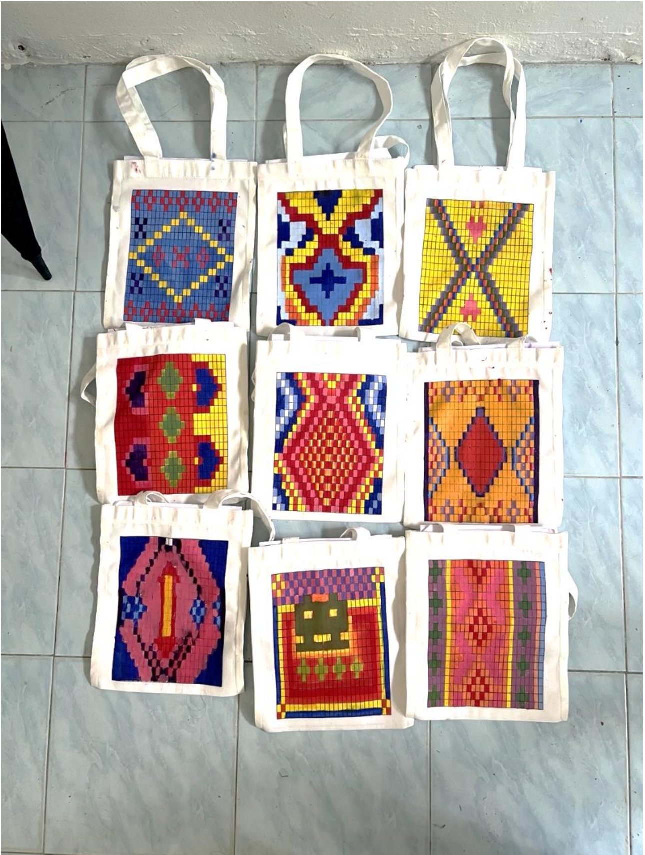
ออกแบบลวดลายตามจินตนาการ โดยยึดหลักองค์ประกอบศิลป์และความงามของผ้าท้องถิ่น แสดงถึงความคิดสร้างสรรค์และการเข้าใจในอัตลักษณ์ท้องถิ่นอย่างลึกซึ้ง