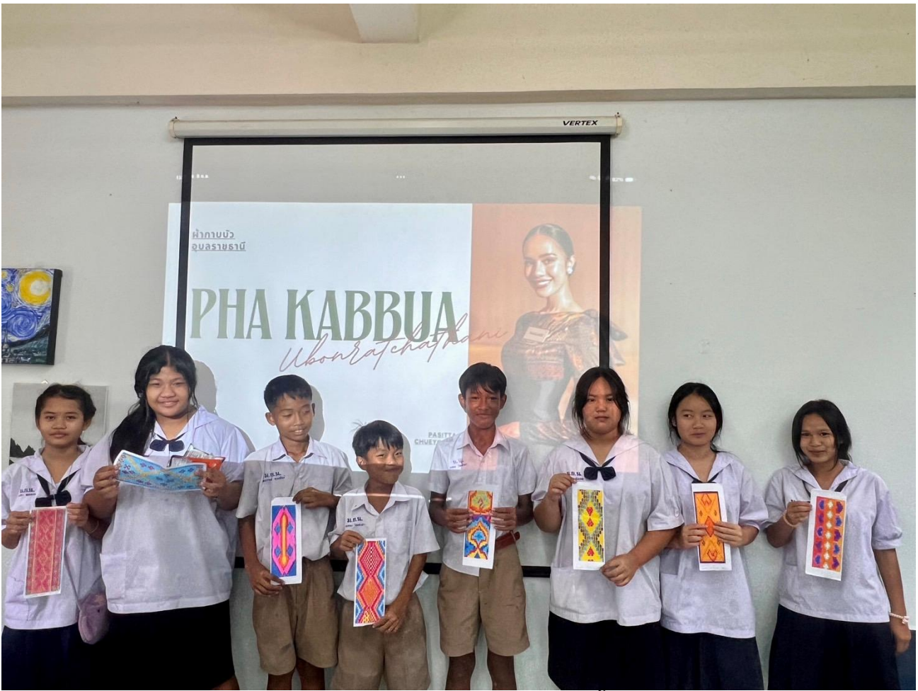
ผลงานออกแบบลวดลายผ้ากาบบัวของนักเรียนระดับชั้นมัธยมศึกษาปีที่ ๑