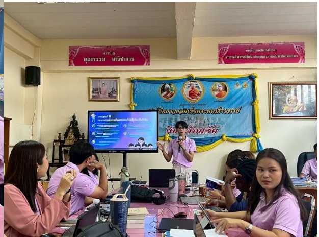
ผู้อำนวยการโรงเรียน พร้อมด้วยครูและบุคลากรทางการศึกษา เข้าร่วมประชุมเชิงปฏิบัติการเพื่อแลกเปลี่ยนเรียนรู้ และขับเคลื่อนนวัตกรรมการจัดการเรียนรู้