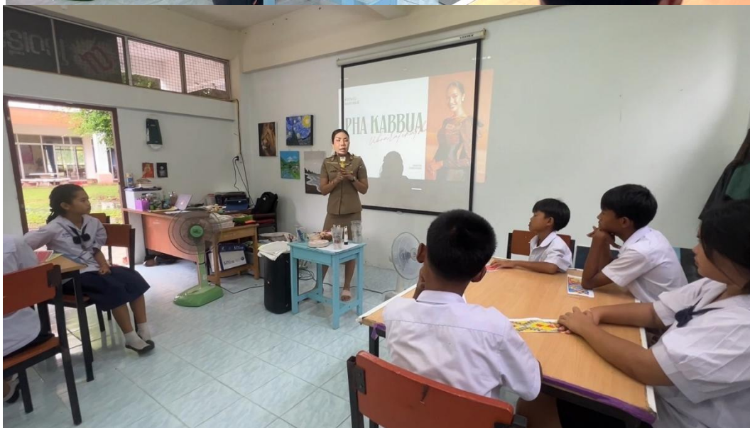
ถ่ายทอดความรู้เกี่ยวกับลดรายจ่ายกบับให้แก่นักเรียนระดับมัธยมศึกษาปีที่ ๑