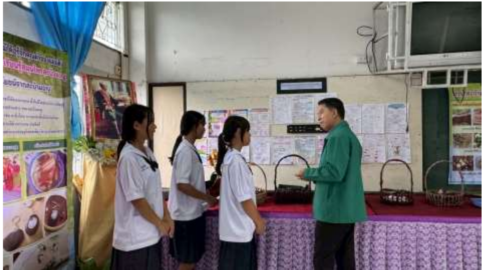
การนำเอาทรัพยากรในท้องถิ่นมาใช้ประกอบกิจกรรมการพัฒนาทักษะการคิดขั้นสูง

การรับฟังข้อเสนอแนะในการพัฒนาทักษะการคิดขั้นสูงจากคณะศึกษานิเทศก์ เพื่อนำไปปรับปรุงและพัฒนาต่อไป