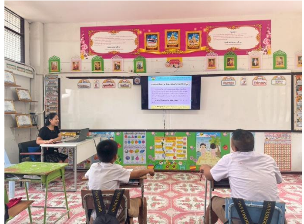
นักเรียนเรียนรู้ทักษะการอ่านจับใจความสำคัญด้วยเทคนิคคำถาม 5 W 1 H