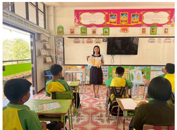
ครูชี้แจงการใช้แบบฝึกทักษะการอ่านจับใจความสำคัญด้วยเทคนิคคำถาม 5 W 1 H