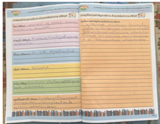
ผลงานนักเรียนการอ่านจับใจความสำคัญด้วยเทคนิคคำถาม 5 W 1 H