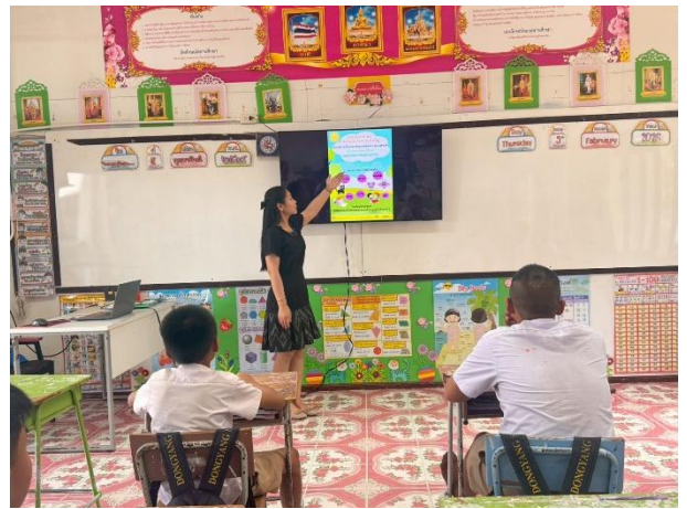
การจัดการเรียนรู้ตามแผนการจัดการเรียนรู้ การอ่านจับใจความสำคัญด้วยเทคนิคคำถาม 5 W 1 H