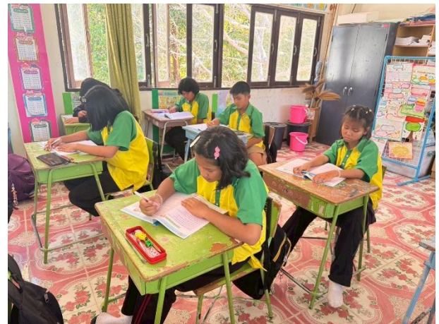
นักเรียนฝึกทำแบบฝึกทักษะการอ่านจับใจความสำคัญด้วยเทคนิคคำถาม 5 W 1 H