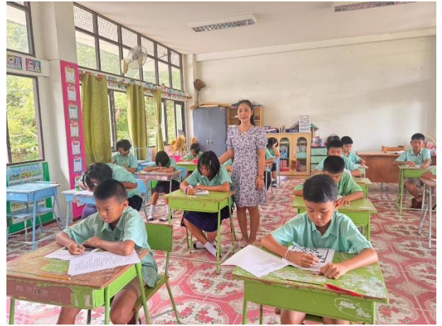
ครูผู้สอนวิเคราะห์ผู้เรียนรายบุคคล