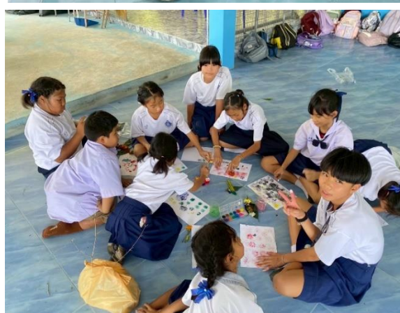
ภาพประกอบการดำเนินโครงการศิลปะสนุก สร้างสุขภาพดี