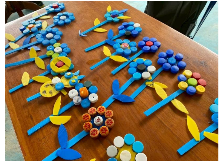
ภาพประกอบการดำเนินโครงการขยะทำเงิน