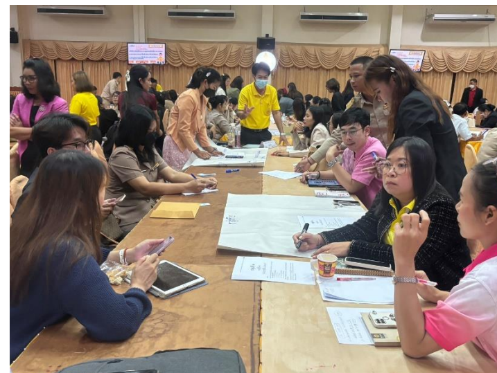
รูปภาพประกอบการดำเนินโครงการพัฒนาทักษะการจัดการเรียนการสอนผ่านกระบวนการจัดการเรียนรู้แบบ (Active Learning)