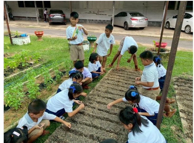
ภาพประกอบการดำเนินโครงการบูรณาการเรียนรู้อะไรก็พอเพียง