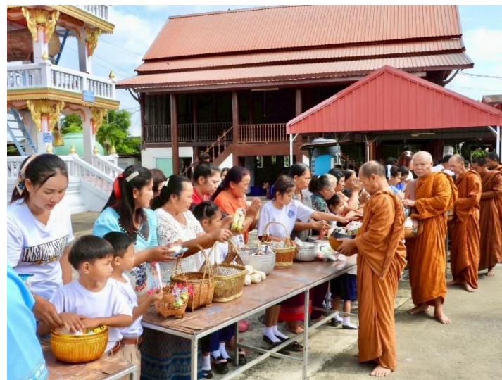
ภาพประกอบการดำเนินโครงการคุณธรรมตามคติธรรมหลวงปู่เสาร์กันตลีโล