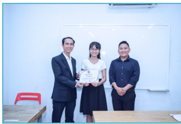
เธอ ได้รับรางวัลความประพฤติ