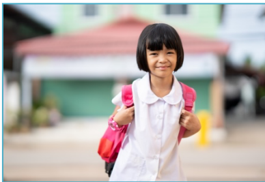
ฉัน เป็นนักเรียน