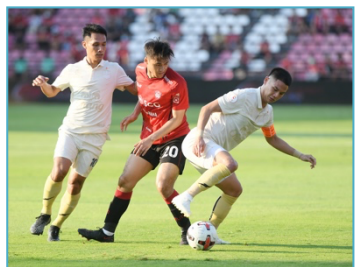
พวกเขา กำลังเตะฟุตบอล