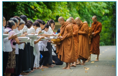
อาตมา กำลังไปบิณฑบาต

กิจกรรมนี้สร้างเสริมทักษะศตวรรษที่ 21 ด้านการสื่อสาร