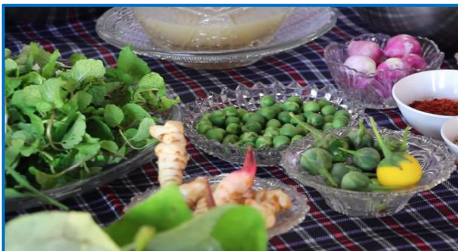
ส่วนผสมในการทำลาบหมาน้อย