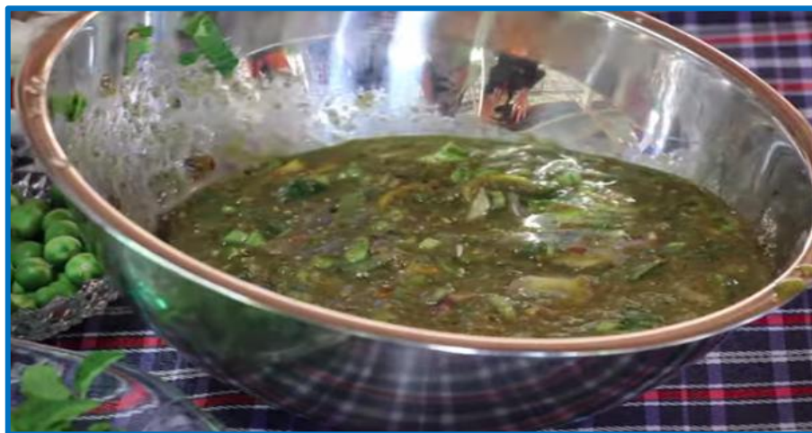
ลาบหมาน้อยหรือวุ้นหมาน้อย

หมาน้อย หรือ เครือหมาน้อย มีชื่อเรียกที่แตกต่างกันในแต่ละท้องถิ่น เช่น กรุงเขมา กรุงเขมา หมอน้อย ก้านปัด ขงเขมา พระพาย เปล้าเลือด สีฟัน มีชื่อวิทยาศาสตร์ว่า Cissampelos pareira L. var. hirsuta (Buch. ex DC.) Forman. ลักษณะของต้นหมาน้อยจะเป็นไม้เถาเลื้อยพัน มักจะเลื้อยปกคลุมค้ำหรือต้นไม้เป็นพุ่มแบบไม่มีมือเกาะ มีรากที่สามารถสะสมอาหารใต้ดินได้ ใบของหมาน้อยจะเป็นใบเดี่ยวรูปหัวใจสีเขียวลักษณะก้านปัด ออกในสลับกันตามเครือเถา ผิวใบมีขนนุ่มปกคลุมไม่ระคายเคือง ขอบใบเรียบ ดอกจะออกเป็นกระจุกสีขาวขนาดเล็ก มีผลสีเขียวอมดำยาวประมาณหนึ่งเซนติเมตร เมื่อสุกจะมีสีน้ำตาลแดงและมีเมล็ดโค้งงอเหมือนพระจันทร์ครึ่งซีก