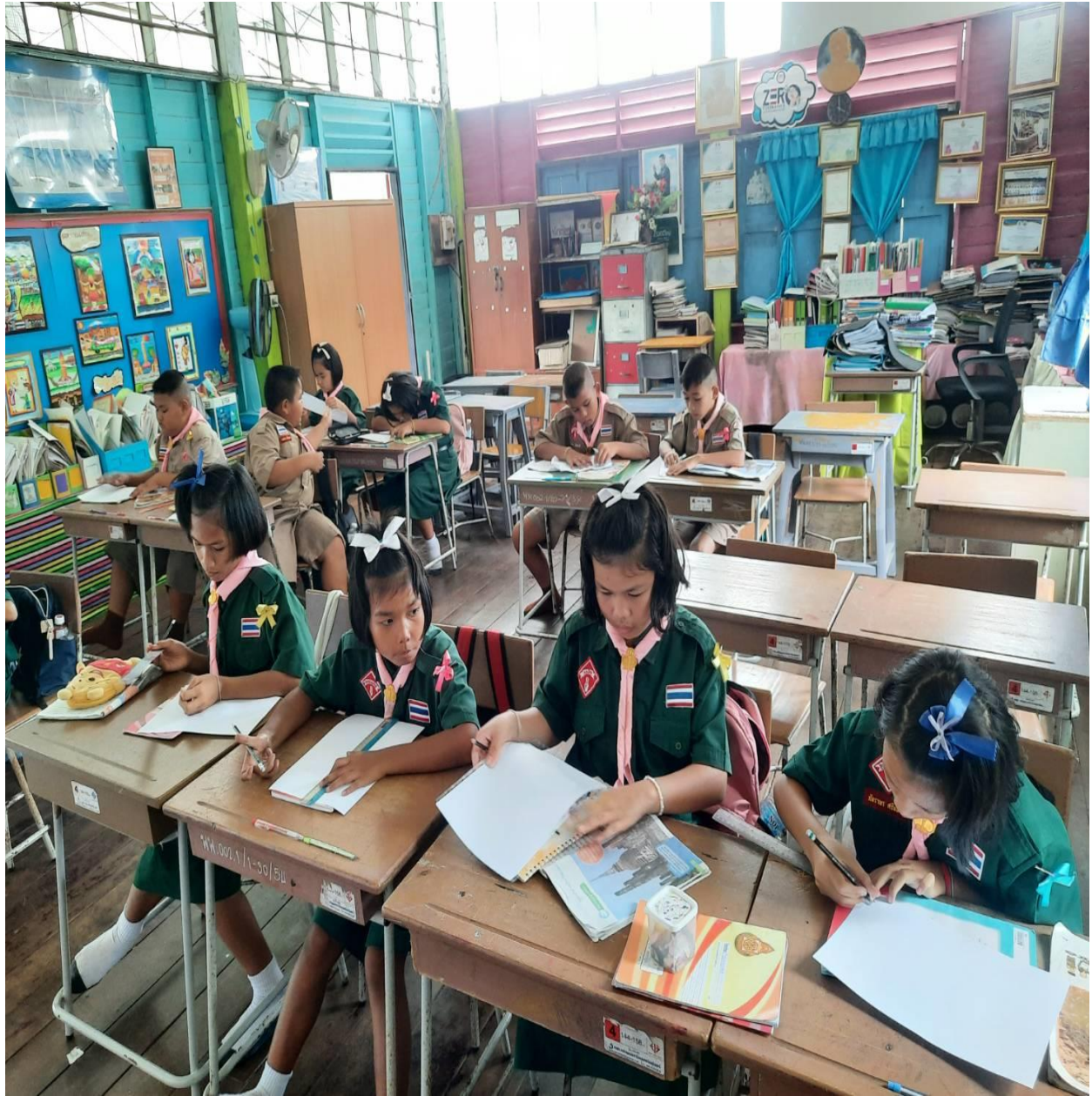
กิจกรรมการเรียนรู้การสอน