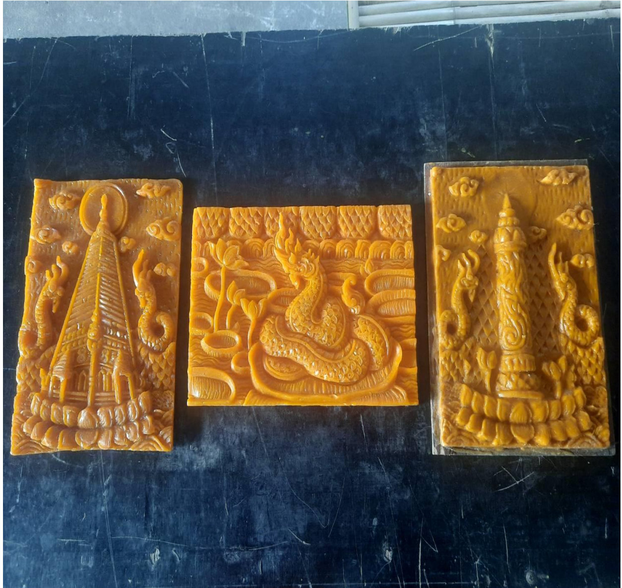
ตัวอย่างสื่อผลงานการแกะสลักเทียนทำให้เกิดเรื่องราว