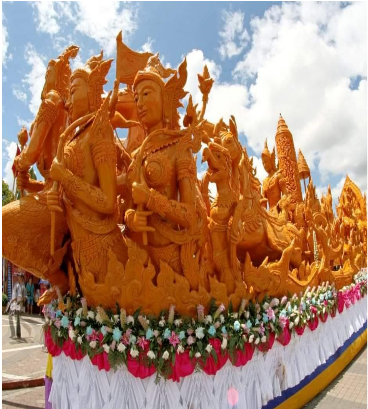
ตัวอย่างผลงานต้นเทียนพรรษาประเภทแกะสลักให้เกิดลวดลาย และเกิดเรื่องราวในองค์ประกอบของต้นเทียน