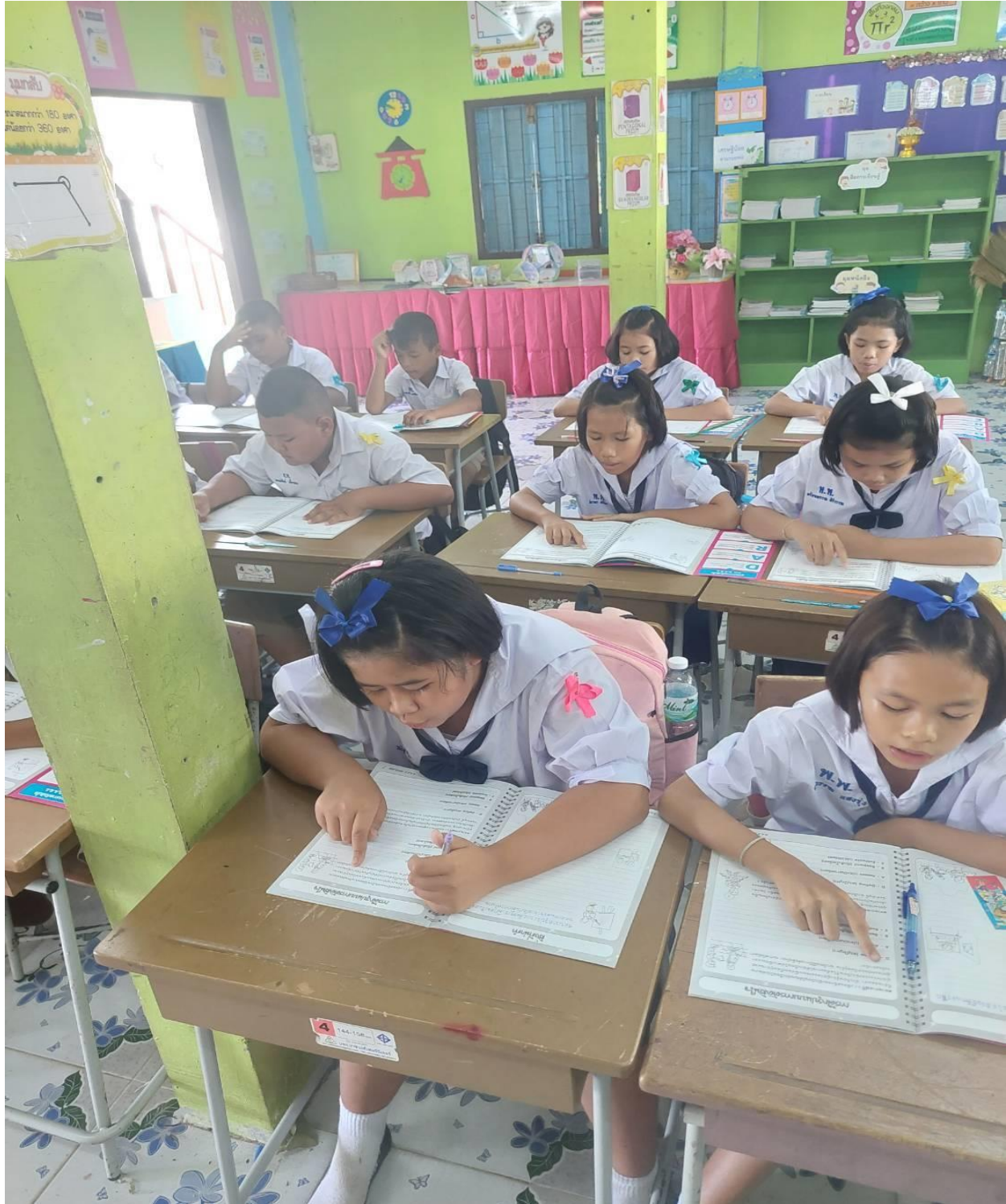
การจัดกิจกรรมการเรียนการสอนภายในห้องเรียนของนักเรียนระดับชั้นประถมศึกษาปีที่ 4