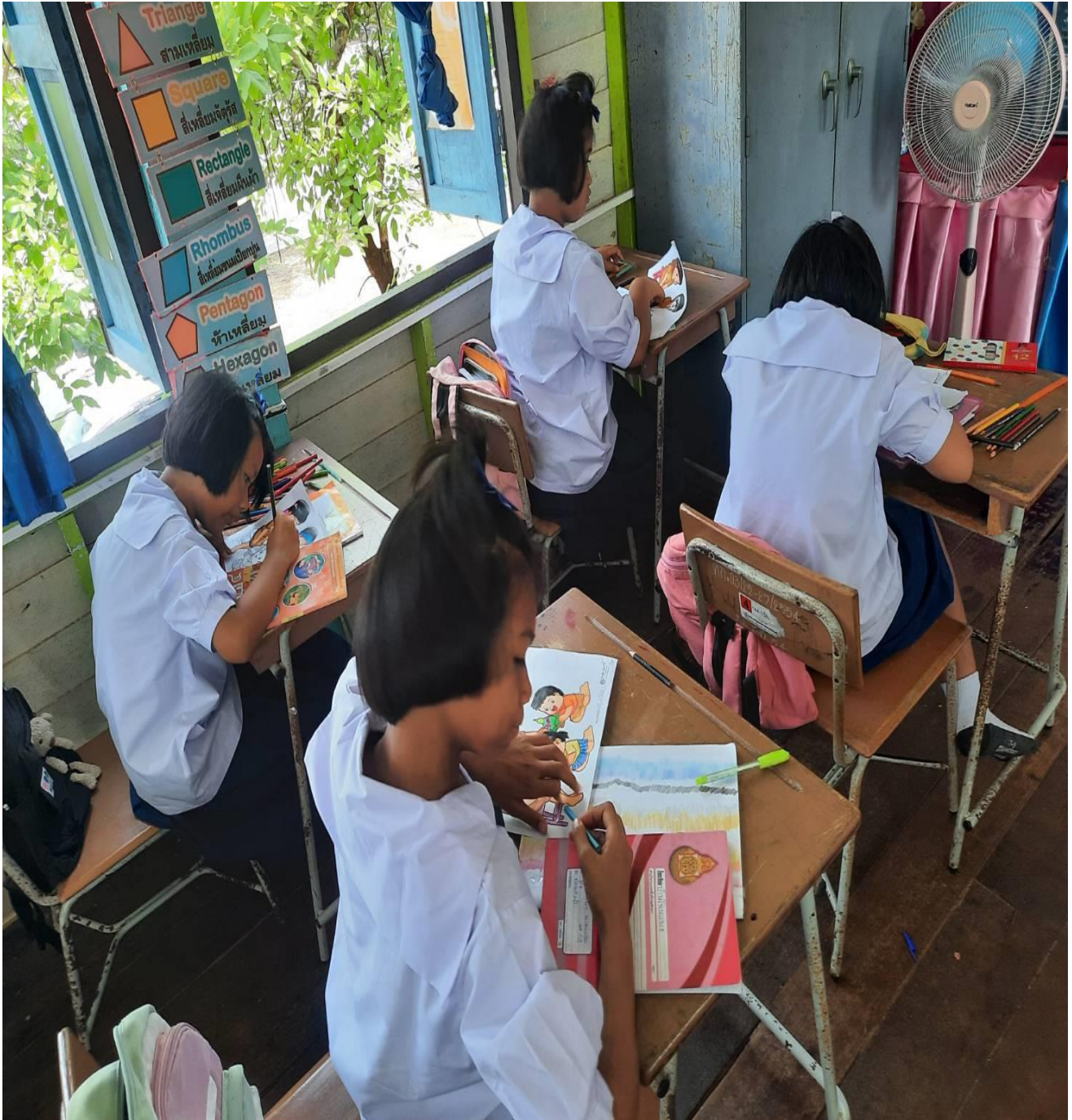
บรรยากาศภายในห้องเรียนในการจัดกิจกรรมการเรียนการสอน