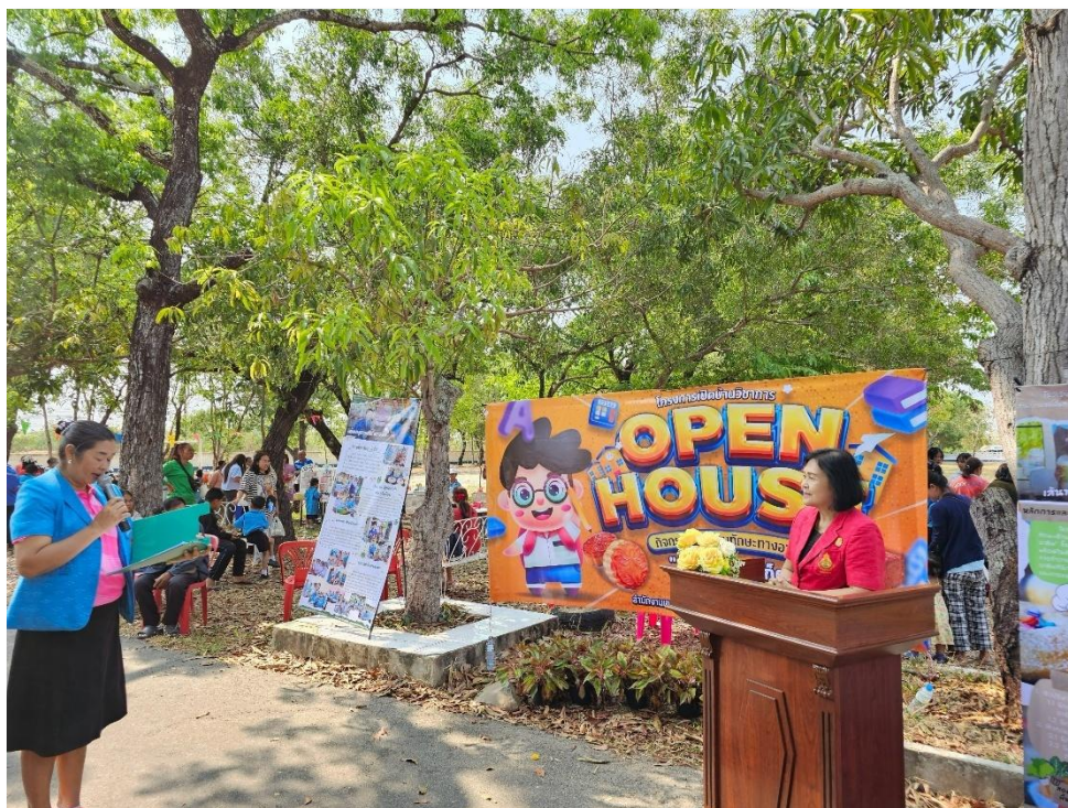
กิจกรรมเปิดบ้านวิชาการ (Open House) ตลาดนัดอาชีพ ของนักเรียนโรงเรียนบ้านน้ำอ้อมฝักระยา ปีการศึกษา ๒๕๖๘๗