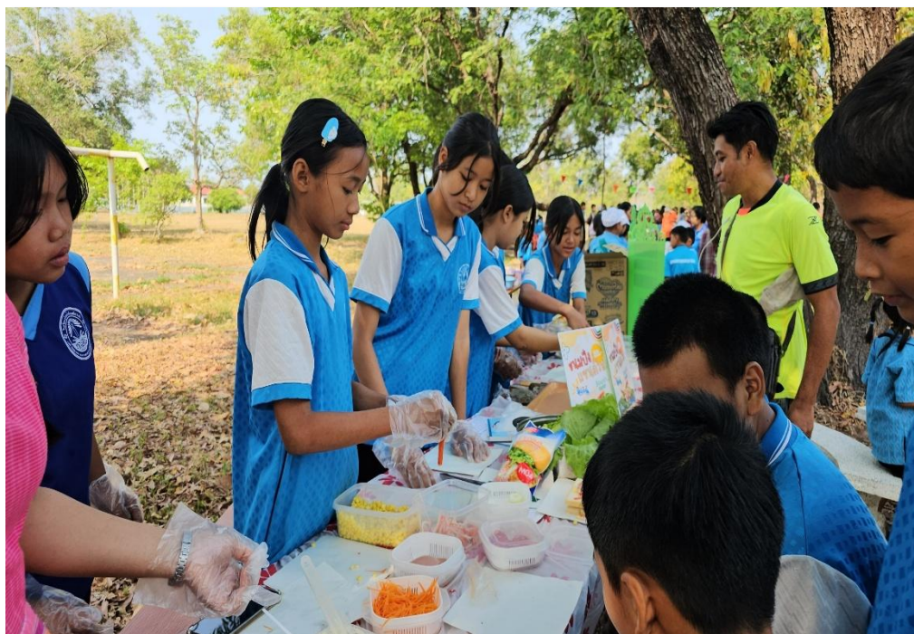
กิจกรรมเปิดบ้านวิชาการ (Open House) ตลาดนัดอาชีพ ของนักเรียนโรงเรียนบ้านน้ำอ้อมฝักระยา ปีการศึกษา ๒๕๖๘๗