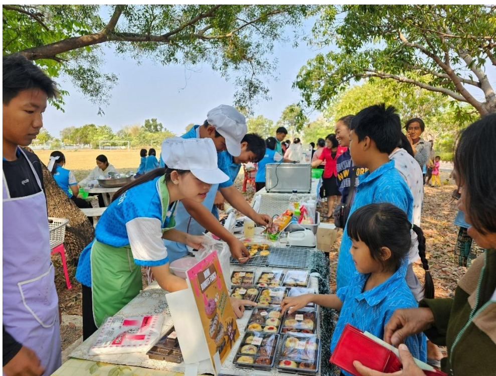
กิจกรรมเปิดบ้านวิชาการ (Open House) ตลาดนัดอาชีพ ของนักเรียนโรงเรียนบ้านน้ำอ้อมฝักระยา ปีการศึกษา ๒๕๖๘๗