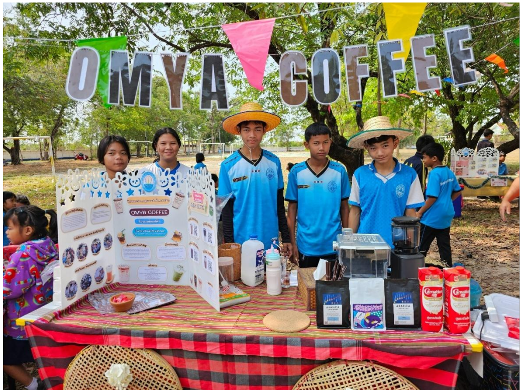
กิจกรรมเปิดบ้านวิชาการ (Open House) ตลาดนัดอาชีพ ของนักเรียนโรงเรียนบ้านน้ำอ้อมฝักระยา ปีการศึกษา ๒๕๖๘๗