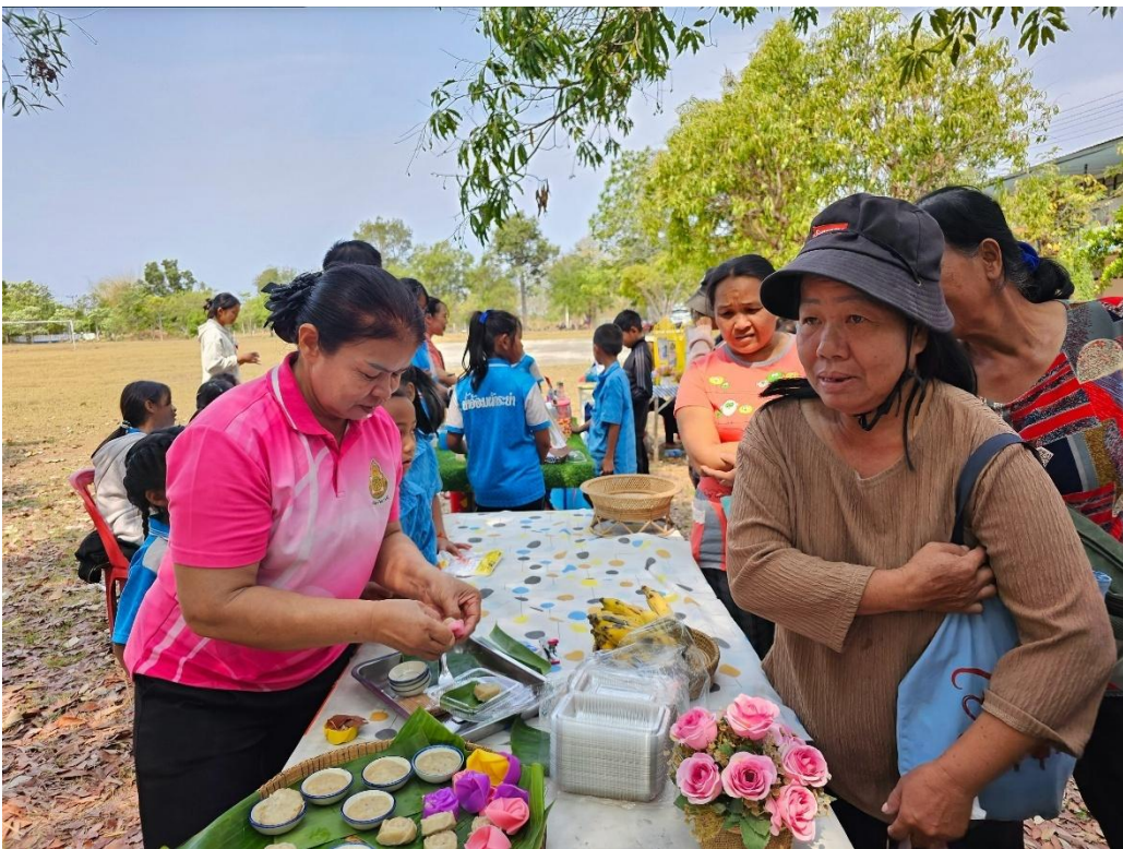
กิจกรรมเปิดบ้านวิชาการ (Open House) ตลาดนัดอาชีพ ของนักเรียนโรงเรียนบ้านน้ำอ้อมผักกระย่า ปีการศึกษา ๒๕๖๘๗