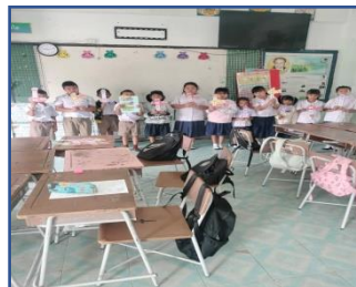
รูปภาพ นักเรียนทำงานกลุ่มแล้วนำเสนอหน้าชั้นเรียน