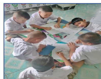
กิจกรรมฝึกอ่านเขียนเรียนรู้เรื่องประโยค