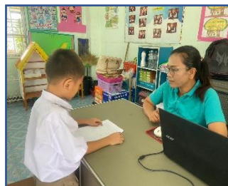
รูปภาพ การคัดกรองนักเรียนอ่านไม่ออกเขียนไม่ได้ชั้นประถมศึกษาปีที่ ๑

๒.๒ ขั้นวินิจฉัยปัญหา ขั้นตอนนี้จะเป็นการค้นหาสาเหตุการอ่านไม่ออกเขียนไม่คล่อง โดยสรุปการ วินิจฉัย ปัญหาด้านการอ่านการเขียนและการมีเจตคติที่ดีในด้านการอ่านและการเขียนได้ ดังนี้