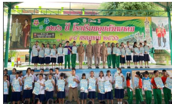
2.1 สมุดบันทึกโรงเรียนรักษาศีล 5 ( 7 กิจวัตรความดี )