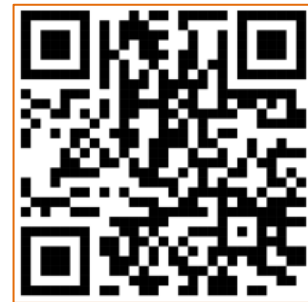
คู่มือแผนงานรร. วิถีพุทธ