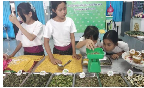
1.5 ลูกประคบสมุนไพร