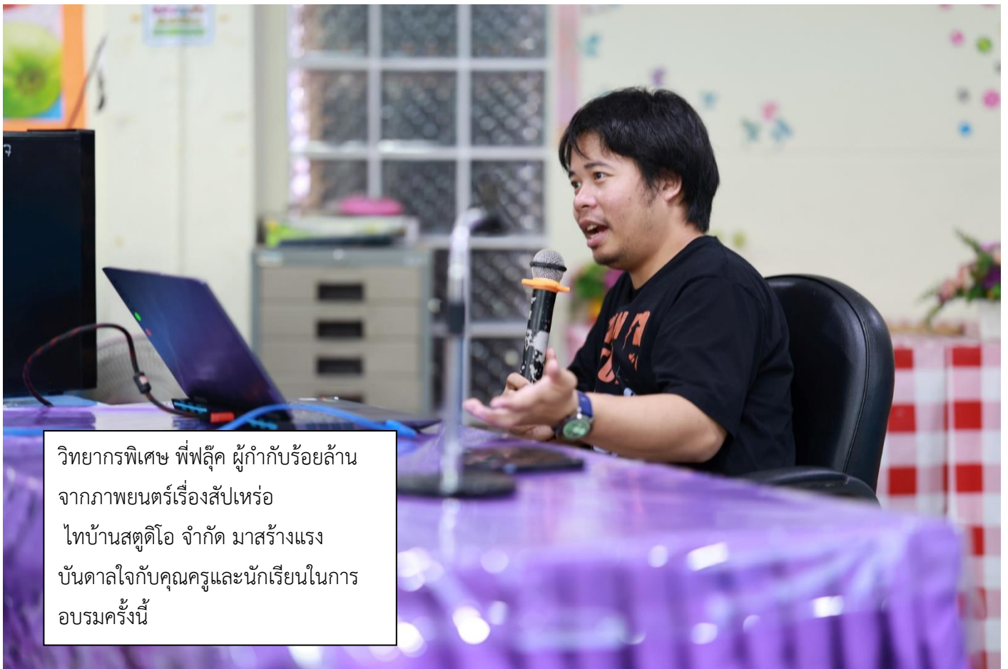
วิทยากรพิเศษ พี่ฟลุ๊ค ผู้กำกับร้อยล้าน จากภาพยนตร์เรื่องสับแหร่ ไต่บ้านสตูดิโอ จำกัด มาสร้างแรงบันดาลใจกับคุณครูและนักเรียนในการ อบรมครั้งนี้