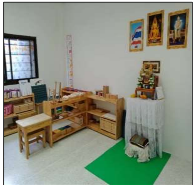
สื่อหมวดคณิตศาสตร์