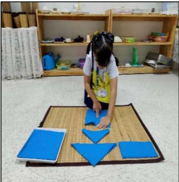
กิจกรรมพับผ้า