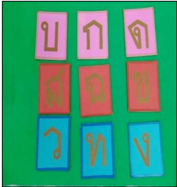
สื่ออักษรกระดาดทราย