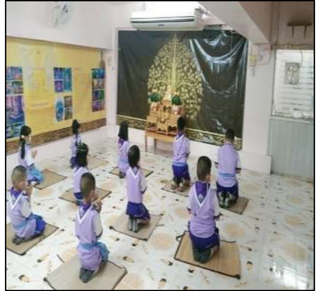
กิจกรรมสมาธิ