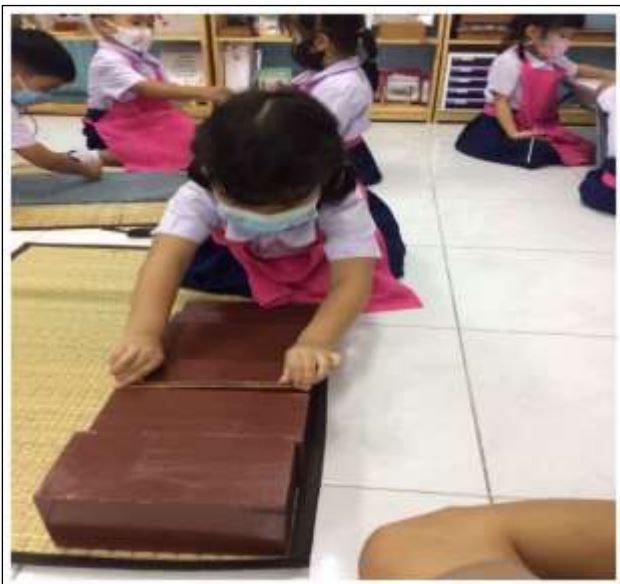
กิจกรรมบันไดน้ำตาล