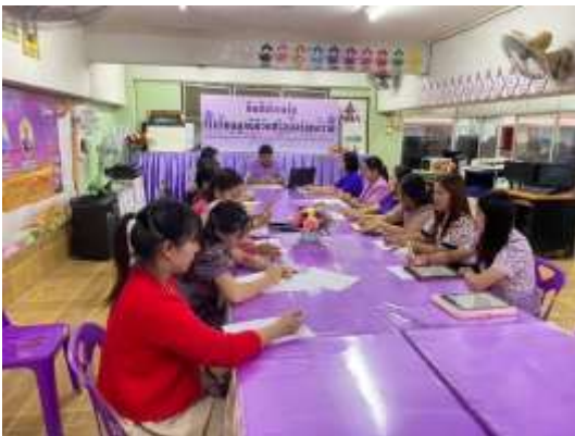
ภาพที่ 1 : ชั้นวางแผน ติดตาม สรุปผล