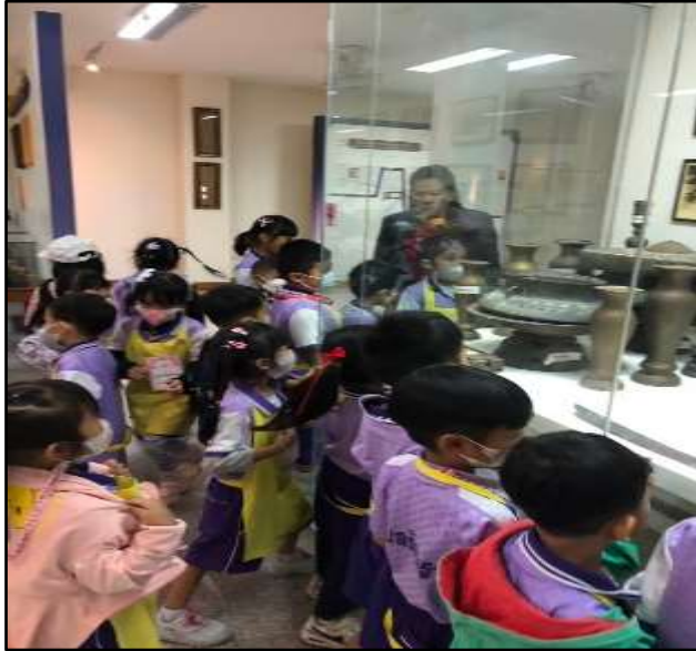
เด็กเรียนรู้อุปกรณ์ในสมัยโบราณ