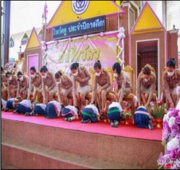
กิจกรรมวันไหว้ครู