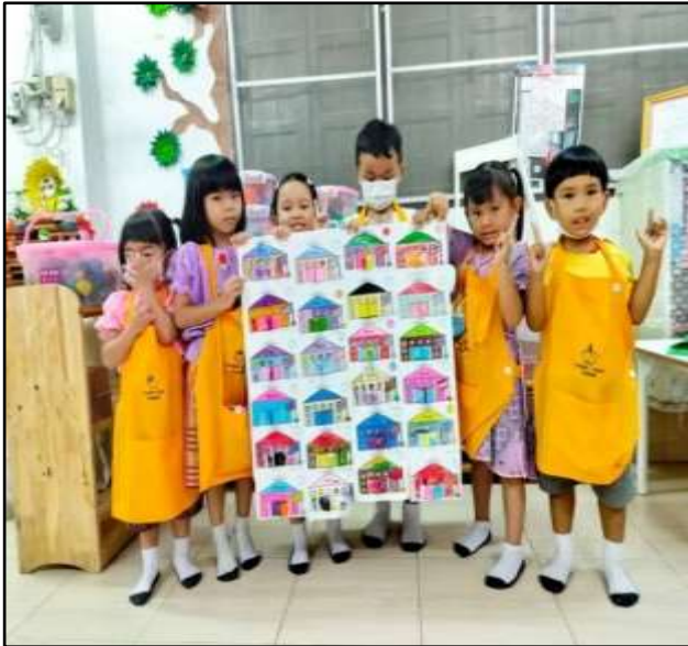
กิจกรรมสร้างสรรค์หน่วยบ้าน