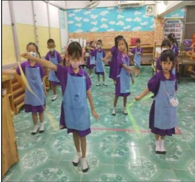
กิจกรรมเคลื่อนไหวและจังหวะ ประกอบอุปกรณ์