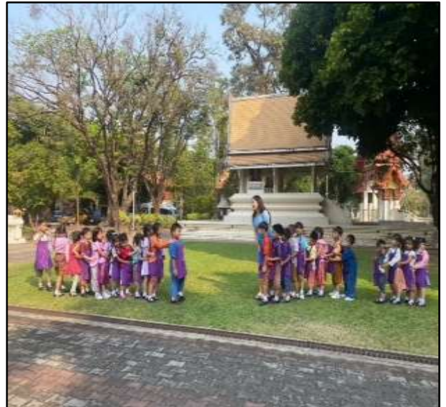
กิจกรรมเล่นกลางแจ้ง (แมงอ้อย)