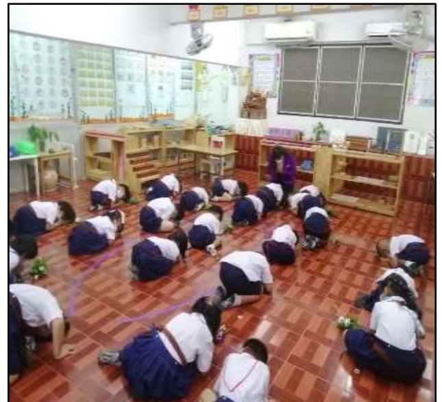
กิจกรรมไหว้ครู