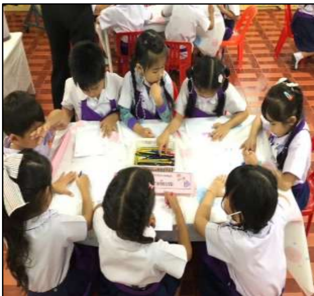
เด็กวาดภาพแสดงผลการทดลอง