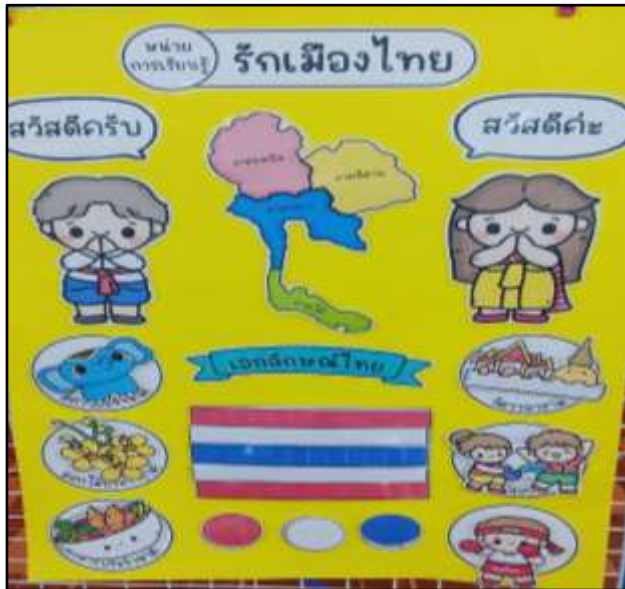
ป้ายนิเทศตามหน่วย