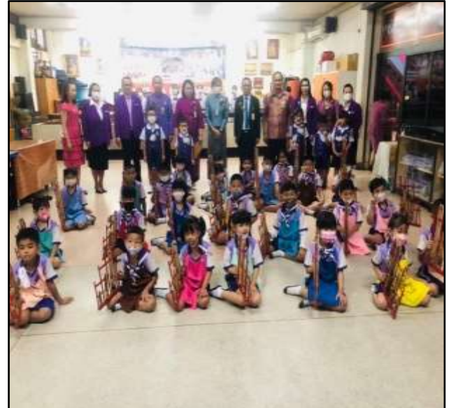
การแสดงดนตรีไทยกิจกรรมอังกฤษ