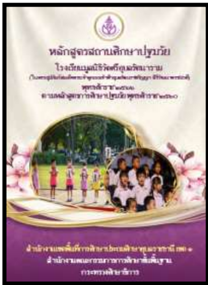
หลักสูตรสถานศึกษาปฐมวัย พุทธศักราช ๒๕๖๖