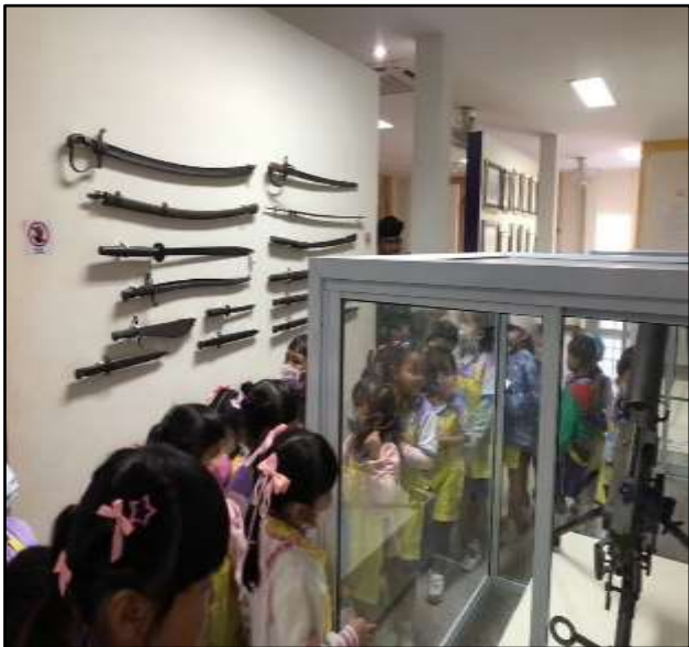
เด็กเรียนรู้เรื่องของใช้ในสมัยโบราณ