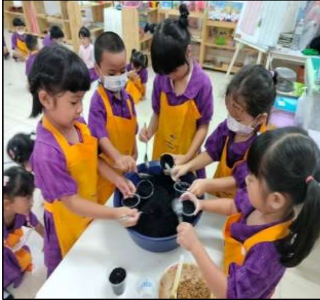
กิจกรรมการปลูกต้นไม้