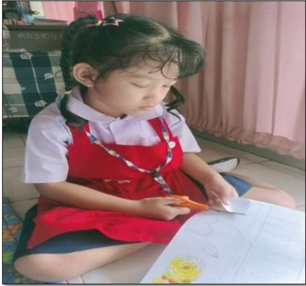
กิจกรรมศิลปะสร้างสรรค์