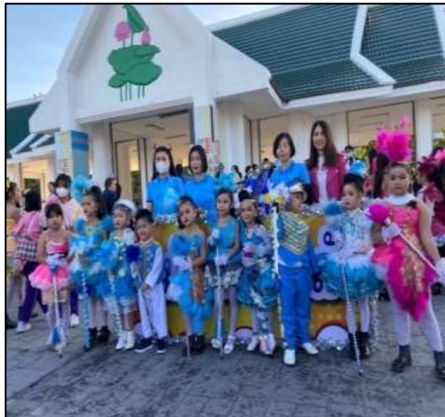
กิจกรรมกีฬาโรงเรียน