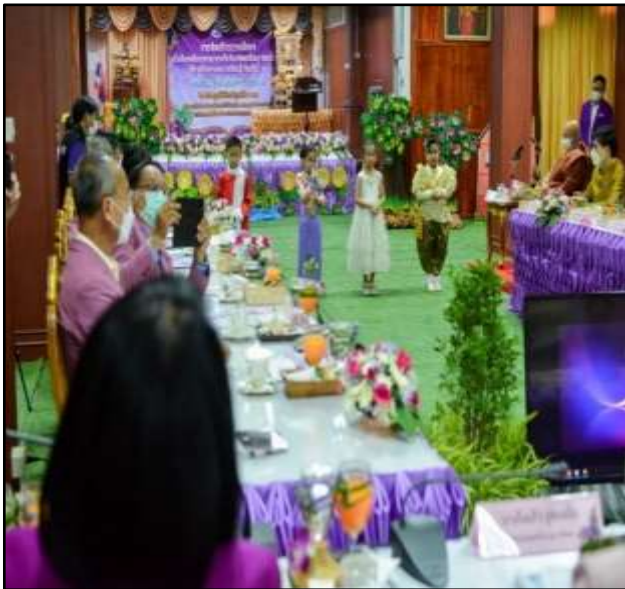
กิจกรรมกล่าวต้อนรับคณะกรรมการ