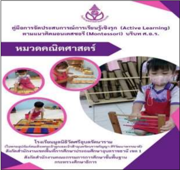
คู่มือหมวดคณิตศาสตร์