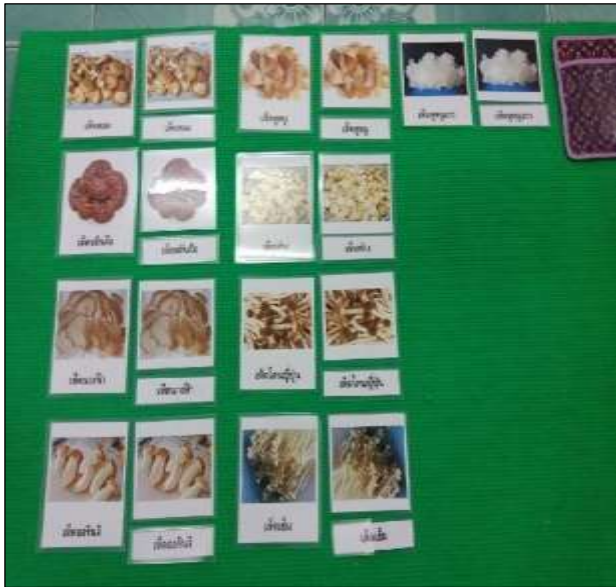
สื่อบัตรภาพสามส่วน