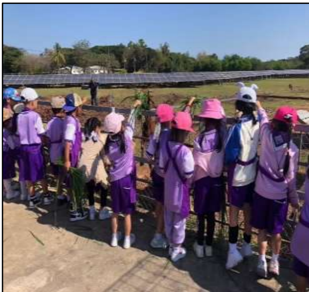
กิจกรรมทัศนศึกษาที่กองบิน ๒๑