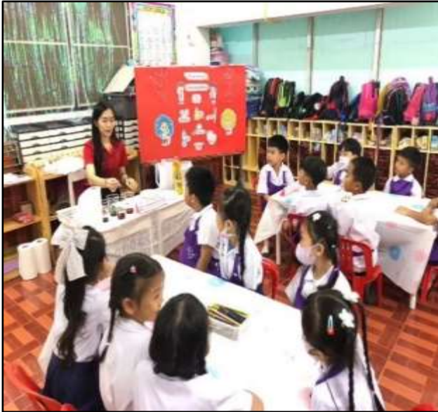
เด็กเรียนรู้เกี่ยวกับกิจกรรมทดลอง สีต้นระบ่ำ