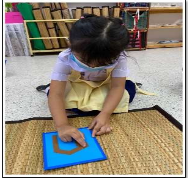
กิจกรรมอักษรกระดาดทราย