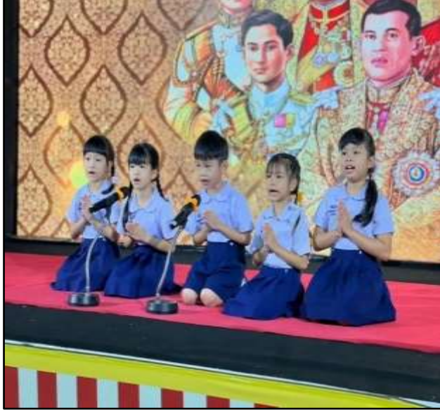
กิจกรรมสวดสรภัญญะ