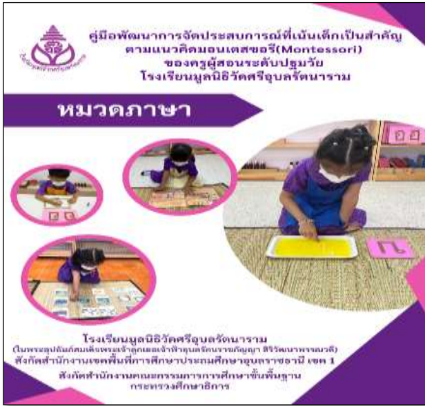
คู่มือหมวดภาษา