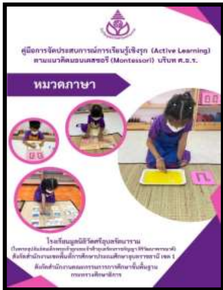
คู่มือหมวดภาษา