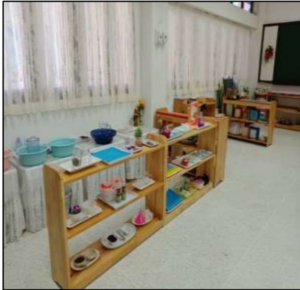
สื่อหมวดชีวิตประจำวัน

๑) สื่อมอนเตสซอรี ๔ หมวด ประกอบด้วย หมวดชีวิตประจำวัน หมวดประสาทรับรู้ หมวดภาษา และหมวดคณิตศาสตร์ และ ๑ กลุ่มงานวัฒนธรรม