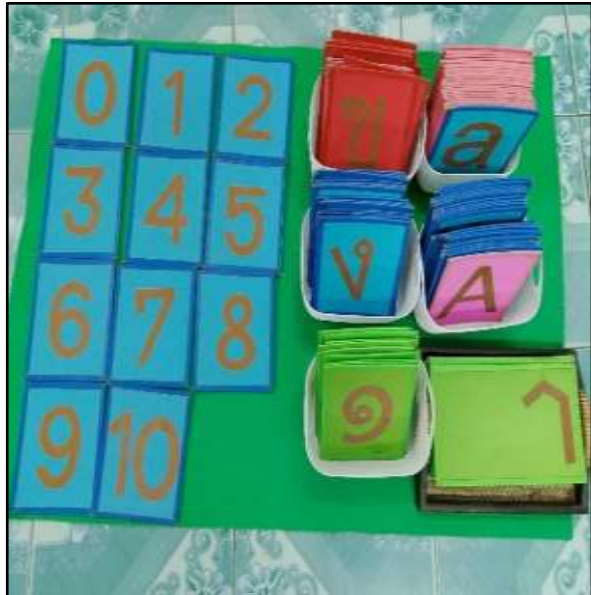
ตัวเลขกระดาดทราย