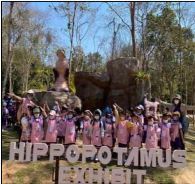
กิจกรรมศึกษาแหล่งเรียนรู้ สวนสัตว์อุบลราชธานี