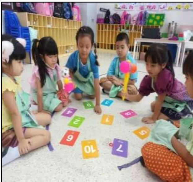
กิจกรรมทักษะทางคณิตศาสตร์