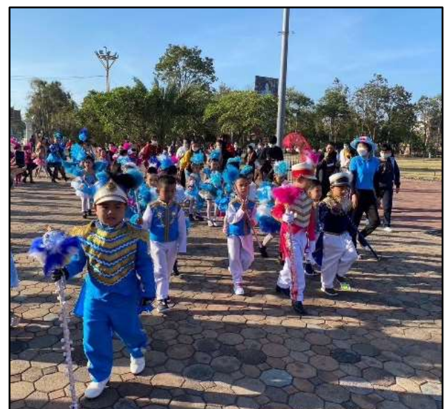
กิจกรรมกีฬาภายในของโรงเรียน