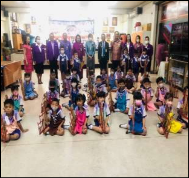
กิจกรรมการฝึกซ้อมอังกะลุง