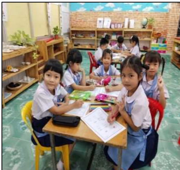
เด็กร่วมกิจกรรมศิลปะ