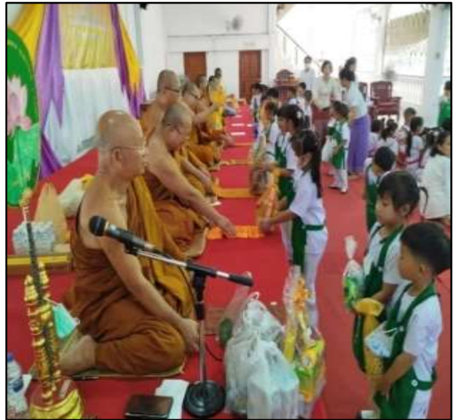
กิจกรรมถวายเทียนพรรษา ณ วัดศรีอุบลรัตนาราม