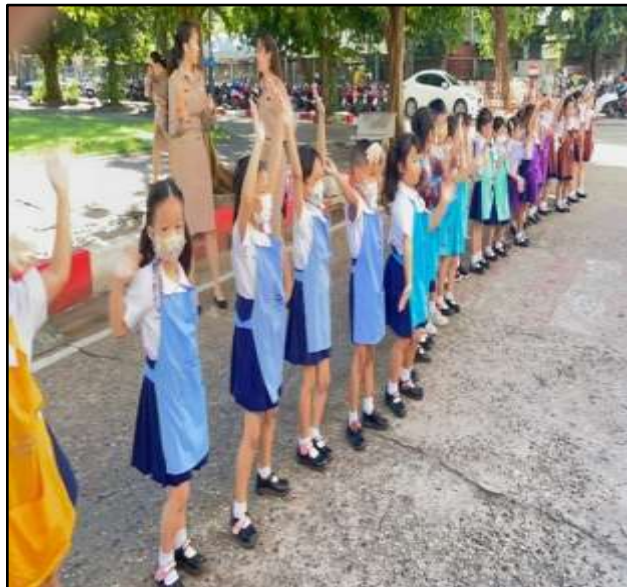
กิจกรรมกายบริหาร