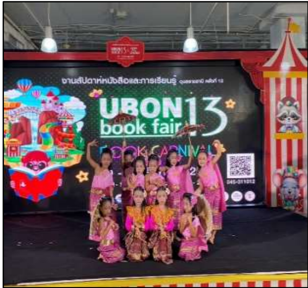
เด็กประกวดกิจกรรมเรียงเล่นเต้นแดนซเซอร์