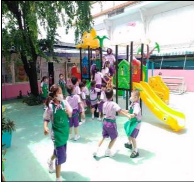
กิจกรรมกลางแจ้งเครื่องเล่นสนาม