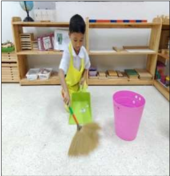
กิจกรรมกวาดขยะ