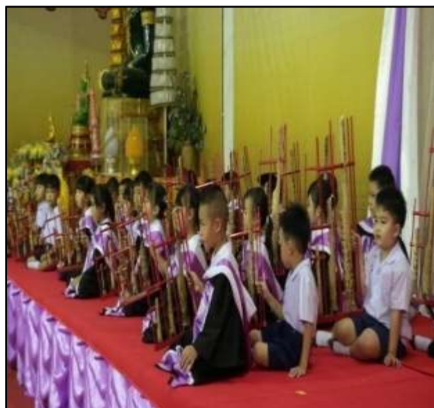
กิจกรรมการแสดงอังกะลุง