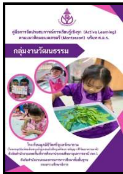
คู่มือกลุ่มงานวัฒนธรรม