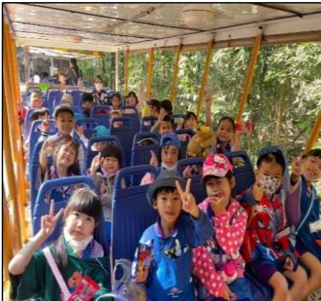
กิจกรรมทัศนศึกษาแหล่งเรียนรู้