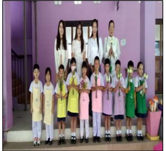
กิจกรรมวันวิสาขบูชา