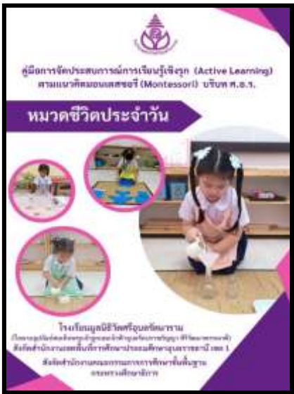
คู่มือหมวดชีวิตประจำวัน