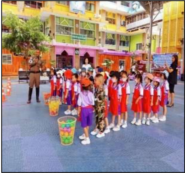
กิจกรรมเข้าค่ายวินัยจราจร