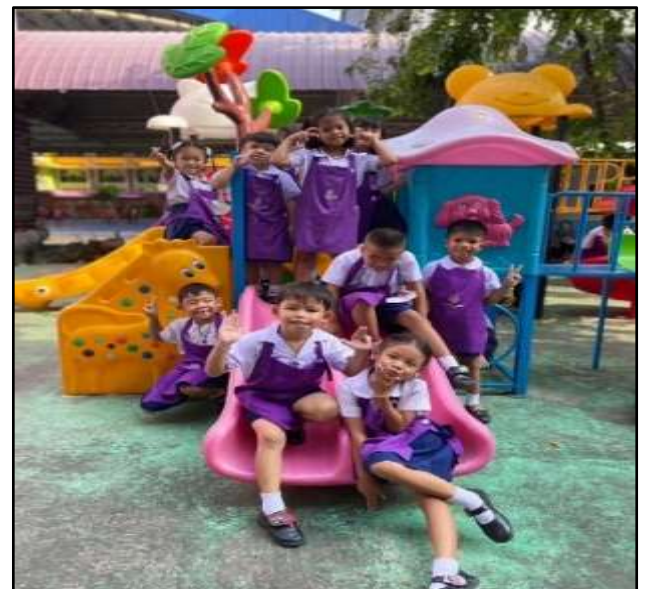
กิจกรรมกลางแจ้งเครื่องเล่นสนาม