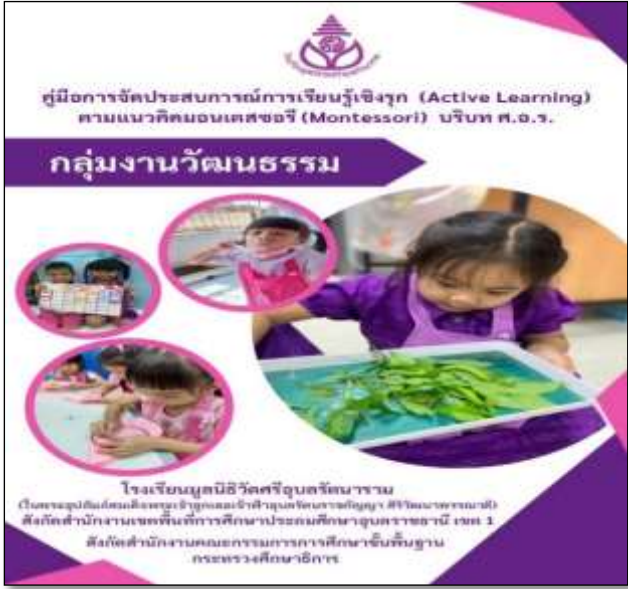
คู่มือกลุ่มงานวัฒนธรรม