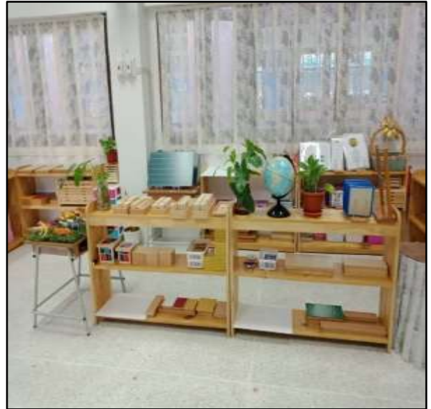
สื่อหมวดประสาทรับรู้