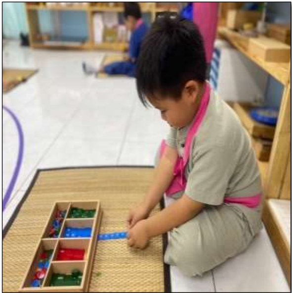
กิจกรรมแสมป์เกม