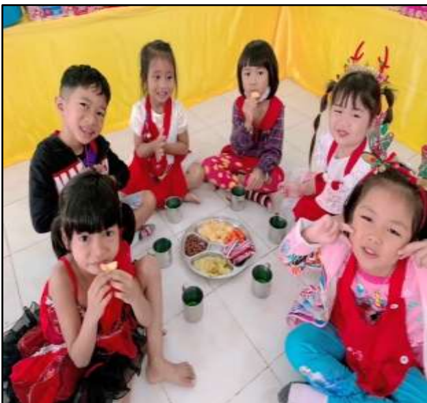
กิจกรรมวันขึ้นปีใหม่