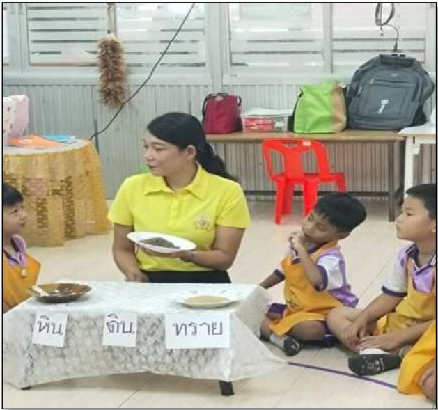
กิจกรรมเสริมประสบการณ์