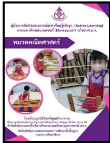
คู่มือหมวดคณิตศาสตร์