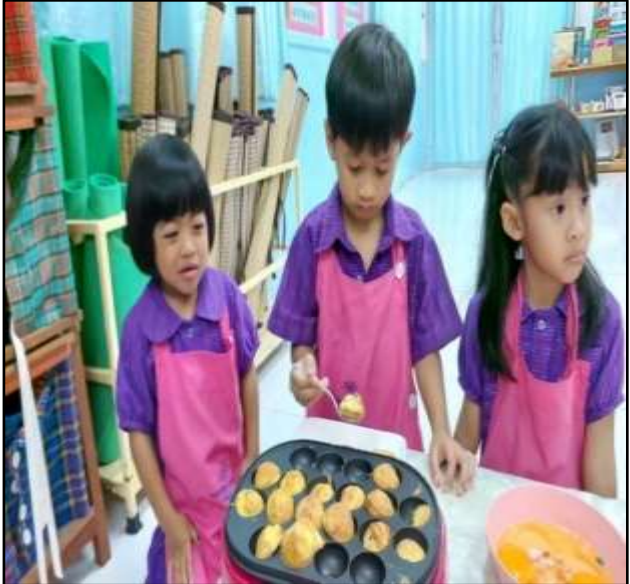
กิจกรรมประกอบอาหารไข่ครก