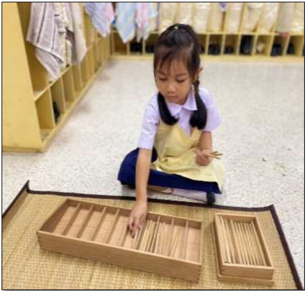
กิจกรรมกล่องกระสวย