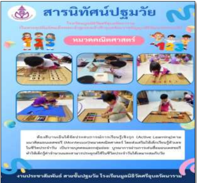
สารนิทัศน์หมวดคณิตศาสตร์