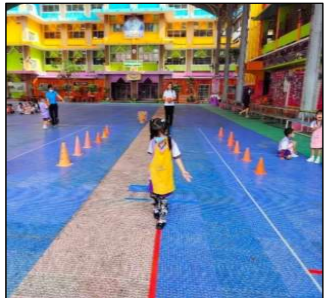
การประเมินพัฒนาการทางด้านร่างกาย