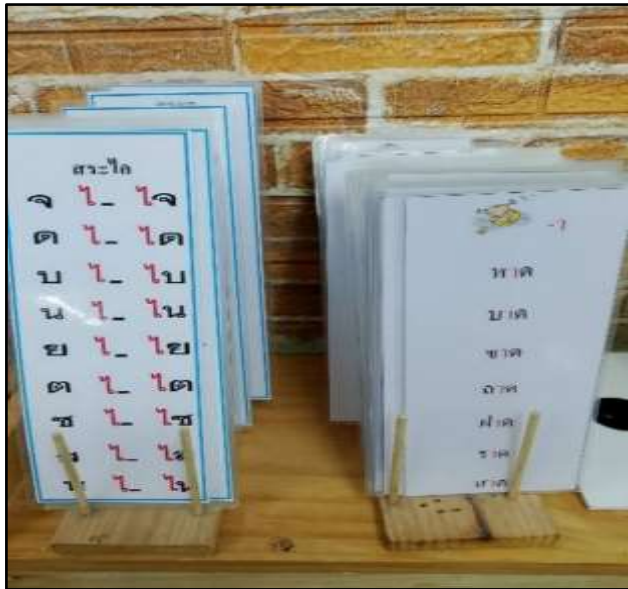
บัตรอ่านสระ