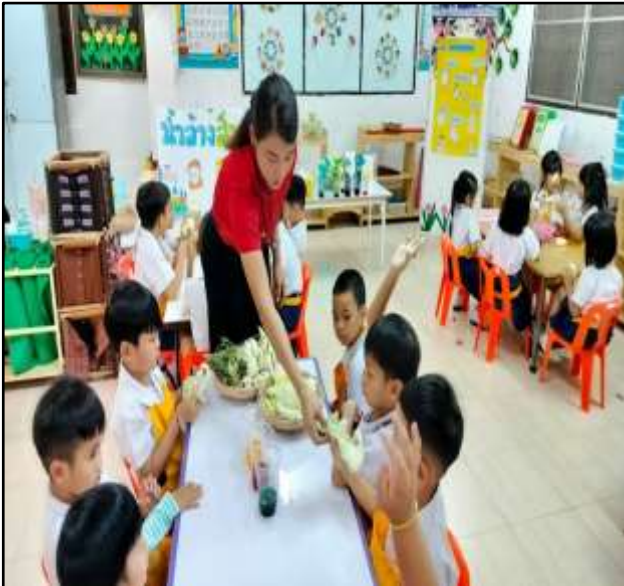
กิจกรรมทดลองพืชดูดสี