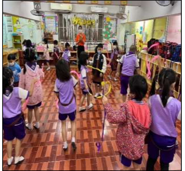
กิจกรรมเคลื่อนไหวและจังหวะ