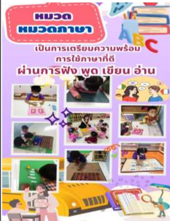
ภาพที่ 5 : ชั้นการจัดประสบการณ์