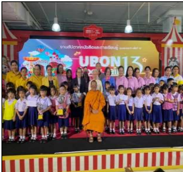
ตัวแทนสายชั้นปฐมวัยร่วมกิจกรรมสวด สรภัญญะที่โรงแรมสุนีย์แกรนด์