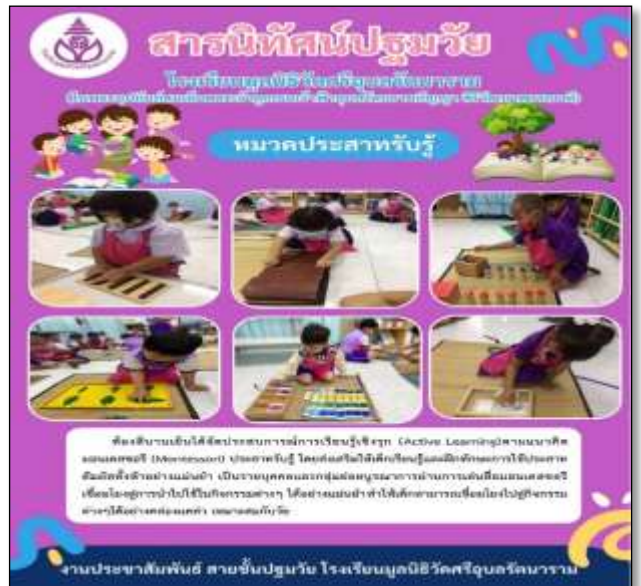
สารนิทัศน์หมวดประสาทสัมผัส