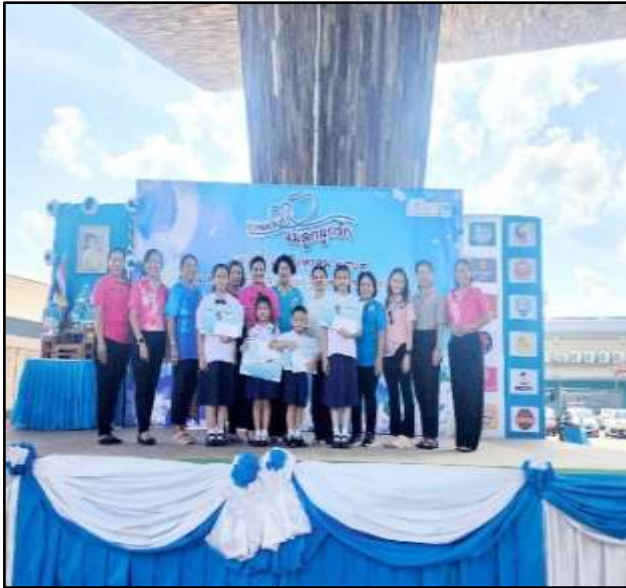
เด็กประกวดพูดเรียงร้อยแก้วในวันแม่