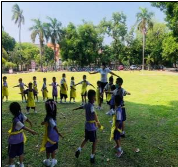
กิจกรรมกลางแจ้ง กายบริหาร