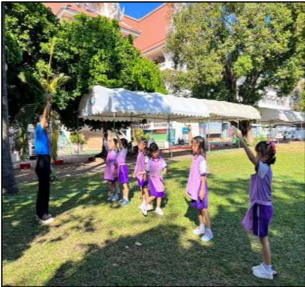
กิจกรรมการเรียนรู้เรื่องอากาศอยู่รอบตัวเรา