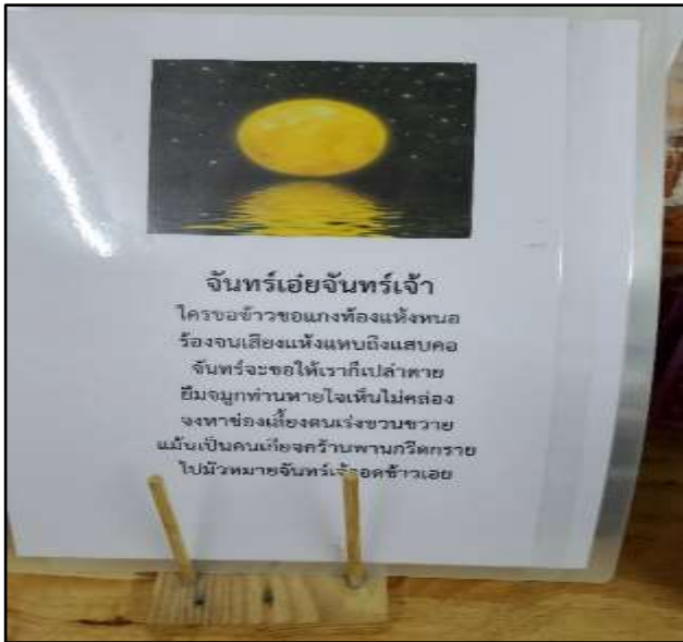
คำคล้องจอง