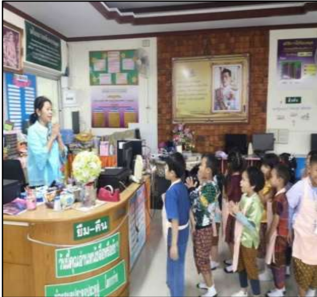
ร่วมกิจกรรมแหล่งเรียนรู้ห้องสมุด