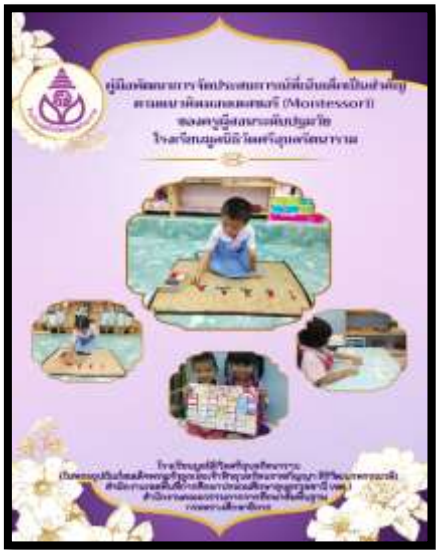
คู่มือการการจัดประสบการณ์ ตามแนวคิดมอนเตสซอรี