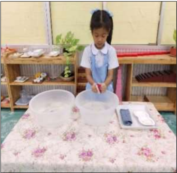
กิจกรรมล้างมือ