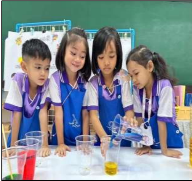
กิจกรรมการทดลองผสมสี