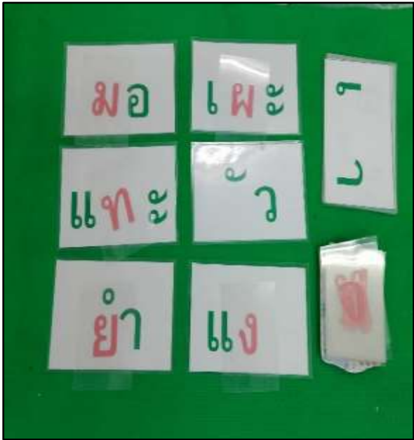
บัตรอ่านสระผสม