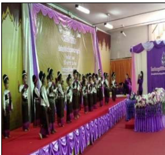
กิจกรรมร่ำอวยพรแสดงความยินดี