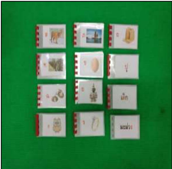
สมุดอนุทินพยัญชนะ