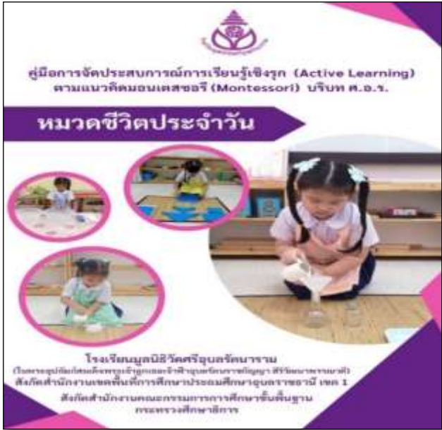
คู่มือหมวดชีวิตประจำวัน