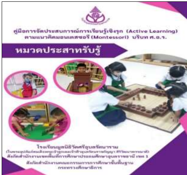
คู่มือหมวดประสาทรับรู้