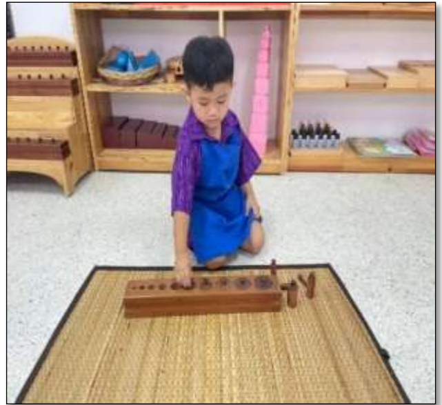
กิจกรรมแท่นกระบอกพิมพ์