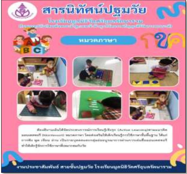
สารนิทัศน์หมวดภาษา