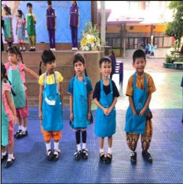
กิจกรรมกายบริหาร