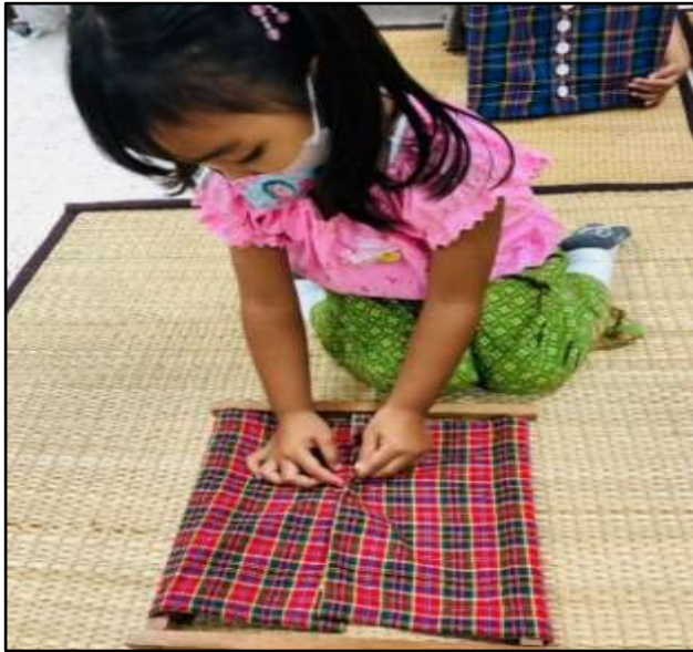
กิจกรรมมอนเตสซอรี