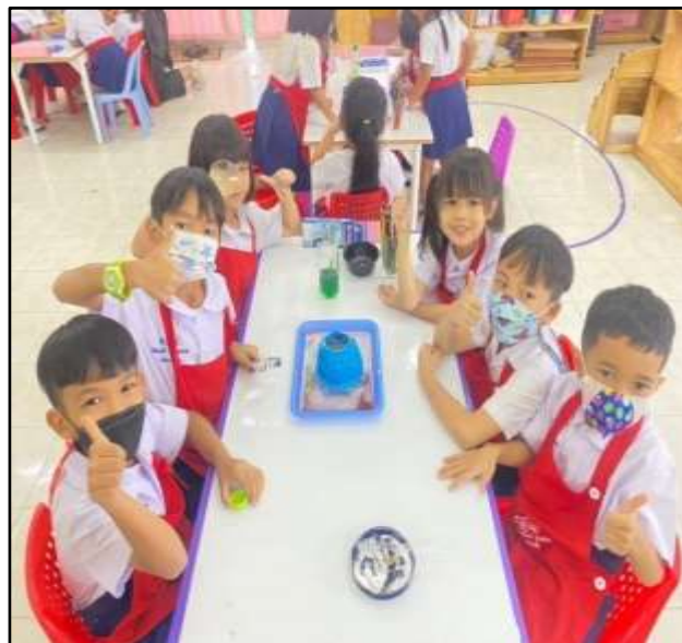
ร่วมกิจกรรมกลุ่มการทดลองวิทยาศาสตร์