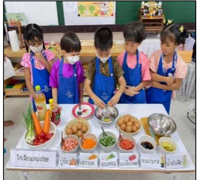
กิจกรรมเสริมประสบการณ์ หน่วยอาหารดีมีประโยชน์