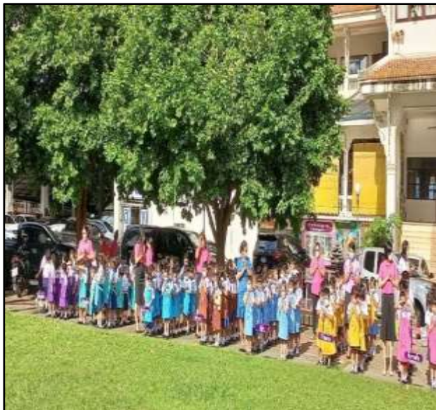
กิจกรรมเข้าแถวเคารพธงชาติปฐมนวัย