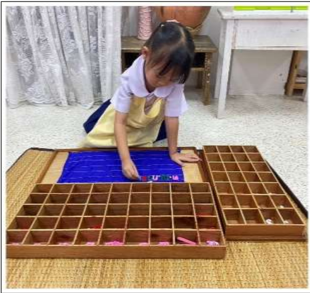
กิจกรรมอักษรเคลื่อนที่