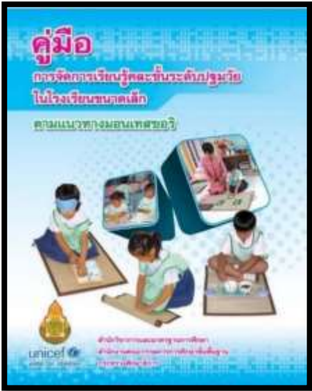
คู่มือการจัดการเรียนรู้คละชั้นระดับ ปฐมวัย ตามแนวคิดมอนเตสซอรี