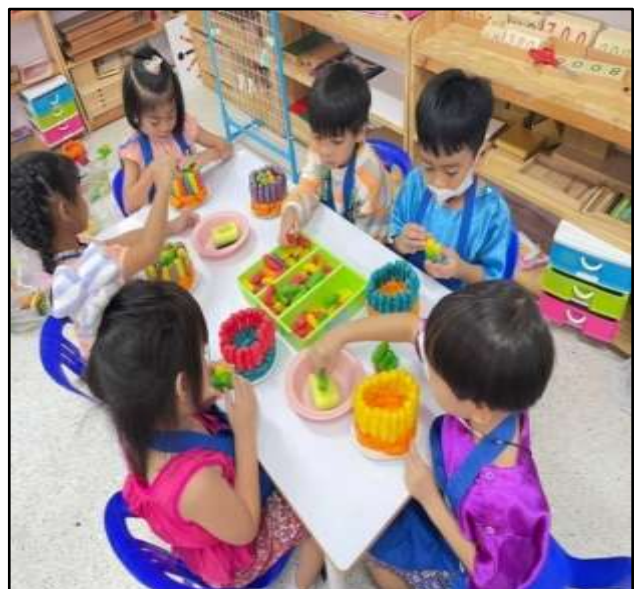
กิจกรรมประดิษฐ์กระทง