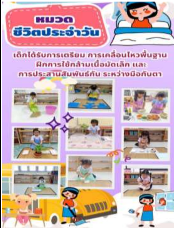
ภาพที่ 3 : ชั้นการจัดประสบการณ์