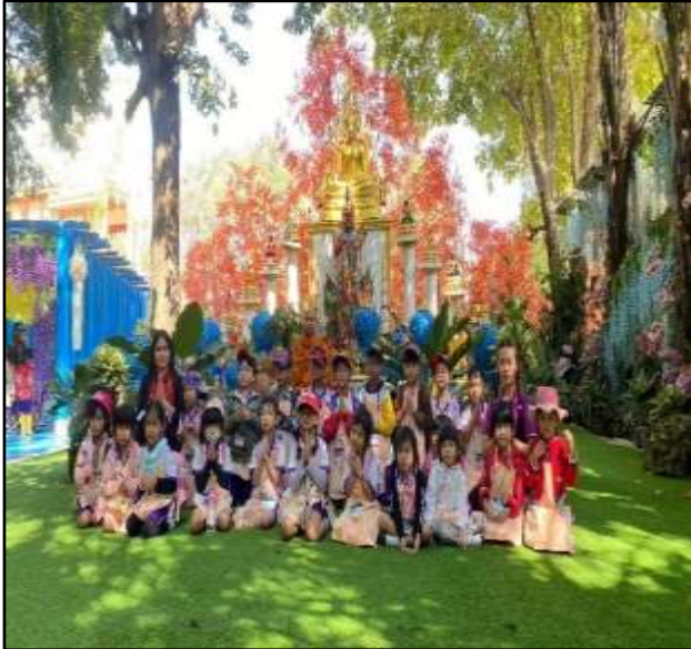
กิจกรรมทัศนศึกษาแหล่งเรียนรู้