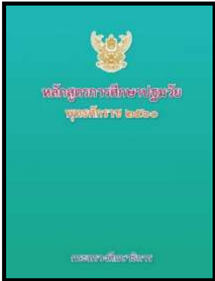
หลักสูตรการศึกษาปฐมวัย พุทธศักราช ๒๕๖๐