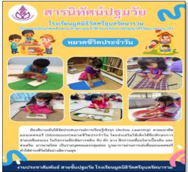
สารนิทัศน์หมวดชีวิตประจำวัน