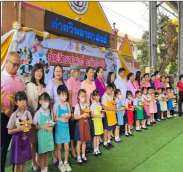
กิจกรรมค่ายวิทยาศาสตร์น้อยระดับปฐมวัย