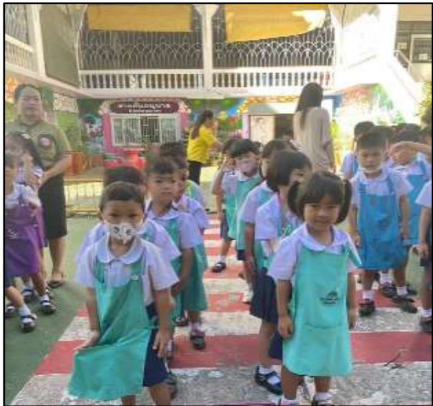
กิจกรรมเข้าแถวเคารพธงชาติ