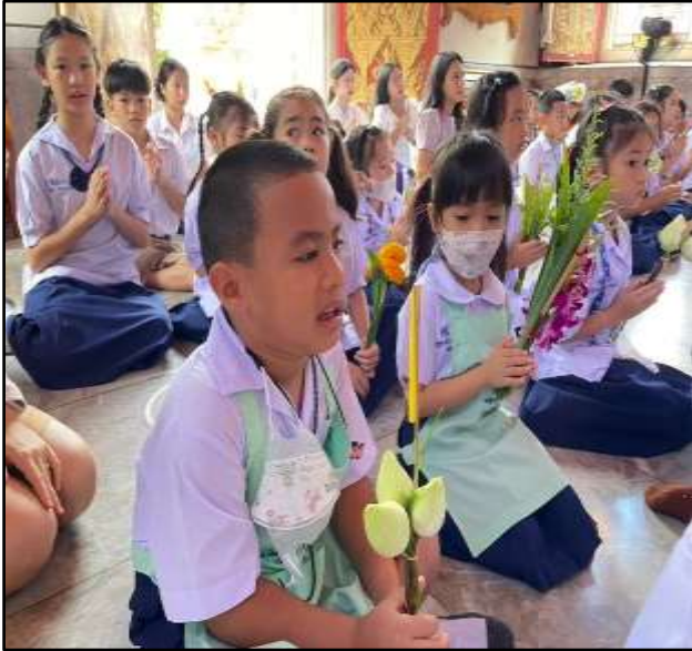
กิจกรรมวันเข้าพรรษา