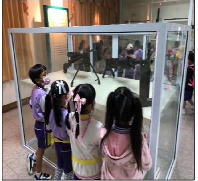
เด็กเรียนรู้วัฒนธรรมในสมัยยุคก่อน