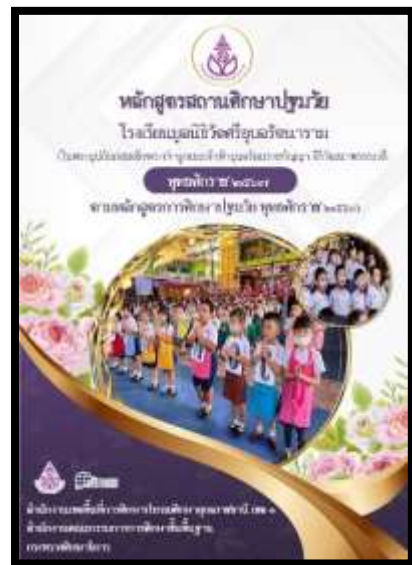
หลักสูตรสถานศึกษาปฐมวัย พุทธศักราช ๒๕๖๗