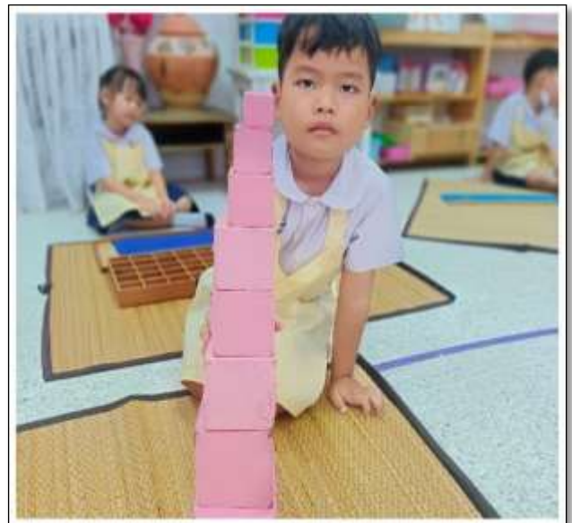
กิจกรรมหอคมพู