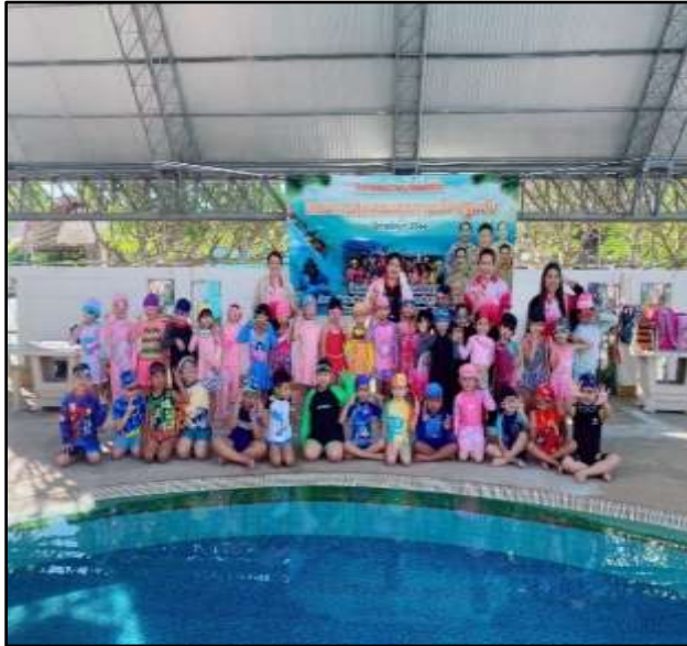
กิจกรรมว่ายน้ำเพื่อชีวิต