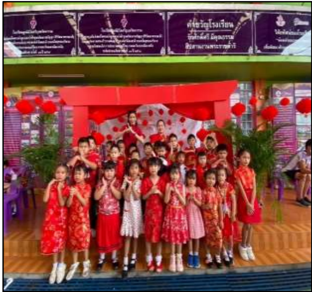
กิจกรรมแสดงวันตรุษจีน