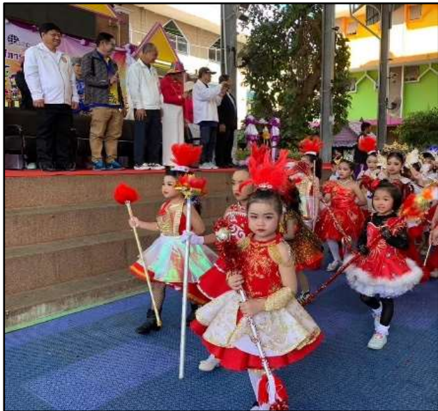
กิจกรรมกีฬาภายในของโรงเรียน