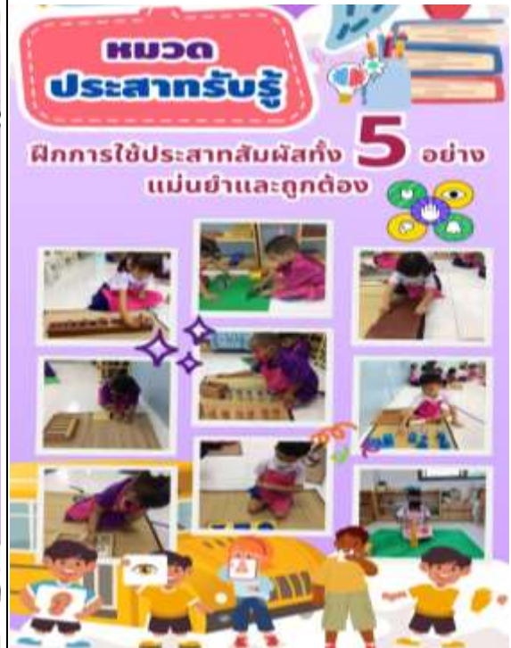
ภาพที่ 4 : ชั้นการจัดประสบการณ์