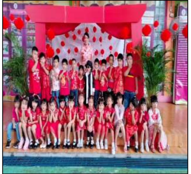
ร่วมกิจกรรมวันคริสต์มาส