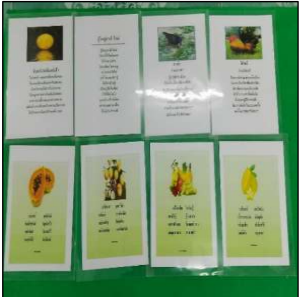
คำคล้องจอง