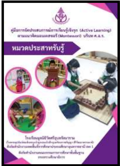
คู่มือหมวดประสาทรบุรี