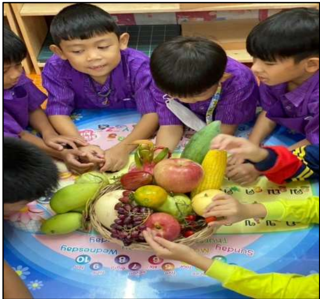
กิจกรรมจำแนกประเภทผลไม้