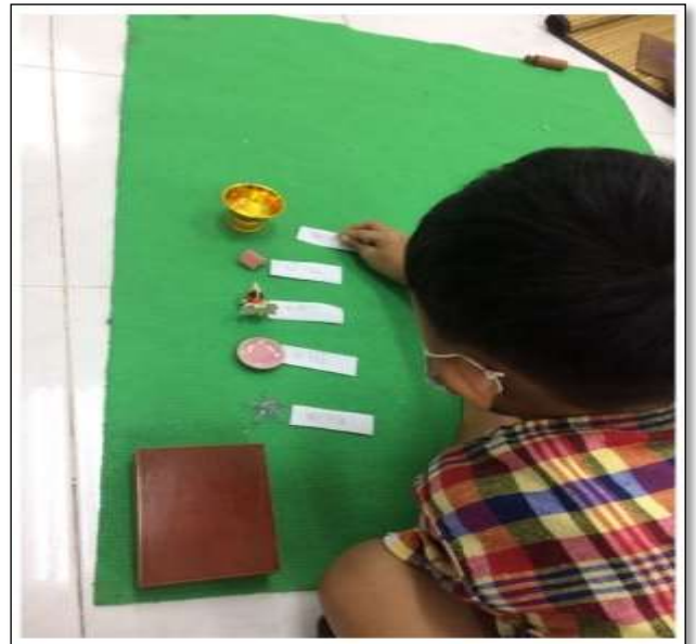
กิจกรรมการอ่านวัตถุกล่องที่ 1