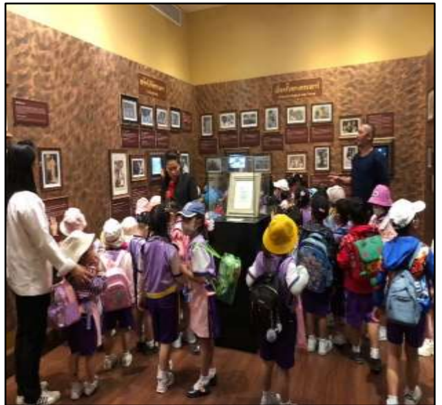
เด็กเรียนรู้เรื่องประวัติความเป็นมาของ