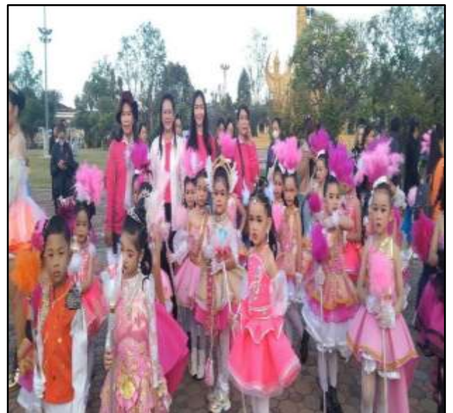
กิจกรรมกีฬาภายในโรงเรียน