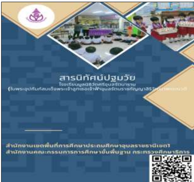
สารนิทัศน์ปฐมวัย