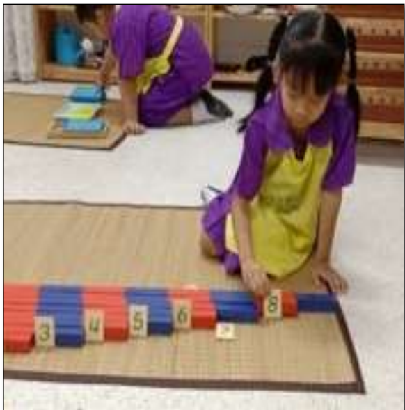
กิจกรรมพลองจำนวน