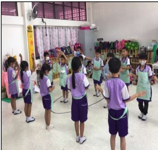
กิจกรรมเคลื่อนไหวร่างกาย