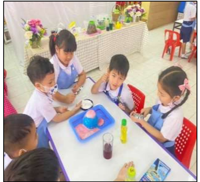
เด็กเรียนรู้เกี่ยวกับกิจกรรมทดลอง ภูเขาไฟระเบิด