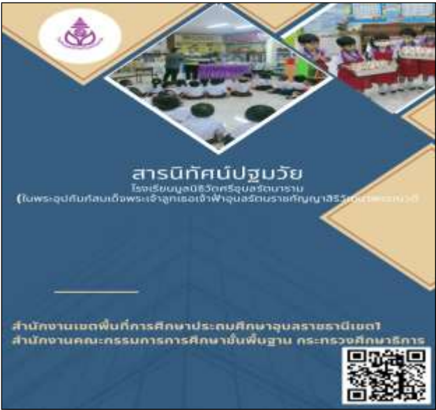
สารนิทัศน์ปฐมวัยหมวดภาษา