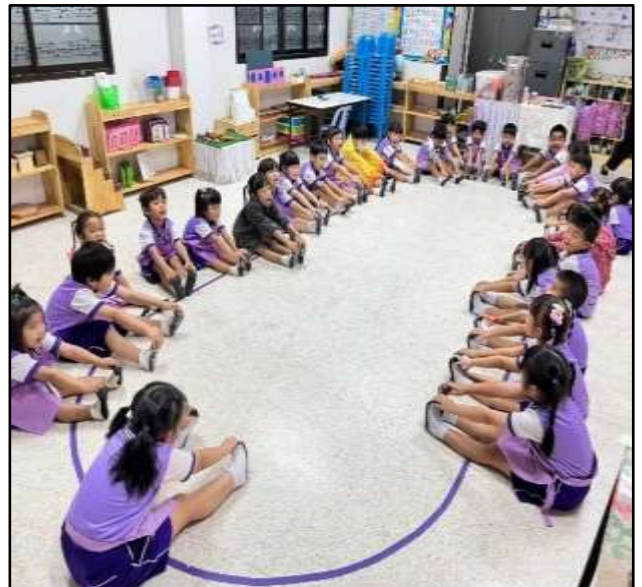
กิจกรรมเคลื่อนไหวร่างกาย ฟ้อนคลาย