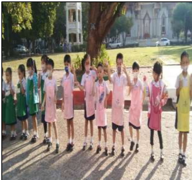
กิจกรรมกายบริหาร