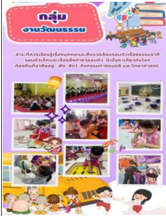
ภาพที่ 7 : ชั้นการจัดประสบการณ์