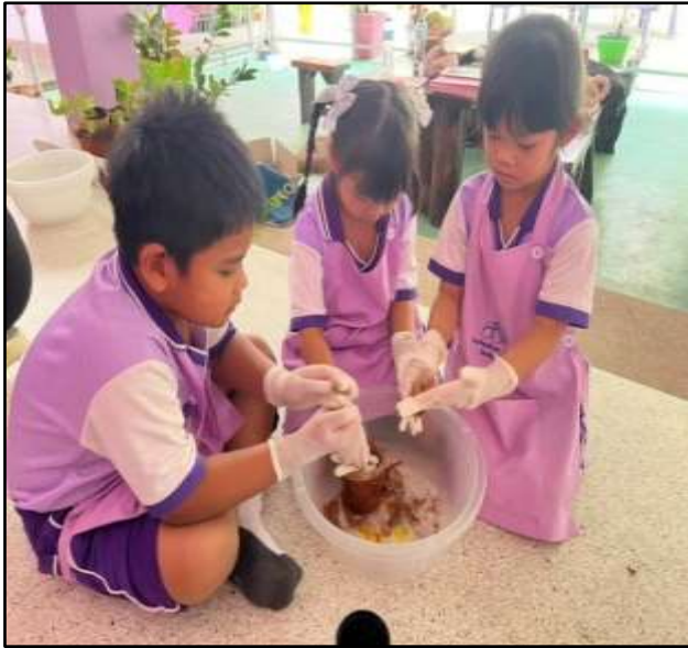
กิจกรรมประดิษฐ์กระดาษต้นไม้