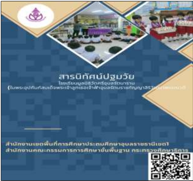
สารนิทัศน์ปฐมวัย