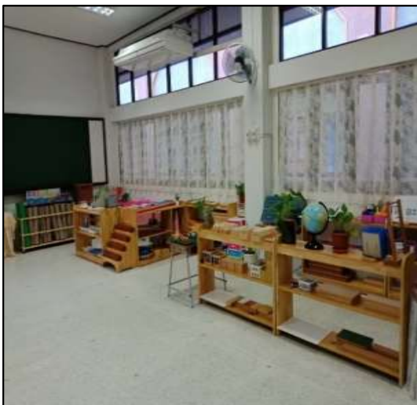
สื่อหมวดภาษา