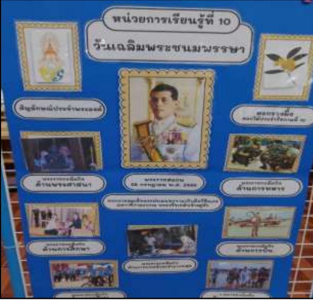
ป้ายนิเทศตามหน่วย