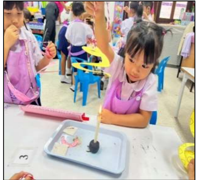
เด็กเรียนรู้เกี่ยวกับกิจกรรมทดลอง งูต้นระบ่ำ