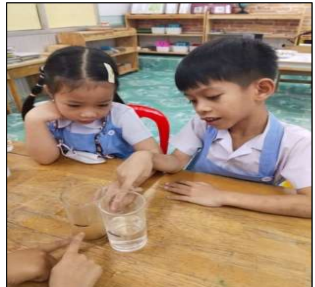
การสังเกตน้ำในแก้ว ลักษณะของ ความเหมือนความต่าง