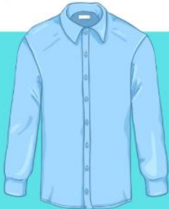
Shirt (เชิร้ท) เสืือเชิร้ท