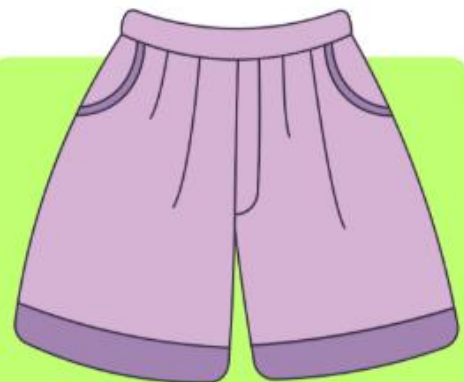
Shorts (ชอร้ทส์) กางเกงขาสั้น