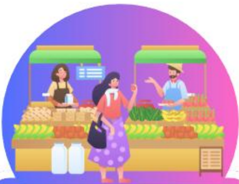
Market ตลาด (มาร์-เก็ต)