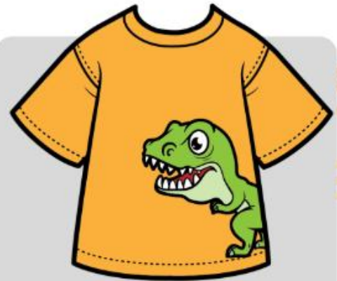
T-Shirt (ที-เชิร้ท) เสืือยี้ด