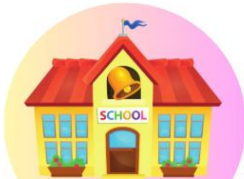
School โรงเรียน (สคูล)