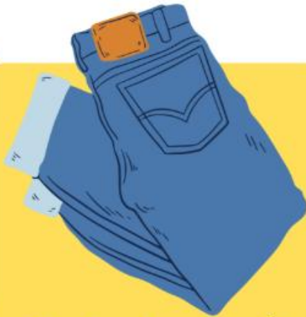
Pants (แพนทส์) กางเกง