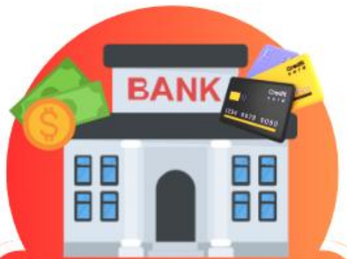
Bank ธนาคาร (แบงก์)