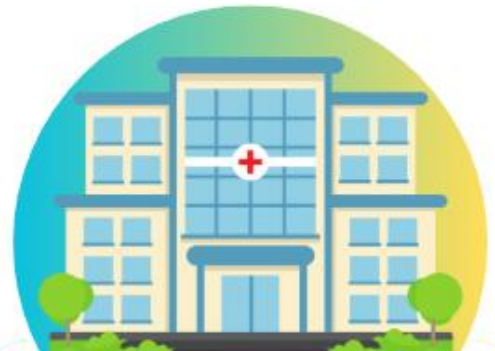
Hospital โรงพยาบาล (ฮอส-พี-เทิล)