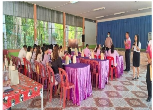
ภาพกิจกรรม PLC สังกัดชั้นเรียนและสะท้อนผลการใช้นวัตกรรม