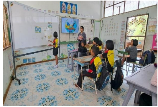
การนำนวัตกรรมไปเผยแพร่กับโรงเรียนในเครือข่ายสถานศึกษาที่ ๑๕ (เชียงใหม่ ๘)