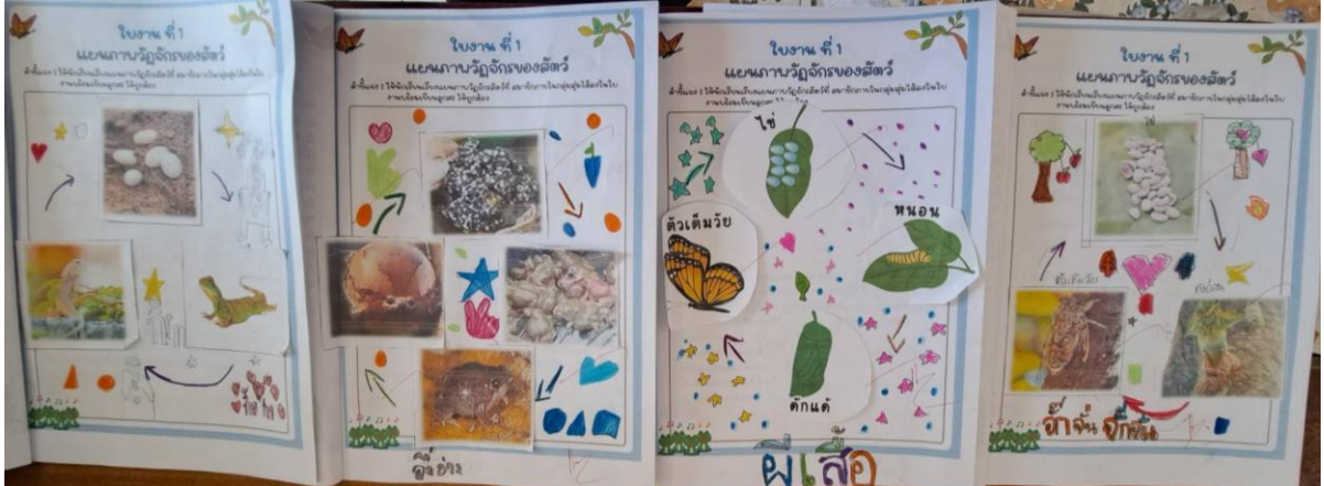
การจัดการเรียนรู้กับนักเรียนกลุ่มเป้าหมายจำนวน ๑๕ คน