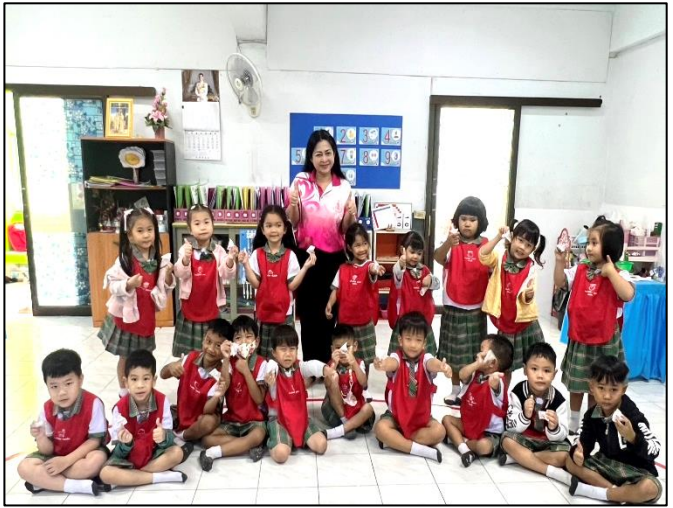
ผลงานการประดิษฐ์เหรียญโปรยทานรูปทรง ถูขนมสามเหลี่ยมของเด็กๆเสร็จแล้วเย้ๆ