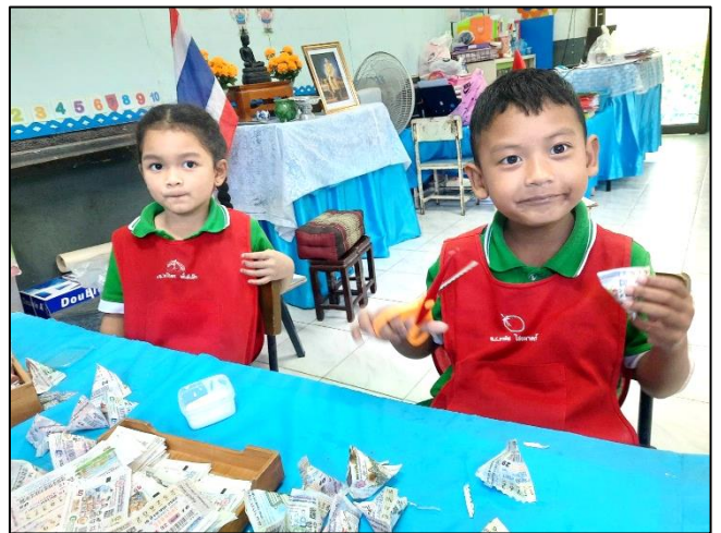
ขั้นตอนสุดท้ายรอให้กาวแห้งแล้วใช้กรรไกรซิกแซกตัดขอบ