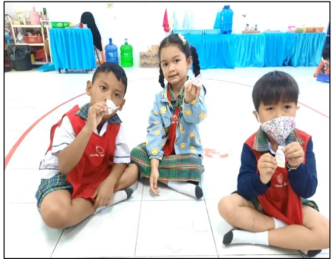
เด็กๆเริ่มลงมือพับกระดาษติดกาว