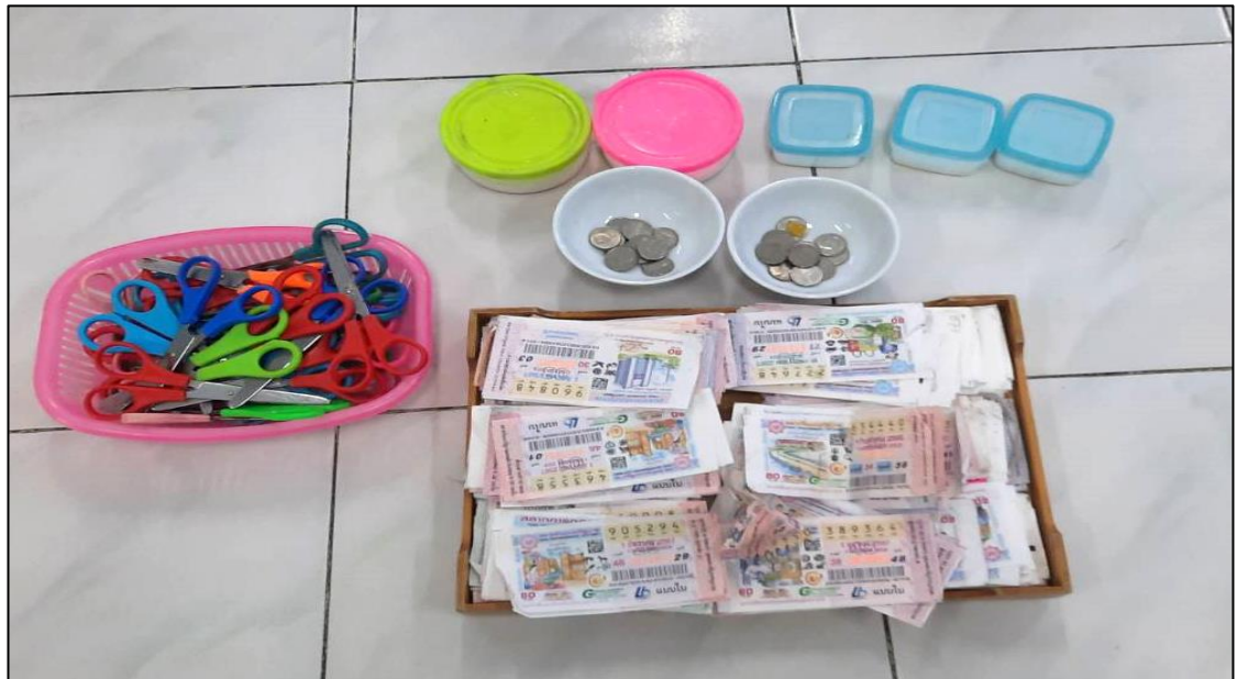
วัสดุอุปกรณ์