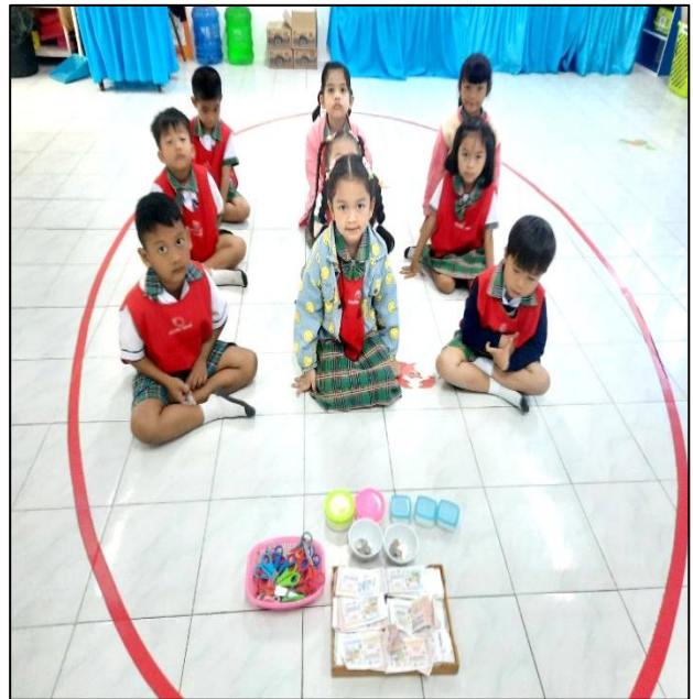
เด็กๆนำสลากกินแบ่งที่ไม่ถูกรางวัลนำมาเป็นอุปกรณ์ในการประดิษฐ์