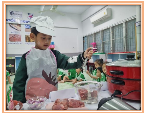
เด็กๆปั่นหมูและเครื่องปรุงจนละเอียดเป็นเนื้อเดียวกัน