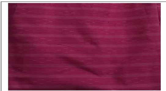
ผ้ากาบบัว