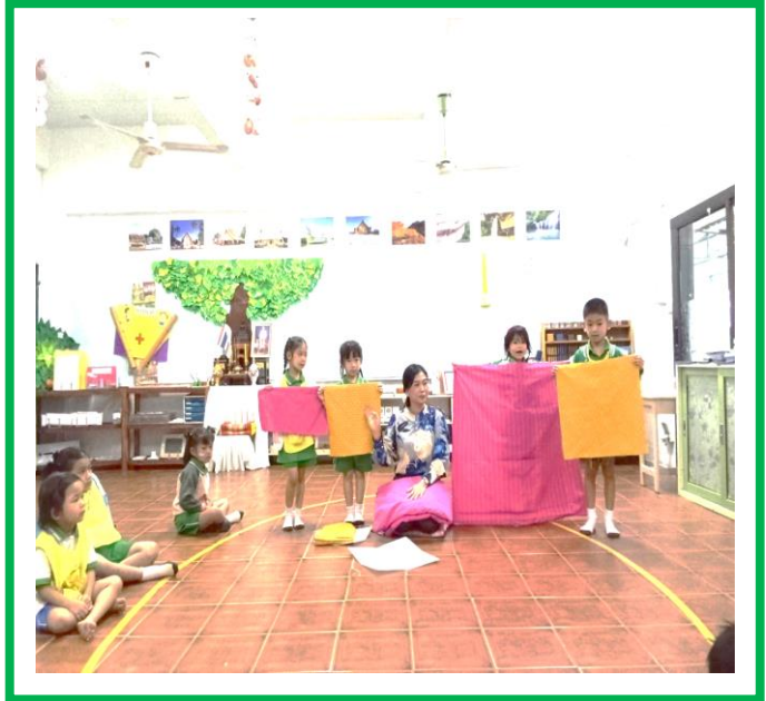
ภาพกิจกรรมระยะที่ ๒