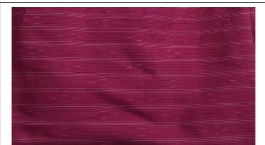
ผ้ากาบบัว