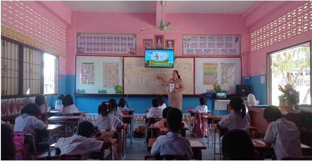
การจัดการเรียนการสอน