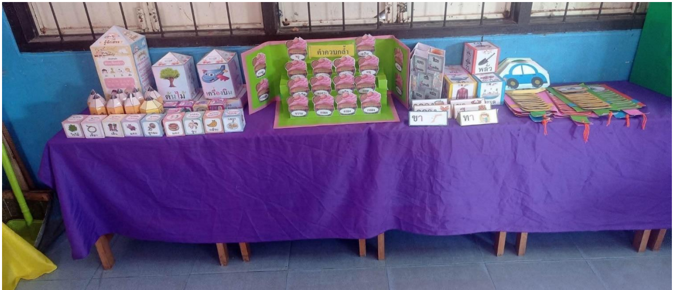
การทำกิจกรรมของนักเรียน