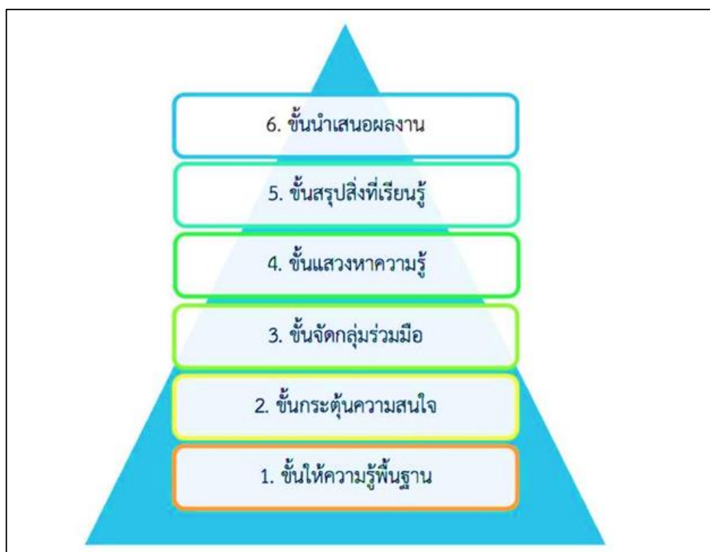
ขั้นตอนการจัดการเรียนรู้แบบใช้โครงงานเป็นฐาน

การจัดการเรียนรู้แบบใช้โครงงานเป็นฐาน ที่ได้จากโครงการสร้างชุดความรู้ เพื่อสร้างเสริมทักษะแห่งศตวรรษที่ ๒๑ของเด็กและเยาวชน:จากประสบการณ์ความสำเร็จของโรงเรียน ไทย ของคุณกวี โยเหลา และคณะ มี ๖ ขั้นตอน ดังนี้