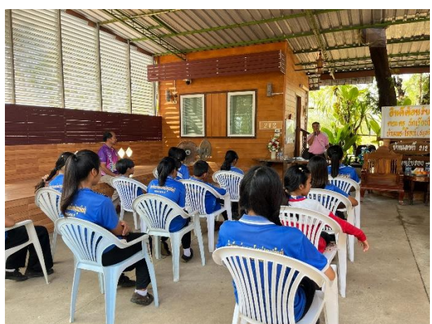
ภาพที่ ๑-๖ พานักเรียนเรียนรู้ประวัติศาสตร์บ้านพระโจชน์