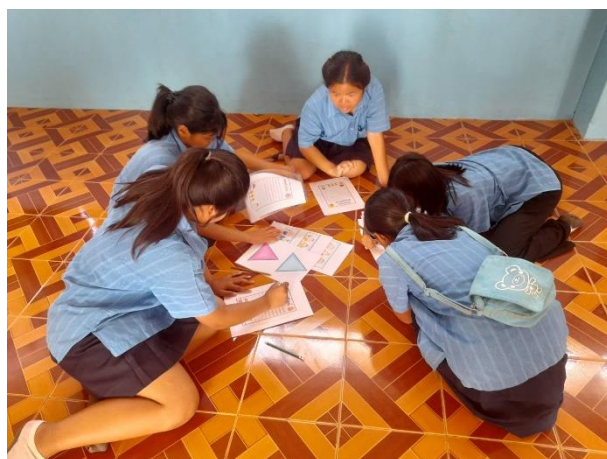
ภาพที่ ๗-๑๐ นักเรียนดำเนินการทำกิจกรรมเกี่ยวกับประวัติศาสตร์บ้านพระโขนง