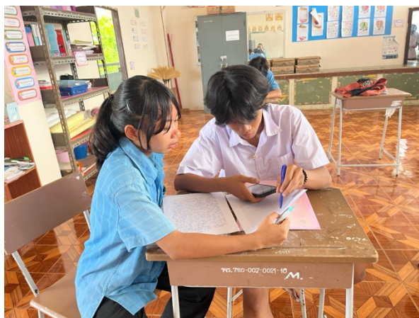
การจัดกิจกรรมการเรียนรู้แบบร่วมมือ