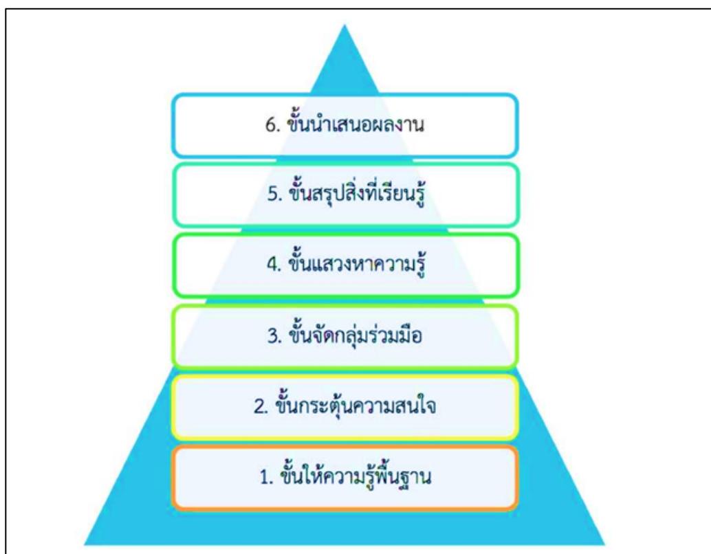
ขั้นตอนการจัดการเรียนรู้แบบใช้โครงงานเป็นฐาน

การจัดการเรียนรู้แบบใช้โครงงานเป็นฐาน ที่ได้จากโครงการสร้างชุดความรู้ เพื่อสร้างเสริมทักษะแห่งศตวรรษที่ 21 ของเด็กและเยาวชน: จากประสบการณ์ความสำเร็จของโรงเรียน ไทย ของดุสิต โยเหลา และคณะ มี 6 ขั้นตอน ดังนี้