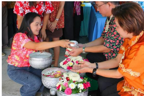
ภาพการรดน้ำดำหัวผู้ใหญ่