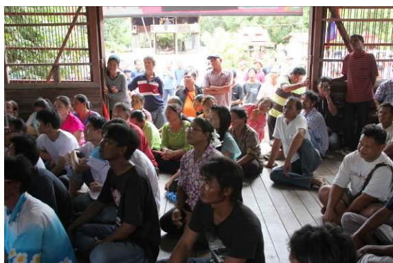
ภาพการประชุม