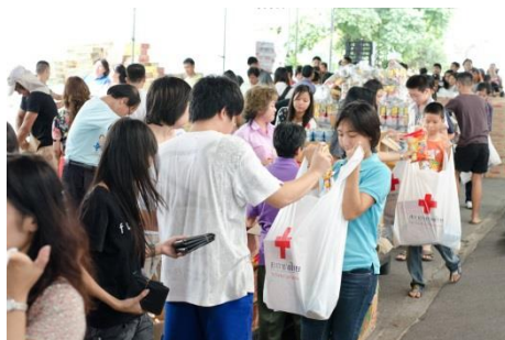
.....การให้ความช่วยเหลือกัน.....