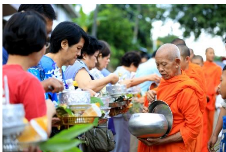
.....การเข้าร่วมกิจกรรมในชุมชน.....