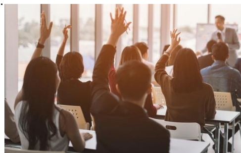
.....การมีส่วนร่วมในการแสดงความคิดเห็น.....