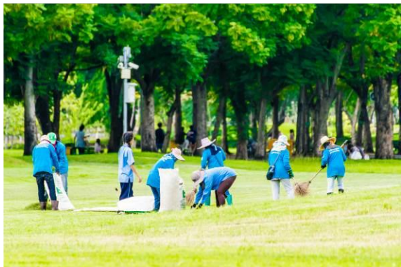
ภาพการทำความสะอาด