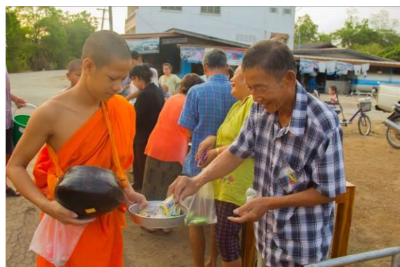
ภาพการทำบุญตักบาตร