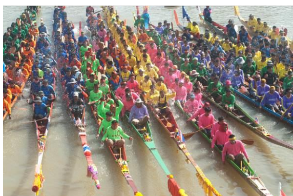
ภาพแข่งกีฬางานประเพณีของชุมชน