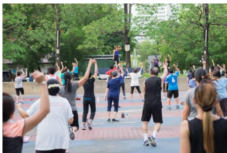
.....การร่วมกิจกรรมสร้างความสามัคคี.....