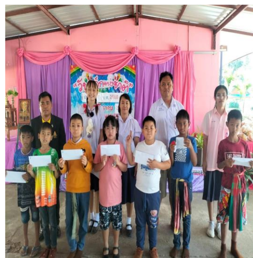
เด็กได้รับทุนการศึกษาในโอกาสวันเด็กแห่งชาติ