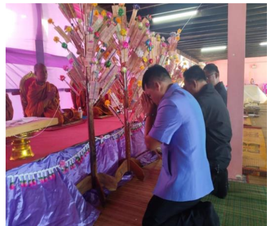
ผ้าป่าการศึกษาเพื่อสร้างโดมทรงไทย