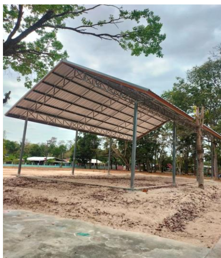
อาคารโดมทรงไทยอยู่ในระหว่างการก่อสร้าง