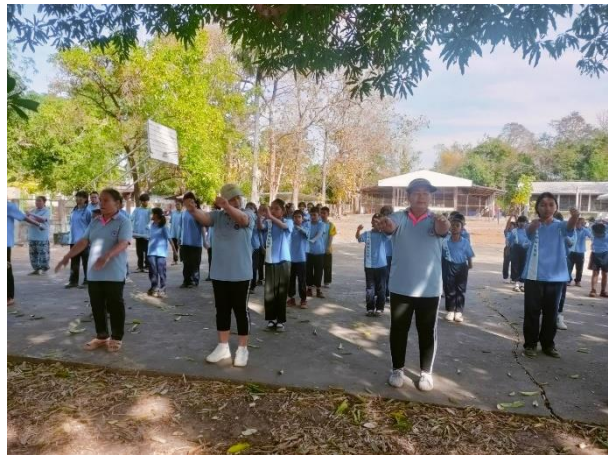
จัดกิจกรรมแอโรบิกพลิกชีวิต โดยขอความร่วมมือจากเครือข่าย อาสาสาธารณสุขประจำหมู่บ้านมาให้ความรู้แก่นักเรียน