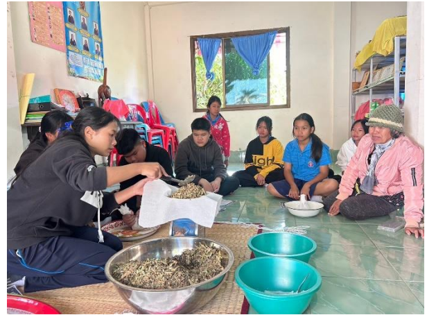
นักเรียนศึกษาเรียนรู้แหล่งเรียนรู้วิถีสาขากิจชุมชนกลุ่มสมุนไพรวัดหนองหลัก (น้ำมันเหลืองแก้แมลงสัตว์กัดต่อย, ลูกประคบสมุนไพร)