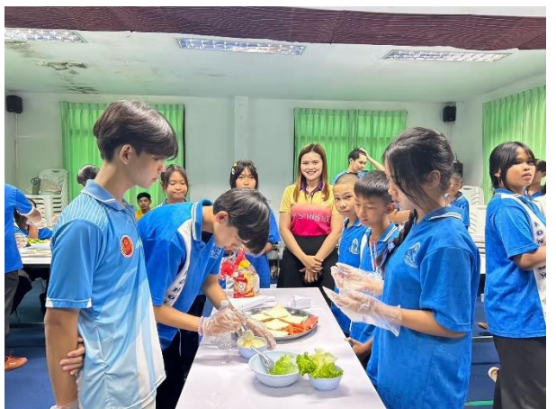
ส่งเสริมให้นักเรียนเข้าร่วมการฝึกอบรมส่งเสริมอาชีพพระยะสันตำบลเหล่าบก เรื่องอาหารเพื่อสุขภาพ (การทำแซนวิช, คุกกี้ตัวหนอน)