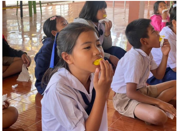
เจ้าหน้าที่จากโรงพยาบาลส่งเสริมสุขภาพประจำตำบลบ้านหนองหลักให้ความรู้ ในเรื่องทันตสุขภาพและตรวจสุขภาพฟันให้กับนักเรียนในโรงเรียน