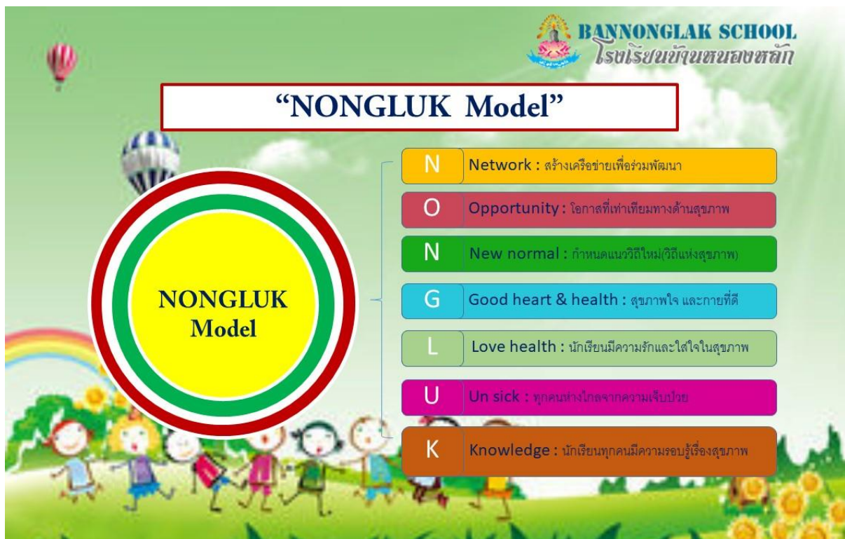
รูปที่ ๑ : NONGLUK Model

โรงเรียนได้ดำเนินการออกคำสั่งแต่งตั้งคณะกรรมการ โดยใช้หลักการเลือกคนให้มีความเหมาะสมกับลักษณะของงาน หลังจากนั้นได้รับฟังความคิดเห็นและข้อเสนอแนะจากทุกฝ่ายที่เกี่ยวข้อง พร้อมทั้งประชุมคณะกรรมการเพื่อร่วมกันออกแบบนวัตกรรม โดยได้ยึดเอาความคิดเห็นและข้อเสนอแนะจากทุกฝ่ายมาเป็นแนวทางในการออกแบบนวัตกรรม ผลจากการร่วมกันออกแบบของคณะกรรมการ ทำให้ได้รูปแบบของ NONGLUK Model ซึ่งมีรายละเอียด ดังแสดงใน รูปที่ ๑