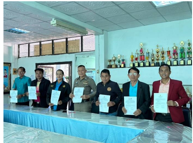
การประชุมเครือข่ายจิตอาสาด้านสุขภาพ ระหว่างโรงเรียนกับชุมชน ท้องถิ่น และหน่วยงานภายนอก