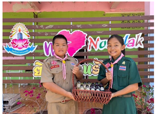
นักเรียนศึกษาเรียนรู้การทำน้ำสมุนไพรจากสมุนไพรที่มีในท้องถิ่น โดยกลุ่มหนองหลักรักสุขภาพ