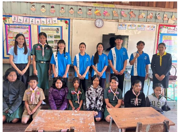
แกนนำจิตอาสา นักเรียนด้านโภชนาการ จิตอาสาต้านพันตสุขภาพ และจิตอาสาต้านการออกกำลังกาย ให้ความรู้และเผยแพร่ความรู้ให้กับน้อง ๆ นักเรียนในกลุ่มเครือข่าย