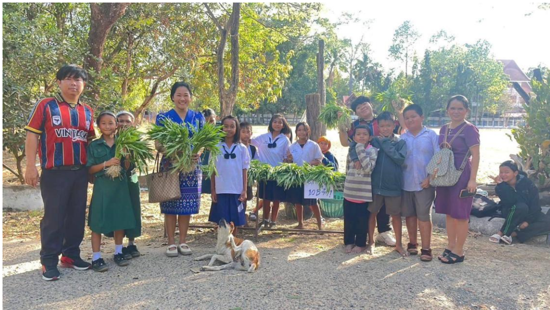
ภาพกิจกรรมการปลูกฝังให้นักเรียนมีความรับผิดชอบในหน้าที่ของตนเอง และรู้จักการดำเนินชีวิตอย่างพอเพียงตามแนวทางเศรษฐกิจพอเพียง