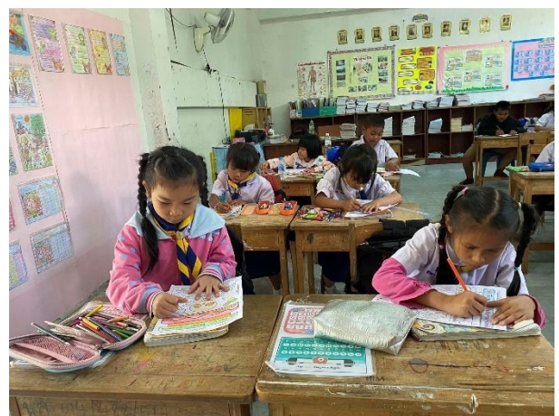
ภาพกิจกรรมการจัดการเรียนการสอนผ่านกระบวนการบูรณาการแบบสหวิทยาการ