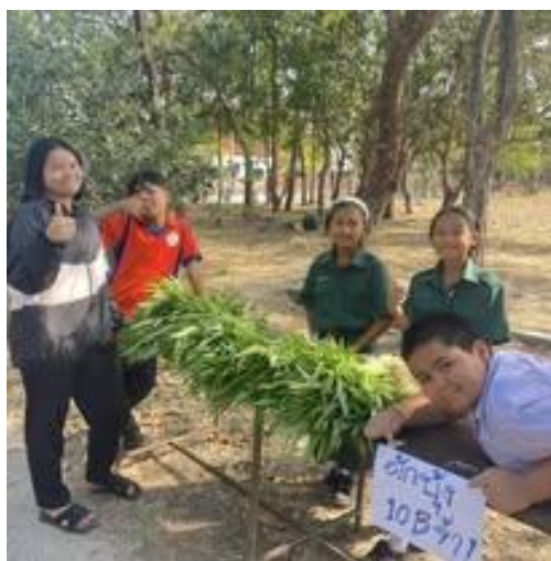
ภาพการฝึกทักษะอาชีพของห้องเรียนพอเพียง