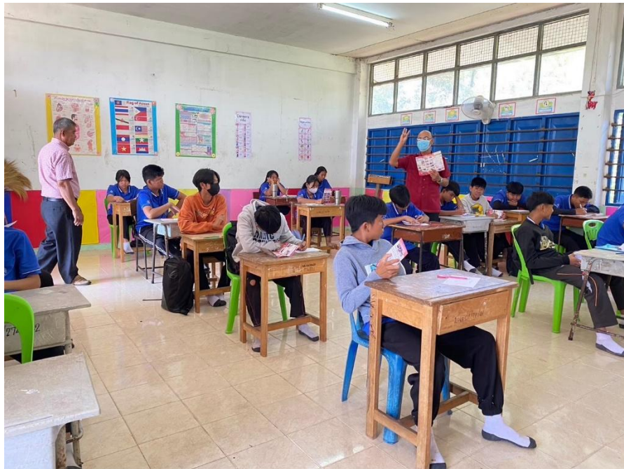
ภาพกิจกรรมการใช้กระบวนการห้องเรียนพอเพียงในศตวรรษที่ ๒๑