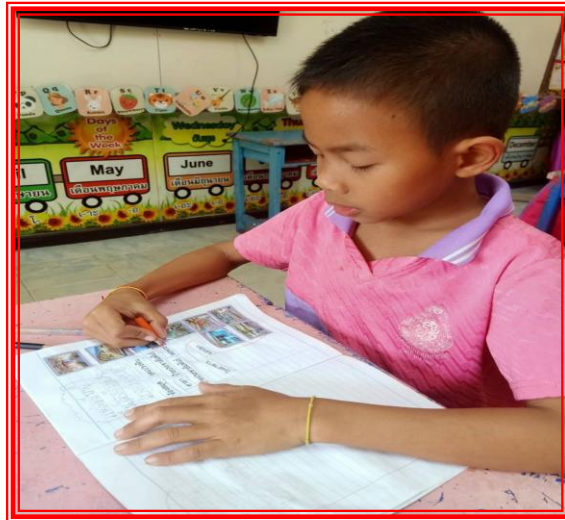
๑.๔ ชั้นสรุปความรู้ (Summary) ครูสร้างสถานการณ์จำลองให้นักเรียนสวมบทบาท นักเรียนสอนเพื่อน สอนน้อง