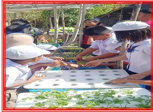
๑.๓ ชั้นลงมือเรียนรู้-ฝึกทำ-ฝึกฝน (Learn-Practice) กิจกรรมการปลูกผักไฮโดรโปนิคส์