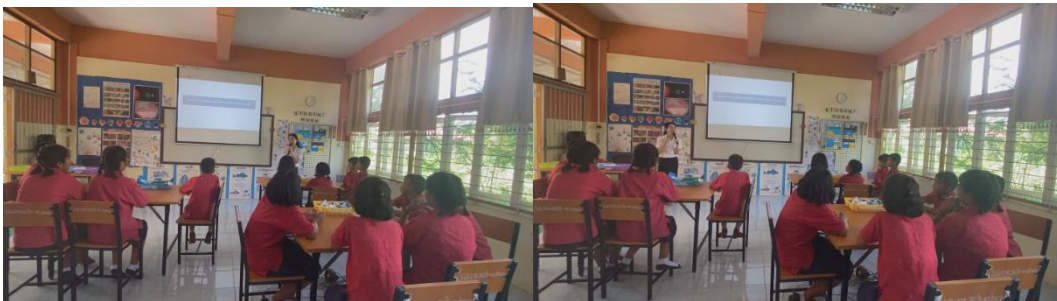
ครูเปิดโอกาสให้นักเรียนร่วมกันแสดงความคิดเห็น

5. ขั้นขยายความรู้ (Elaboration) เมื่อนักเรียนมีความรู้ความเข้าใจเกี่ยวกับลมบก ลมทะเลแล้ว ครูผู้สอนกระตุ้นผู้เรียนสู่การเชื่อมโยงความรู้เดิมกับความคิดเพิ่มเติมหรือสถานการณ์ใหม่ๆที่เกี่ยวข้องเพื่อให้ผู้เรียนมีความรู้ที่กว้างขวางขึ้น โดยตั้งคำถามว่า “ลมบก ลมทะเลมีผลต่อสิ่งมีชีวิตอย่างไร” ครูเปิดโอกาสให้นักเรียนร่วมกันแสดงความคิดเห็น