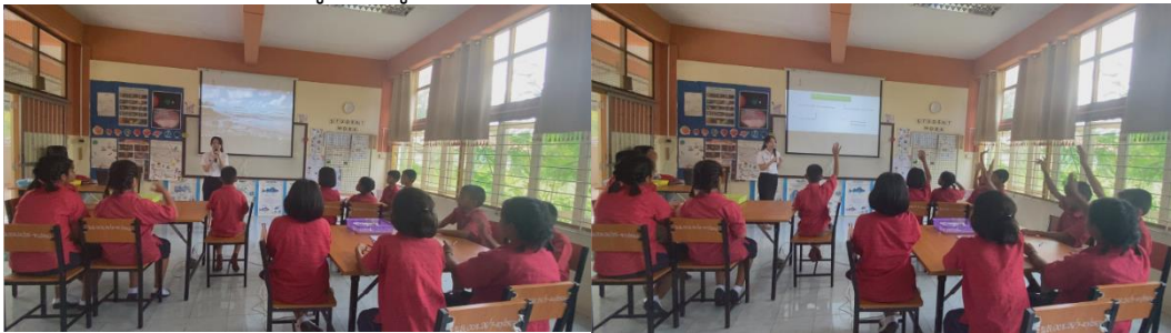
คลิปวิดีโอ คลื่นทะเล

1. ขั้นตรวจสอบความรู้เดิม (Elicitation) ขั้นนี้เป็นการกระตุ้นผู้เรียนด้วยการนำคลิปวิดีโอคลื่นทะเลเปิดให้ผู้เรียนดูและฟัง จากนั้นครูผู้สอนมีหน้าที่กระตุ้นด้วยคำถาม เชื่อมโยงความรู้เดิมและ ประสบการณ์ของผู้เรียน โดยให้ผู้เรียนตอบตามหลักการและเหตุผลทางวิทยาศาสตร์ ตรวจสอบความรู้พื้นฐานของผู้เรียน ซึ่งความรู้เดิมของผู้เรียนคือ เรื่อง ลม ซึ่งจะเชื่อมโยงไปสู่ความรู้เรื่อง ลมบก ลมทะเล