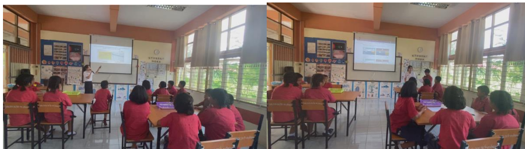
นักเรียนร่วมกันพยากรณ์ลมบก ลมทะเล และนำเสนอผลการพยากรณ์