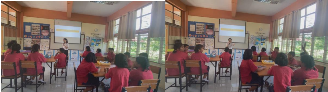
นักเรียนร่วมกันแสดงความคิดเห็นการนำความรู้เรื่องลมบก ลมทะเลไปใช้ในชีวิตประจำวัน

7. ชั้นนำความรู้ไปใช้ (Extention) เป็นขั้นสุดท้ายของกระบวนการเรียนรู้ในชั่วโมงเรียนนี้ นักเรียนมีความรู้ความเข้าใจเรื่อง ลมบก ลมทะเล และผลที่มีต่อสิ่งมีชีวิตและสิ่งแวดล้อมแล้วครูกระตุ้นให้นักเรียนเกิดการสร้างองค์ความรู้ในการนำความรู้ไปปรับใช้ในชีวิตประจำวันของนักเรียน โดยตั้งคำถามว่า “นักเรียนจะนำความรู้เรื่องลมบก ลมทะเลไปใช้ในชีวิตประจำวันอย่างไรบ้าง” นักเรียนร่วมกันแสดงความคิดเห็นบนฐานความเป็นเหตุเป็นผลตามหลักวิทยาศาสตร์ เพื่อสรุปองค์ความรู้ที่ได้ ครูผู้สอนให้นักเรียนทุกคนสร้างแผนผังความคิด เรื่อง ลมบก ลมทะเล เป็นการบ้านทำลงกระดาษ A4 ส่งในชั่วโมงหน้า ครูทำการประเมินผลการเรียนรู้จากชิ้นงานของนักเรียนอีกครั้ง