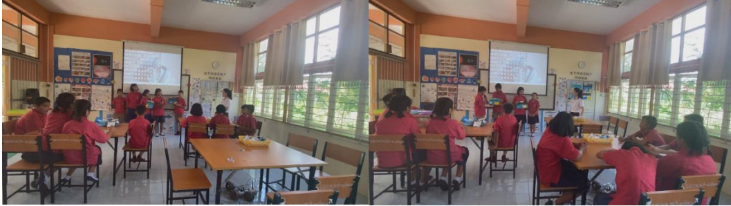
นักเรียนร่วมกันทำแบบจำลองลมบก ลมทะเลและนำเสนอชิ้นงาน

5. ขั้นขยายความรู้ (Elaboration) เมื่อนักเรียนมีความรู้ความเข้าใจเกี่ยวกับลมบก ลมทะเลแล้ว ครูผู้สอนกระตุ้นผู้เรียนสู่การเชื่อมโยงความรู้เดิมกับความคิดเพิ่มเติมหรือสถานการณ์ใหม่ๆที่เกี่ยวข้องเพื่อให้ผู้เรียนมีความรู้ที่กว้างขวางขึ้น โดยตั้งคำถามว่า “ลมบก ลมทะเลมีผลต่อสิ่งมีชีวิตอย่างไร” ครูเปิดโอกาสให้นักเรียนร่วมกันแสดงความคิดเห็น