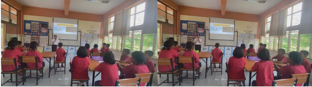
นักเรียนแสดงความคิดเห็นความแตกต่างหรือความเหมือนของภาพคลื่นทะเลที่ครูนำมา

3. ขั้นสำรวจค้นหา (Exploration) ในขั้นนี้ให้ผู้เรียนได้ลงมือปฏิบัติการทดลอง หัวข้อลมบก ลมทะเลโดยการใช้ทักษะทางวิทยาศาสตร์หลายด้านด้วยกัน ได้แก่ ทักษะการสังเกต ทักษะการวัด ทักษะการตั้งสมมติฐาน ทักษะการทดลอง และใช้อุปกรณ์ในการทดลองอย่างเหมาะสมและถูกต้อง มีการจดบันทึกผลการทดลองตามระยะเวลาที่กำหนด สังเกตการเปลี่ยนแปลงอุณหภูมิของอากาศจากเทอร์โมมิเตอร์ และสามารถสรุปผลจากการทดลองได้ เน้นการให้นักเรียนได้ทำงานโดยกระบวนการกลุ่ม มีการแบ่งหน้าที่ภายในกลุ่ม ฝึกการเป็นภาวะผู้นำและผู้ตาม ครูมีหน้าที่อำนวยความสะดวกให้แก่ นักเรียนและคอยสังเกตผู้เรียนตามกลุ่มอยู่ตลอดเพื่อให้คำแนะนำผู้เรียนหากผู้เรียนทำการทดลองคาดเคลื่อน