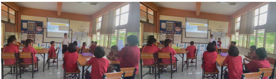
ตัวแทนนักเรียนจากทุกกลุ่มนำเสนอผลการทดลองที่ได้

และอากาศเหนือน้ำ โดยการจำลองสถานการณ์การทดลองให้นักเรียนอยู่บริเวณชายฝั่งริมทะเล เมื่อเสร็จให้นักเรียนนำเสนอผลการทดลองที่ได้จนครบทุกกลุ่ม จากนั้นครูและนักเรียนร่วมกันอภิปรายผลการทดลองเพื่อนำไปสู่ความรู้เรื่อง ลมบก ลมทะเล ครูผู้สอนนำตารางอุณหภูมิเพื่อให้นักเรียนวิเคราะห์อุณหภูมิตอนกลางวันและตอนกลางคืนบริเวณชายฝั่งและบริเวณน้ำทะเล โดยให้นักเรียนใช้ทักษะการพยากรณ์ นำข้อมูลมาคาดคะเนคำตอบลงในใบกิจกรรม ครูและนักเรียนลงข้อสรุปการเกิดและความแตกต่างของลมบก ลมทะเล เพื่อให้นักเรียนได้ใช้ความคิดสร้างสรรค์และใช้ความรู้ให้เป็นประโยชน์ทำแบบจำลองลมบกลมทะเล จากนั้นนำเสนอชิ้นงานและอธิบายลมบก ลมทะเลอีกครั้ง