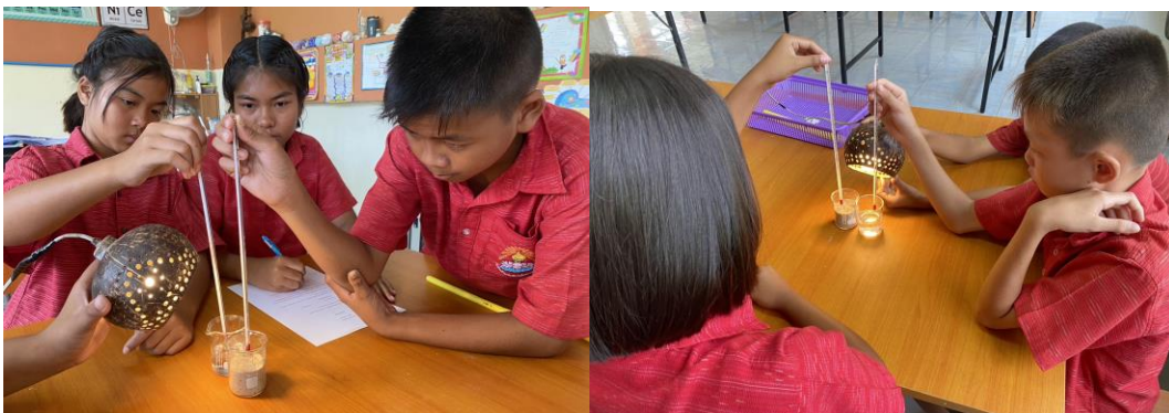
นักเรียนปฏิบัติการทดลองเปรียบเทียบอุณหภูมิของอากาศเหนือทรายและอากาศเหนือน้ำ

4. ขั้นอธิบายความรู้ (Explanation) มีจุดมุ่งหมายเพื่อให้ นักเรียนสามารถอธิบายและเปรียบเทียบการเกิดลมบก ลมทะเลได้ โดยการสร้างองค์ความรู้จากปฏิบัติการทดลองเปรียบเทียบอุณหภูมิของอากาศเหนือทราย