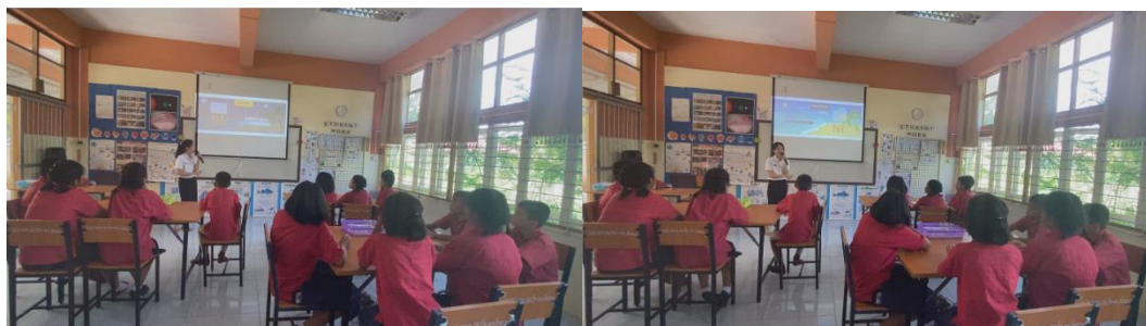
ครูและนักเรียนร่วมกันลงข้อสรุปการเกิดและความแตกต่างของลมบก ลมทะเล