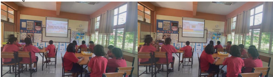
นักเรียนเล่นเกมตอบคำถามลมบก ลมทะเลจาก Kahoot

6. ขั้นประเมินผล (Evaluation) เป็นขั้นตอนของการให้นักเรียนได้ประเมินผลการเรียนรู้ของตนเองในทันที โดยการที่ครูผู้สอนใช้ Kahoot สร้างชุดคำถาม จำนวน 10 ข้อ เกี่ยวกับลมบก ลมทะเล และผลที่มีต่อสิ่งมีชีวิตและสิ่งแวดล้อม ซึ่งเป็นสื่อเทคโนโลยีการแข่งขันการตอบคำถาม นักเรียนได้มีการใช้ทักษะเทคโนโลยี ครูผู้สอนมีการเสริมแรงให้กับผู้เรียนคือมีรางวัลให้นักเรียนที่ได้คะแนนสูงสุด 3 อันดับแรก และเนื่องจากครูมีการสังเกตและประเมินแล้วว่านักเรียนยังทำแบบจำลองของตนเองยังไม่เสร็จเรียบร้อยดี ครูผู้สอนจึงให้นักเรียนมีการปรับปรุงชิ้นงานในแต่ละกลุ่ม และให้นักเรียนทุกคนมีการร่วมกันประเมินโดยการแบะสติ๊กเกอร์ให้กลุ่มเพื่อนที่ตนคิดว่าผลงานถูกต้องและสวยงามในคาบเรียนชั่วโมงหน้า