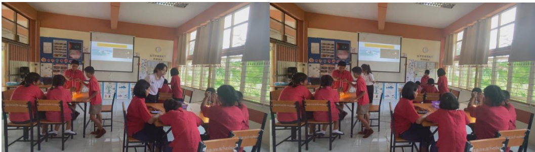
นักเรียนแต่ละกลุ่มทำการทดลอง โดยมีครูเป็นผู้อำนวยความสะดวก

3. ขั้นสำรวจค้นหา (Exploration) ในขั้นนี้ให้ผู้เรียนได้ลงมือปฏิบัติการทดลอง หัวข้อลมบก ลมทะเลโดยการใช้ทักษะทางวิทยาศาสตร์หลายด้านด้วยกัน ได้แก่ ทักษะการสังเกต ทักษะการวัด ทักษะการตั้งสมมติฐาน ทักษะการทดลอง และใช้อุปกรณ์ในการทดลองอย่างเหมาะสมและถูกต้อง มีการจดบันทึกผลการทดลองตามระยะเวลาที่กำหนด สังเกตการเปลี่ยนแปลงอุณหภูมิของอากาศจากเทอร์โมมิเตอร์ และสามารถสรุปผลจากการทดลองได้ เน้นการให้นักเรียนได้ทำงานโดยกระบวนการกลุ่ม มีการแบ่งหน้าที่ภายในกลุ่ม ฝึกการเป็นภาวะผู้นำและผู้ตาม ครูมีหน้าที่อำนวยความสะดวกให้แก่ นักเรียนและคอยสังเกตผู้เรียนตามกลุ่มอยู่ตลอดเพื่อให้คำแนะนำผู้เรียนหากผู้เรียนทำการทดลองคาดเคลื่อน