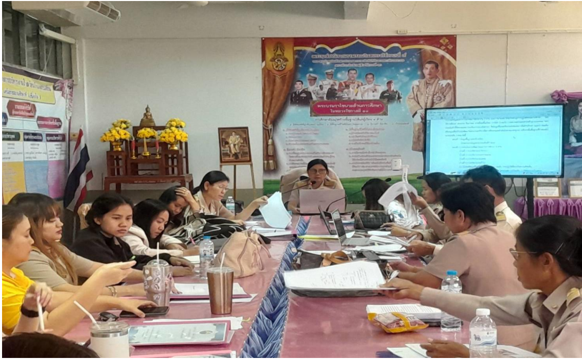
ภาพกิจกรรม PLC