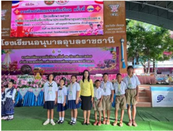
การร่วมกิจกรรมแข่งศิลปหัตถกรรมนักเรียน