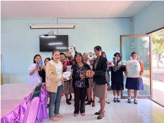
รับมอบอุปกรณ์กีฬาจากชุมชน