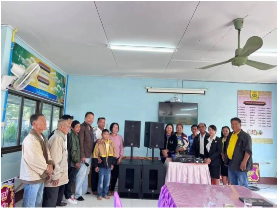
การรับมอบเครื่องเสียงจากชุมชน