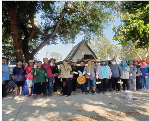
ชุมชนร่วมกิจกรรมพัฒนาสถานศึกษา