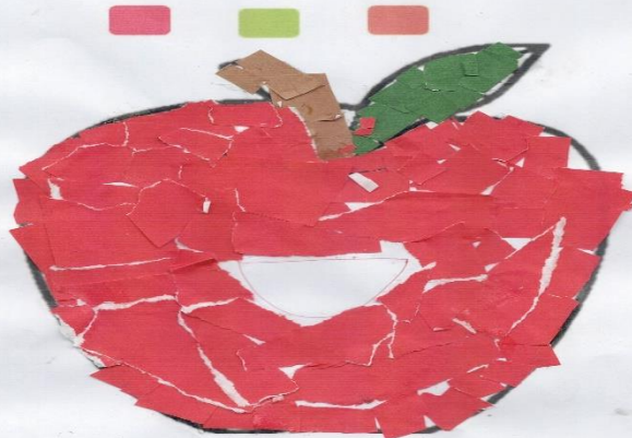
แอปเปิ้ล

คำชี้แจง ฉีกปะ ผลไม้ให้สวยงาม พร้อมเขียนคำในบรรทัดที่ครูกำหนดให้