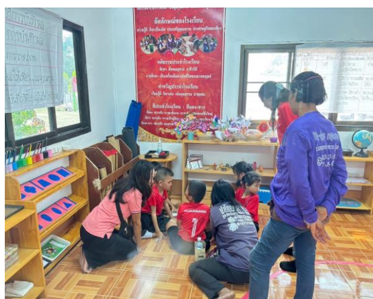
กิจกรรม Open House ระดับชั้นอนุบาล