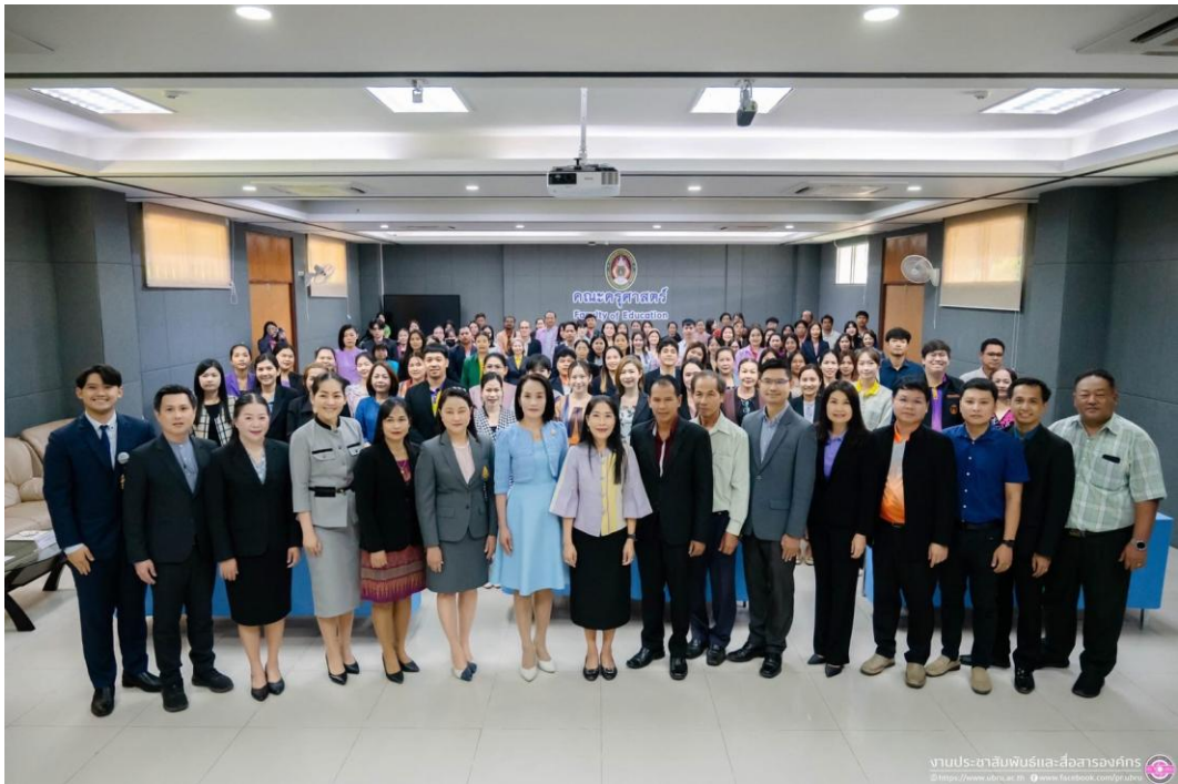
กิจกรรมการอบรมพัฒนาของข้าราชการครู