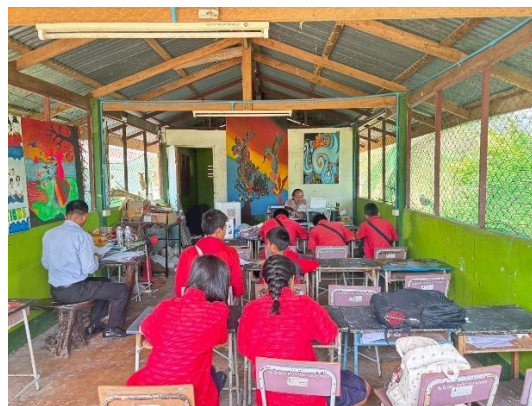
กิจกรรมการนิเทศ ชั้นเรียน