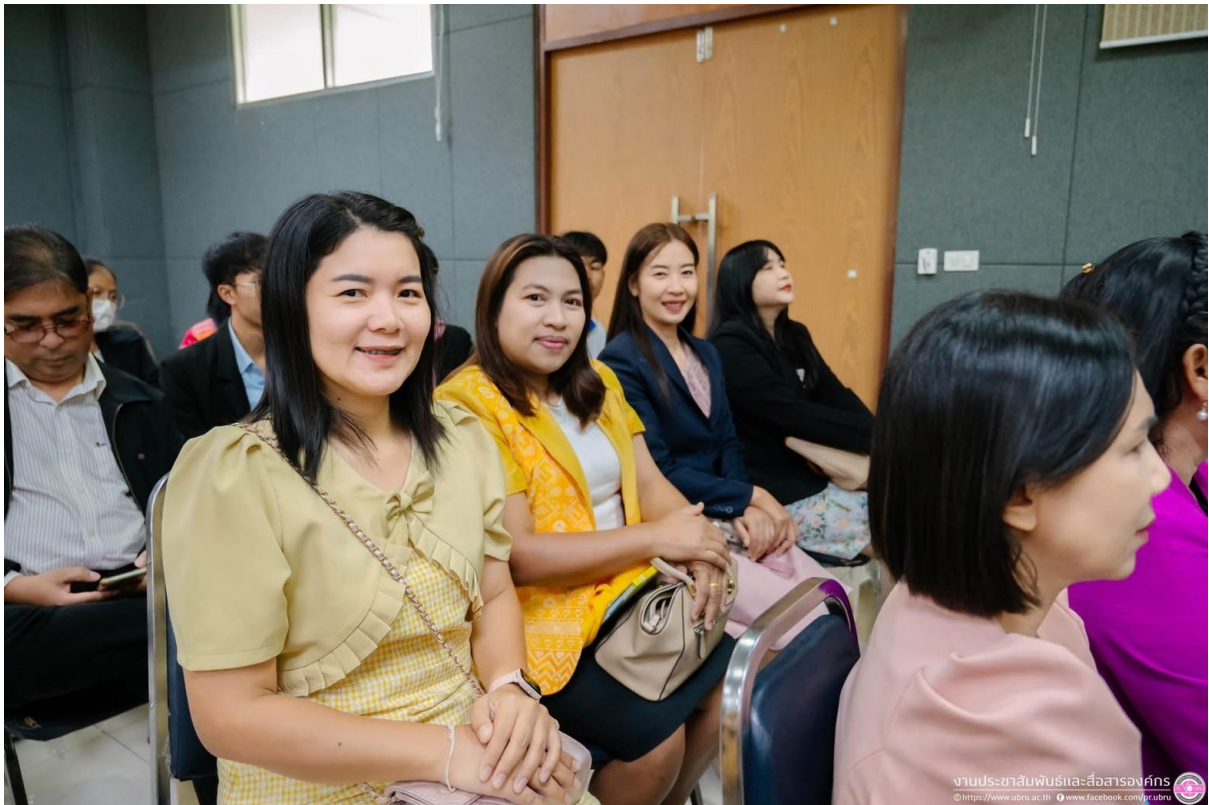
กิจกรรมการอบรมพัฒนาของข้าราชการครู