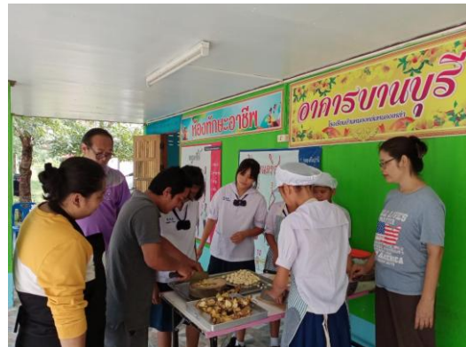
ผู้ประกอบการร่วมเป็นวิทยากรอบรมทักษะอาชีพ