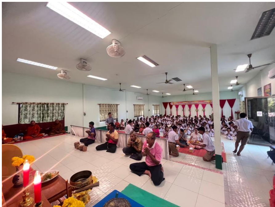
ภาพกิจกรรมการเสริมสร้างคุณลักษณะอันพึงประสงค์