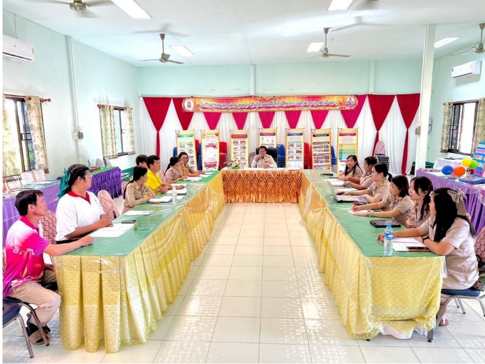
การประชุมชี้แจงทำความเข้าใจการดำเนินงาน