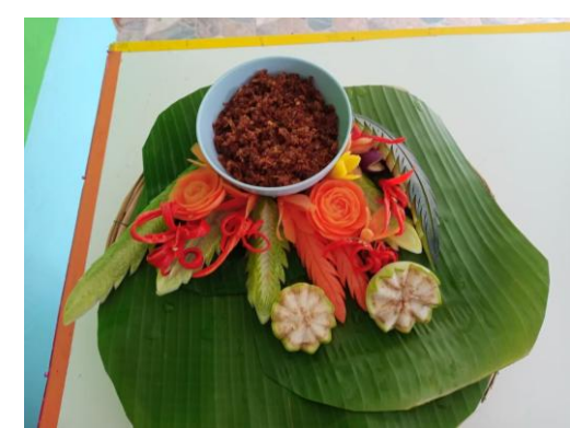
การเรียนงานอาชีพ การทำน้ำพริกปลาย่าง