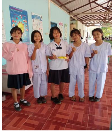
ทักษะอาชีพ ทำมะม่วงแช่อิ่ม