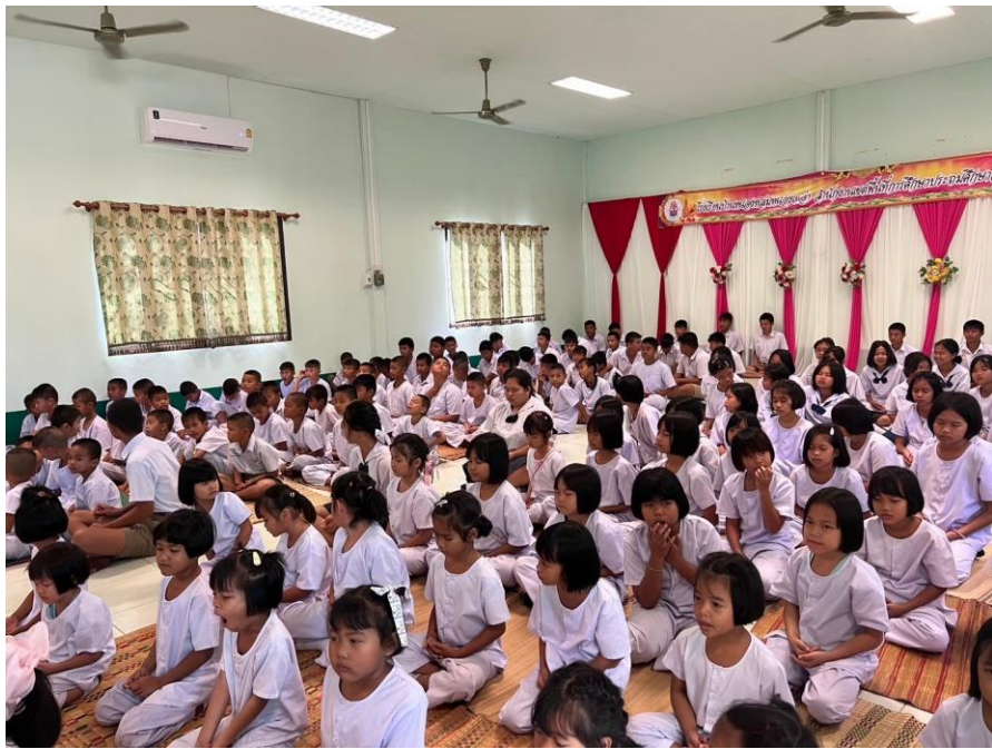
ภาพกิจกรรมผลที่เกิดกับผู้เรียน