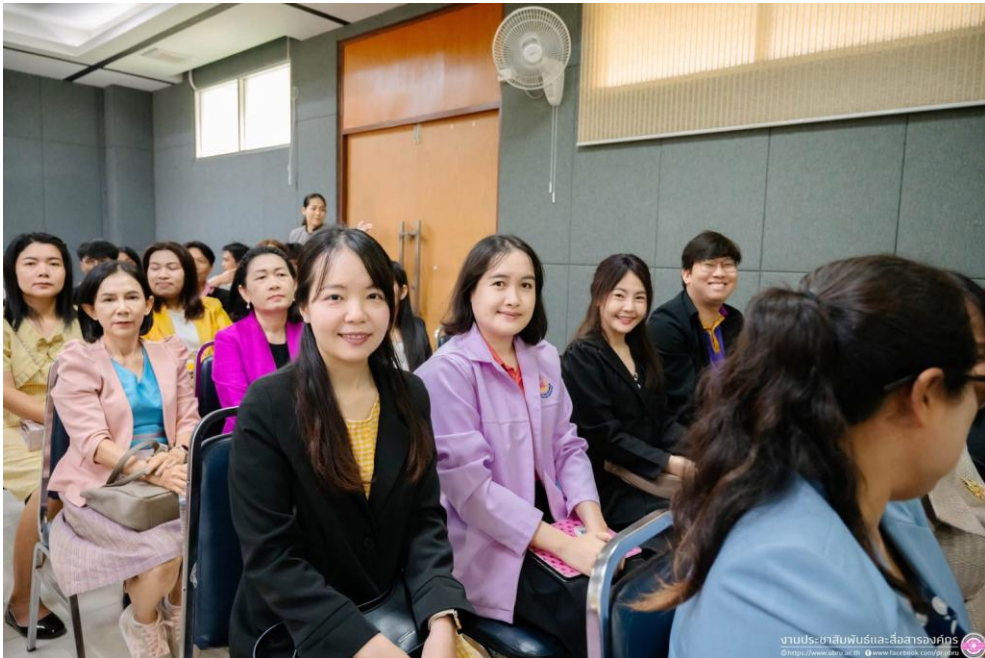
กิจกรรมการอบรมพัฒนาของข้าราชการครู