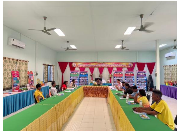
กิจกรรมการประชุมคณะกรรมการสถานศึกษาขั้นพื้นฐานเพื่อร่วมขับเคลื่อนแผนงานโครงการ