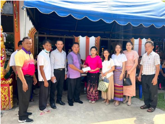
ภาพกิจกรรม ผลที่เกิดกับผู้ปกครองและชุมชน