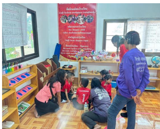
กิจกรรม Open House ระดับชั้นอนุบาล