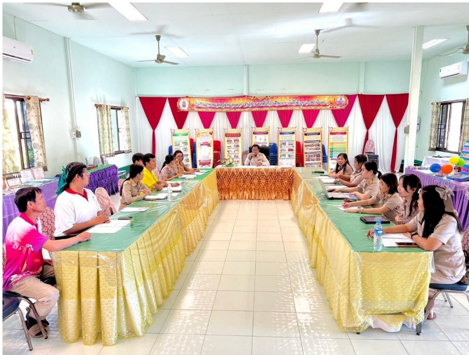
ภาพกิจกรรมการประชุมครูเพื่อสร้างความเข้าใจในการดำเนินงาน