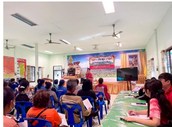
กิจกรรมประชุมผู้ปกครอง และร่วมบุญประเพณีกับชุมชน