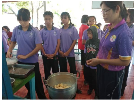
ทักษะอาชีพ ทำกล้วยแช่อิ่ม