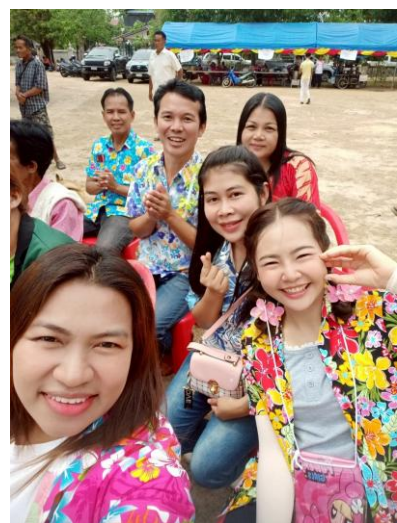
โรงเรียนบ้านหนองหล่มหนองเหล่า ทำโรงงาน ร่วมงานยกช่อฟ้า วัดบ้านหนองหล่ม