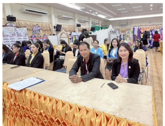
ประเมินกิจกรรมบ้านวิทยน้อย ระดับปฐมวัย