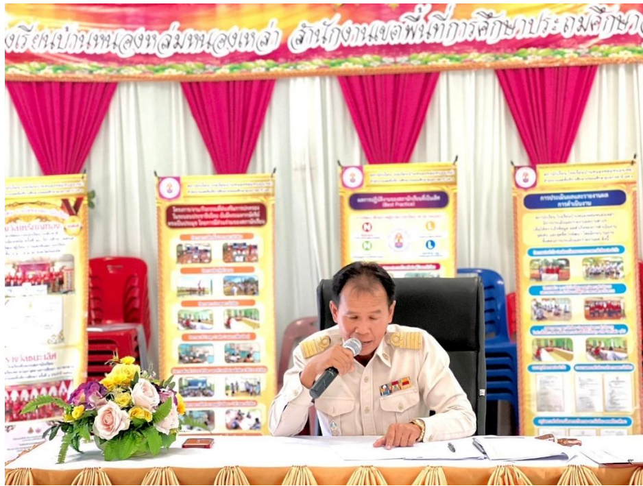
ภาพกิจกรรม ผลที่เกิดกับสถานศึกษา