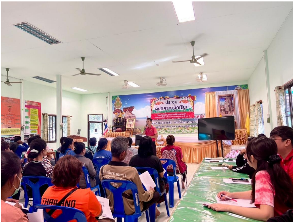
กิจกรรมการประชุมผู้ปกครอง