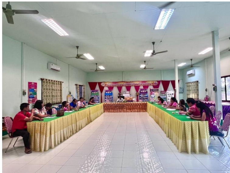
ภาพกิจกรรม PLC