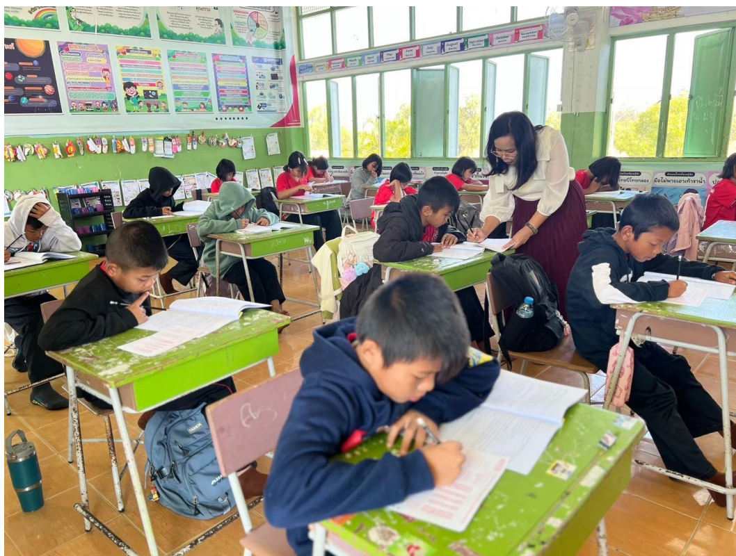
มหาวิทยาลัยหอการค้า เก็บข้อมูลโรงเรียนนำร่องเขตพื้นที่นวัตกรรม