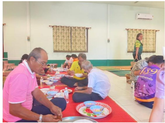
กิจกรรมทำบุญเลี้ยงพระที่โรงเรียนบ้านหนองหล่มหนองเหล่าร่วมกับชุมชน