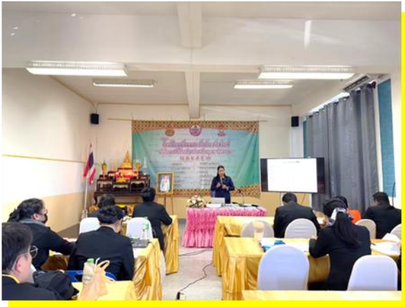
การอบรมเชิงปฏิบัติการพัฒนานวัตกรรม กับข้อตกลงในการพัฒนางาน สู่การจัดการเรียนรู้เชิงรุก Active Learning