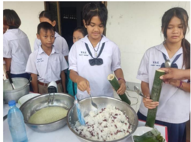
บรรจุข้าวใส่ลำไม้ไผ่