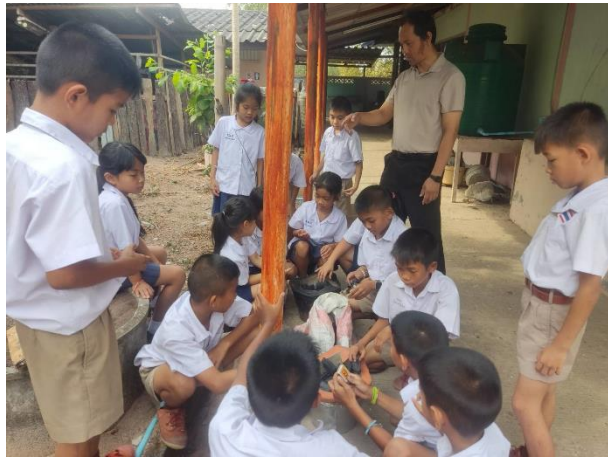
นักเรียนเรียนรู้วิธีการจุดไฟ