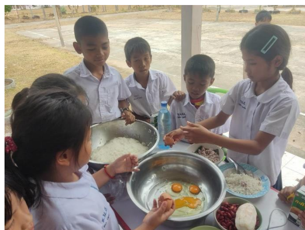
จัดเตรียมวัตถุดิบในการทำข้าวหลาม