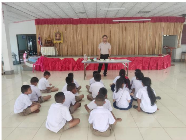
นักเรียนฟังลำดับขั้นตอนในการทำข้าวหลาม