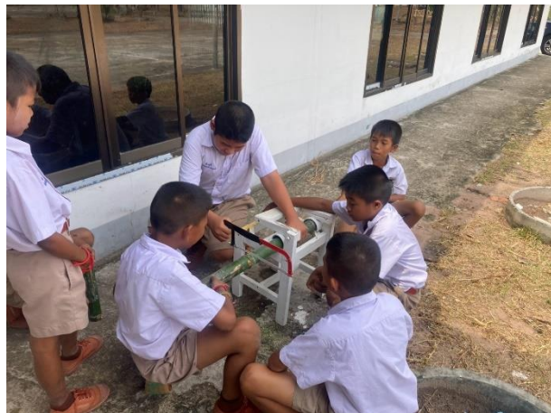
นักเรียนเตรียมอุปกรณ์ในการบรรจุ