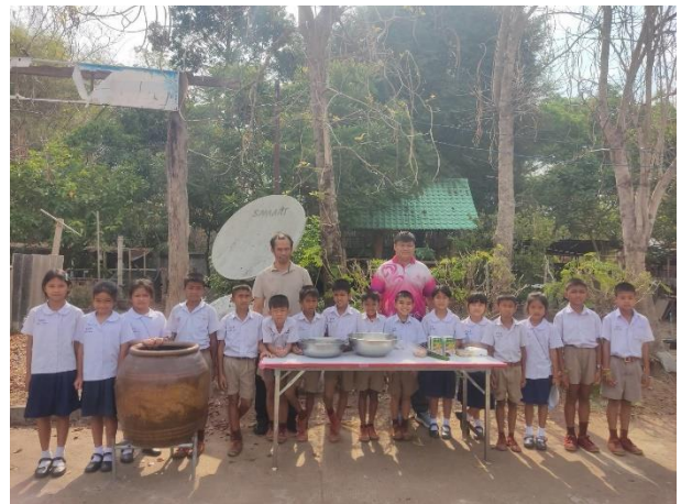
นำไปอบในโอ่งอบไร่ควีน