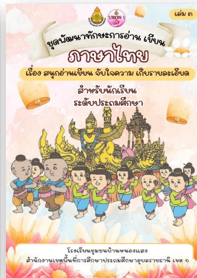
นวัตกรรมที่ใช้ในการจัดการเรียนรู้