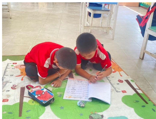
การทำแบบฝึก เพื่อเรียนรู้เกี่ยวกับจังหวัดอุบลราชธานี สถานที่ท่องเที่ยว และอาหารขึ้นชื่อ