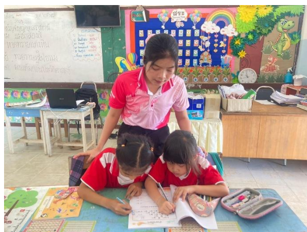
การทำแบบฝึก เพื่อเรียนรู้เกี่ยวกับจังหวัดอุบลราชธานี สถานที่ท่องเที่ยว และอาหารขึ้นชื่อ