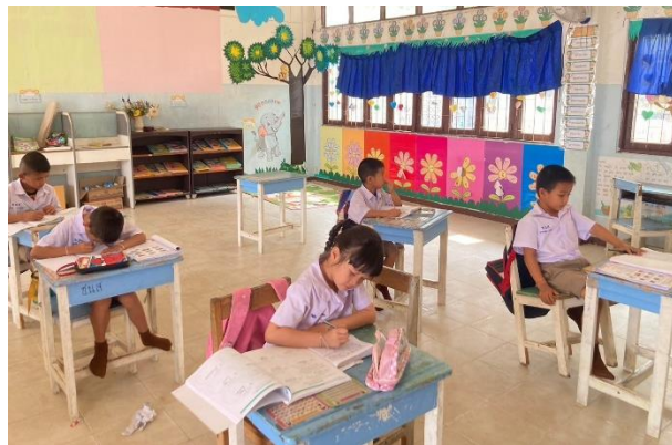
นำเข้าสู่บทเรียน โดยใช้คำถามกระตุ้นความคิดเกี่ยวกับจังหวัดอุบลราชธานี