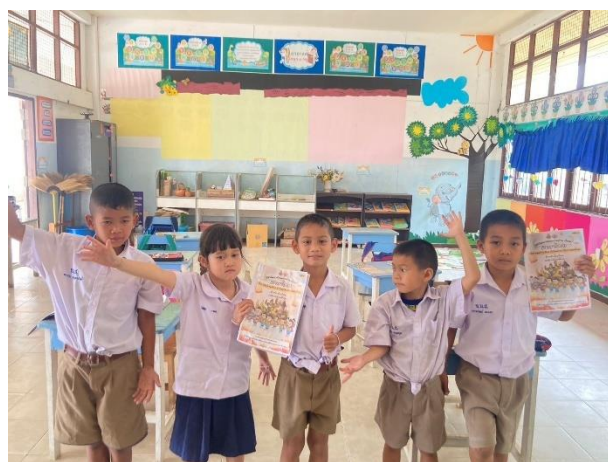
การจัดการเรียนรู้โดยชุดพัฒนาทักษะการอ่าน เขียน เล่ม 3