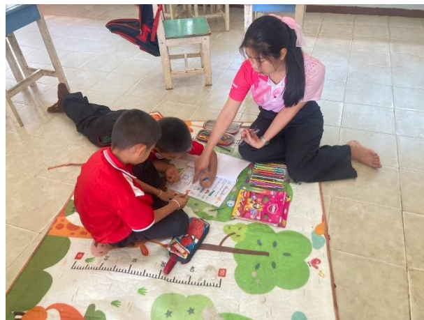
การจัดการเรียนรู้เกี่ยวกับการอ่านคำขวัญจังหวัดอุบลราชธานี