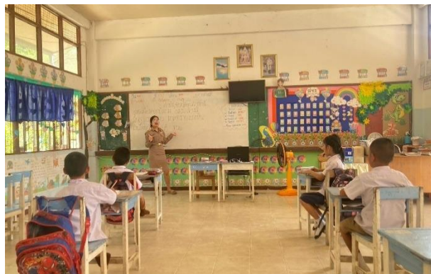
การจัดการเรียนรู้เกี่ยวกับการอ่านคำขวัญจังหวัดอุบลราชธานี