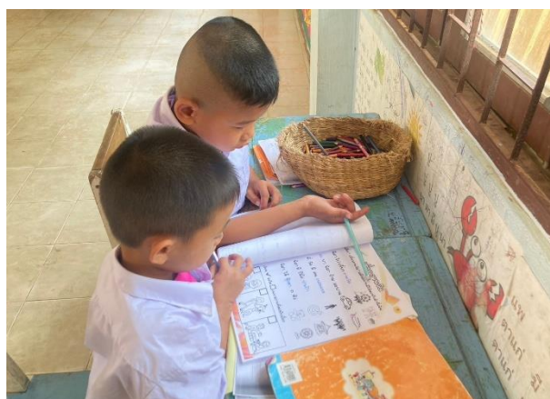
การทำแบบฝึก เพื่อเรียนรู้เกี่ยวกับจังหวัดอุบลราชธานี สถานที่ท่องเที่ยว และอาหารขึ้นชื่อ